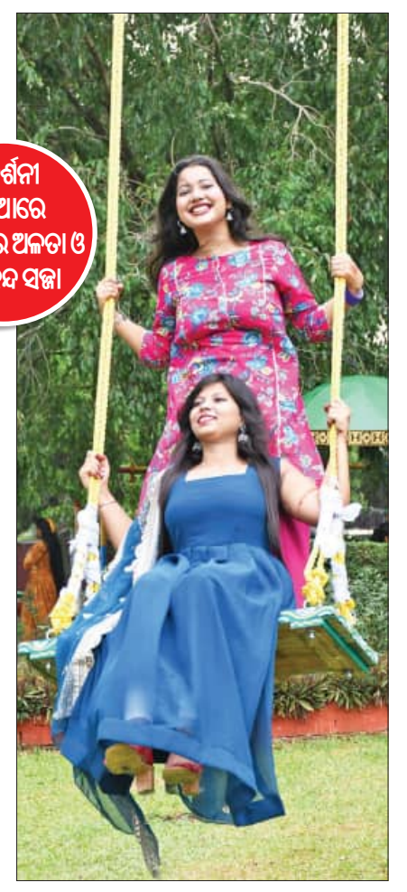
ପ୍ରଦର୍ଶନୀ ପଡ଼ିଆରେ ମାଗଣାରେ ଅଳତା ଓ ମେହେନ୍ଦି ସେବା