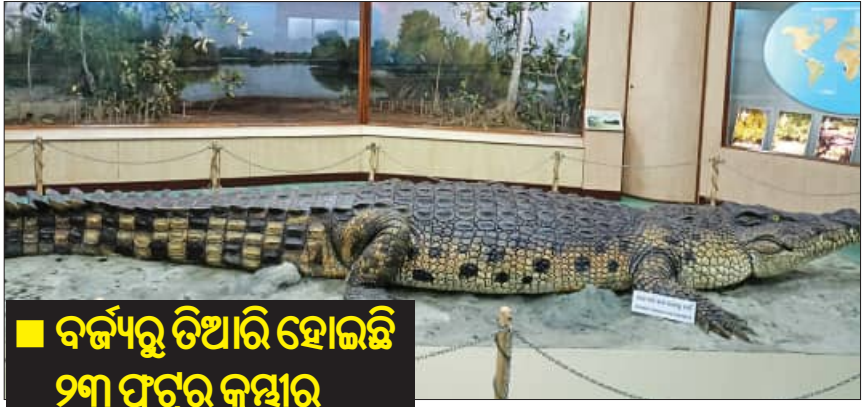
■ ବର୍ତ୍ତମାନୁ ତିଆରି ହୋଇଛି ୨୩ ପ୍ରକାର କୁସାର ■ ଖୁବ୍ ଶୀଘ୍ର ଖୋଲିବ ତିସକଭରା ସେଣ୍ଟର