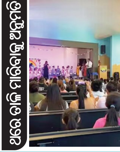
ସ୍କୁଲର ଅଭାବ ନିୟମ ପରେ ତାଲି ମାରିବାକୁ ଅନୁମତି