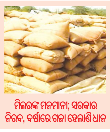
ମିଳରଙ୍କ ମନମାନା; ସରକାର ନିରବ, ବର୍ଷାରେ ଗଜା ହେଲାଣି ଧାନ

ଭୁବନେଶ୍ୱର, ୨୭।୬(ସମ୍ବିଧ): ରବି ଧାନ ବିକ୍ରି ଅବଧୂ ଥିବା ମାତ୍ର ୩ ଦିନ । ହେଲେ ଅଧାରୁ ଅଧିକ ଜିଲ୍ଲାରେ ଏପର୍ଯ୍ୟନ୍ତ ମଣ୍ଡିରୁ ଧାନ ଉଠିନି । ଅଧିକାଂଶ ଜିଲ୍ଲାରେ ଖୋଲା ଆକାଶ ତଳେ ଧାନ ପଡ଼ି ବର୍ଷାରେ ଗଜା ହେଲାଣି । ଏହାକୁ ନେଇ ରାଜ୍ୟବ୍ୟାପୀ ଚାଷୀଙ୍କ ଭିତରେ ଅସନ୍ତୋଷ ଗୁହୁଳିବାରେ ଲାଗିଛି । ମାତ୍ର ସରକାର ଏହାକୁ କର୍ତ୍ତୃପାତ କରୁନାହାନ୍ତି । ମିଳରମାନେ ଧାନ କିଣାରେ ମନମାନି କରୁଛନ୍ତି । ଟୋକନ ତାରିଖ ଥିଲେ ବି ଧାନ ଉଠାଉନାହାନ୍ତି । ବିଶେଷକରି ଯେଉଁମାନେ କଟକରୁ ଧାନ ଆଣି ହେଉଛନ୍ତି, ତାଙ୍କ ଧାନ ଉଠୁଛି । ଯେଉଁମାନେ ବିରୋଧ କରୁଛନ୍ତି, ସେମାନଙ୍କ ଧାନ ଦିନ ଦିନ ଧରି ପଡ଼ି ରହୁଛି । ଖରିଦ୍ ଧାନ କିଣାବେଳେ ଏଭଳି ସମସ୍ୟା ଉଠୁଛି । ରବିରେ ଏହି ସମସ୍ୟାର ମୁକାବିଲା ହେବନି ବୋଲି ସରକାର କହିଥିଲେ । ମାତ୍ର ସରକାରଙ୍କ କୋହଳ ପଣ ଓ ଅଧିକାରୀଙ୍କ ଖାମୁଖିଆଲିଗୁଣ ଯୋଗୁଁ ବିଚରା ଚାଷୀ ନିଜ ଉତ୍ପାଦିତ ଧାନ ବିକ୍ରି କରି ନ ପାରି ଦହଗଞ୍ଜ ହେଉଛି । ଧାନର ସର୍ବନିମ୍ନ ସହାୟକ ମୂଲ୍ୟ ବୃଦ୍ଧିରେ