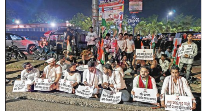
ଦଳିତମାନଙ୍କ ଉପରେ ହେଉଥିବା ଅନ୍ୟାୟ ଓ ଅତ୍ୟାଚାର ବିରୋଧରେ ଗଞ୍ଜାମ ଜିଲ୍ଲା ସୁବ କଂଗ୍ରେସ ପକ୍ଷରୁ ଶାନ୍ତିପୂର୍ଣ୍ଣ ପ୍ରତିବାଦ