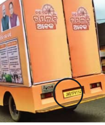
ଦିଆଯିବ ବୋଲି କହୁଛନ୍ତି; ଅନ୍ୟପକ୍ଷରେ ସରକାରଙ୍କ ପ୍ରଚାର ପାଇଁ ଓଡ଼ିଆ ଗାଡ଼ି ମାଲିକଙ୍କ ପରିବର୍ତ୍ତେ ଝାଡ଼ଖଣ୍ଡ ଓ ଛତିଶଗଡ଼ ।

ମାଇକ୍ ଜରିଆରେ ସରକାରଙ୍କ ତଥାକଥିତ ବିକାଶର ରେକର୍ଡ଼ ଗୁଣଗାନ କରାଯାଉଛି । ମାତ୍ର ବିଦ୍ୟୁତ୍ ହେଉଛି ରାଜଧାନୀ ଭୁବନେଶ୍ୱର ସହ ରାଜ୍ୟର କୋଣ ଅନୁକୋଣରେ ଗୁରୁତ୍ୱପୂର୍ଣ୍ଣ ପ୍ରାୟତଃ ସବୁ ଗାଡ଼ି ଝାଡ଼ଖଣ୍ଡ ଓ ଛତିଶଗଡ଼ରୁ ଉଦ୍ଧାରଣ ଅଣା ଯାଇଛି । ଗୋଟିଏ ପଟେ ବିଜେପି ଓ ରାଜ୍ୟ ସରକାର ନିଜକୁ ଓଡ଼ିଆ ଅସ୍ମିତାର ଧରଣୀରେ ବୋଲି ଘୋଷି ହେଉଛନ୍ତି, ଓଡ଼ିଆ ଲୋକଙ୍କ ନିୟୁକ୍ତି ବୃଦ୍ଧି ଉପରେ ଗୁରୁତ୍ୱ