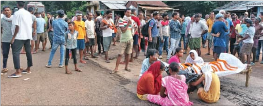
ବାରିପଦା-ଉଦଳା ରାସ୍ତାରେ କଳିକା ଶ୍ରଦ୍ଧା ଆରମ୍ଭ ହୋଇ ଅନ୍ଧାରୁ ବାଲୁ ରହିଛି। ଫଳରେ ସାନବାହନ ଯାତାୟତ ଠିକ୍ ହୋଇଯାଇଛି। ଖବର ପାଇ ବାରିପଦା ବିଧାୟକ ପ୍ରକାଶ

ସାନକେରକୋ/ବଡ଼ସାହି ୧୩।୬(ସମିତ): ବଡ଼ସାହି ଥାନା ଅନ୍ତର୍ଗତ ନାଉପାଳ ଗ୍ରାମରେ ବୁଧବାର ସନ୍ଧ୍ୟାରେ ବିଦ୍ୟୁତ୍ ତାର ଫୁଟିଗଲେ ଆସି କଣେ ନାବାଳକର ମୃତ୍ୟୁ ଘଟିଛି।