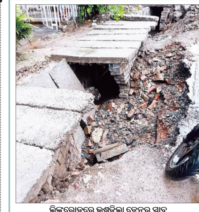
ଲିଙ୍କରୋଡ଼ରେ ଭୁସ୍ତୁଳିଲା ଡ୍ରେନର ସ୍ଵାଭ

ସମସ୍ତ ରୋଗୀଙ୍କୁ ଶିଡ଼ି ଦ୍ଵାରା ବୋହି ଅଣ୍ଟାଧାରରେ ବେଳେ ଯଦି କୌଣସି ଅପରାଧ ଘଟିଥାଏ, ତାହେଲେ ଏଥି ପାଇଁ କିଏ ଦାୟା ରହିଥାନ୍ତା ତାହାକୁ ନେଇ ପ୍ରଶ୍ନ ଉଠିଛି। ଅନ୍ୟପକ୍ଷରେ ଏସ୍‌ସି ମେଡିକାଲରେ ବ୍ୟାଚେରା ଗାଡ଼ି ସମସ୍ୟା ଲାଗି ରହିଥିବା ଜଣାପଡ଼ିଛି। ଆଜି ହେମାଟୋଲୋଜି ଓ ପିଡି ନିକଟରେ କିଛି ରୋଗୀ ଖର୍ଚ୍ଚକୁ ସ୍ଵାନାନ୍ତର ହେବା ନିମନ୍ତେ ଘଣ୍ଟାଏରୁ ଅଧିକ ସମୟ ଅପେକ୍ଷା କରି ରହିଥିଲେ ସୁଦ୍ଧା ବ୍ୟାଚେରା ଗାଡ଼ି ପହଞ୍ଚି ନଥିଲା। ରୋଗୀମାନେ ବାଧ୍ୟହୋଇ ଚାଲିଚାଲି ଖର୍ଚ୍ଚକୁ ଯାଉଥିବା ଦେଖିବାକୁ ମିଳିଥିଲା। ପ୍ରକାଶଯୋଗ୍ୟ, ଏସ୍‌ସି ମେଡିକାଲରେ ରୋଗୀଙ୍କୁ ଗୋଟିଏ ଘାଟିରୁ ଅନ୍ୟତ୍ର ନେବା ଆଣିବା କରିବା କିମ୍ବା କାଳୁଅଲଟିରୁ ଖର୍ଚ୍ଚକୁ ନେବା ନିମନ୍ତେ ବ୍ୟାଚେରା ଗାଡ଼ି ବ୍ୟବସ୍ଥା ଦୀର୍ଘ ୧୫ ବର୍ଷ ହେବ ଉପଲବ୍ଧ ରହିଛି। ଏହାର ରକ୍ଷଣାବେକ୍ଷଣ କରିବା ନିମନ୍ତେ ଏକ ଘରୋଇ ସଂସ୍ଥାକୁ ଦାୟିତ୍ଵ ଦିଆଯାଇଥିଲା। ବ୍ୟାଚେରା ଗାଡ଼ିର ସେବା ବାବଦରେ ଲୋକଙ୍କ ସହଜରେ ଜାଣି ପାରିବା ନିମନ୍ତେ ମେଡିକାଲ ପରିସରରେ ୪ଟି ସହାୟତା କେନ୍ଦ୍ର ଖୋଲିଛି। ହେଲେ ମେଡିକାଲରେ ବ୍ୟାଚେରା ଗାଡ଼ିର ରକ୍ଷଣାବେକ୍ଷଣ ଠିକ୍ ଭାବେ କରାଯାଇ ନଥିବାରୁ ରୋଗୀ ସମସ୍ୟା ବହୁଶୁଣିତ ହେବାରେ ଲାଗିଛି।