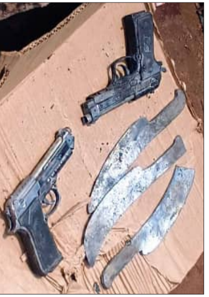
ହାତରେ ଧେରିଥିଲେ । ଜବତ କରିଥିବା ବନ୍ଧୁକକୁ ପୁଲିସ ପୁଞ୍ଜିତ ତଥା ଖେଳାବା ବନ୍ଧୁକ ବୋଲି ପ୍ରକାଶ କରିବା ପରେ ବ୍ୟାଗରେ କାହିଁକି ନିଆଁ ଲାଗିଲା ବୋଲି

ପ୍ରଶ୍ନ ଉଠିଛି । ବ୍ୟାଗ ଭିତରେ କିଛି ଦସନଯୁକ୍ତ ସାମଗ୍ରୀ କିମ୍ବା ବିସ୍ଫୋରକ ଥିଲା କି । ଘଟଣାକୁ ପୁଲିସ ଗମ୍ଭୀର ଭାବେ ଗ୍ରହଣ କରି ତଦନ୍ତ କରିବାର ଆବଶ୍ୟକତା ରହିଛି । ଦୁର୍ଘଟଣାରେ ହାତ୍ତ୍ୟାୟୀ ଏବଂ ଧକାରଙ୍ଗର ଚି-ସାର୍ଟି ପିନ୍ଧିଥିବା ସ୍ଥାନୀୟ ଲୋକେ କହିଛନ୍ତି । କୌଣସି ସ୍ଥାନରେ ଅପରାଧ ଘଟଣା ଘୋଷାକ ବଦଳାଇ ଖସିଯିବାକୁ ଚେଷ୍ଟା କରିଥିଲେ କିମ୍ବା ସେମାନେ ଏହି ରାସ୍ତା ସହିତ ଆଗରୁ ପରିଚିତ କି ଏମିତି ଅନେକ ପ୍ରଶ୍ନ ନକରନ୍ତୁ ଆସୁଛି । ଜାତୀୟ ରାଜପଥ ଉପରେ ନ ଯାଇ ହଠାତ ରାସ୍ତା ବଦଳାଇ ନଦୀ ବନ୍ଧରେ ଖସିଯିବାକୁ ସେମାନେ ନିରାପଦ ଭାବିଲେ କି ତାହା ମଧ୍ୟ ଆଶଙ୍କା କରାଯାଇପାରେ । ସେମାନେ ଅପରାଧ ଘଟଣାଆଳୁ କିମ୍ବା ଅପରାଧ ଘଟଣାଦାରୁ ଯୋଜନା କରିଯାଇଥିବୁ । ଦୁର୍ଘଟଣାରେ ସେହି ରାସ୍ତା ତଥା ଜେନାପୁର ଥାନା ଅଞ୍ଚଳକୁ ସୁରକ୍ଷିତ ସ୍ଥାନ ଭାବେ ପୁଲିସ ନେଇଛନ୍ତି ବୋଲି ବୁଝାକା ମତ ଦେଇଛନ୍ତି । ପୁଲିସ ବନ୍ଧୁକ ଦେଖାଇ ଭୟଭୀତ କରି ବୋରି କିମ୍ବା ଛିନିତା ଭଳି ଅପରାଧ କରିଥାଇପାରିବେ ବୋଲି ଅନୁମାନ କରାଯାଇଛି । ମାତ୍ର ଜିଲ୍ଲା ପୁଲିସ ଏହାକୁ ଗୁରୁତର ସହ ଗ୍ରହଣ କରି ଦିନ ଦିପ୍ରହରରେ ଏକଲି ମାରଣାସ୍ତ୍ର ଏବଂ ଅପରାଧୀଙ୍କ ଗତିବିଧି ଉପରେ ନଜର ଦେବାକୁ ଦାବି ହୋଇଛି ।