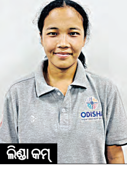
ଭୁବନେଶ୍ୱର, ୨।୫ (ସମିପ)