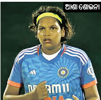
ସିଲହେଟ୍, ୨।୫ (ଏକେଡ଼ି)

ବାଂଲାଦେଶ ଗଣ୍ଡରେ ଥିବା ଭାରତୀୟ ମହିଳା କ୍ରିକେଟ୍ ଦଳ କ୍ରମାଗତ ୪ର୍ଥ ଟି-୨୦ ମ୍ୟାଚରେ ବିଜୟ ହାସଲ କରିଛି। ସୋମବାର ସ୍ଥାନୀୟ ସିଲହେଟ୍ ଇଣ୍ଟରନ୍ୟାସନାଲ କ୍ରିକେଟ୍ ଷ୍ଟାଡ଼ିୟମରେ ଖେଳାଯାଇଥିବା ଟି-୨୦ ସିରିଜର ୪ର୍ଥ ମ୍ୟାଚରେ ଭାରତ ଡିଏଲଏସ୍ ପକ୍ଷରେ ୫୬ ରନରେ ଘରୋଇ ବାଂଲାଦେଶ ମହିଳା କ୍ରିକେଟ୍ ଦଳକୁ ପରାସ୍ତ କରିଛି। ପୂର୍ବରୁ ପ୍ରଥମ ଗାଡି ମ୍ୟାଚକୁ ୨୪, ଦ୍ୱିତୀୟ ମ୍ୟାଚ ଓ ତି ତିନିମ୍ୟାଚ ୨୨ ରନ ଲେଖାଏ