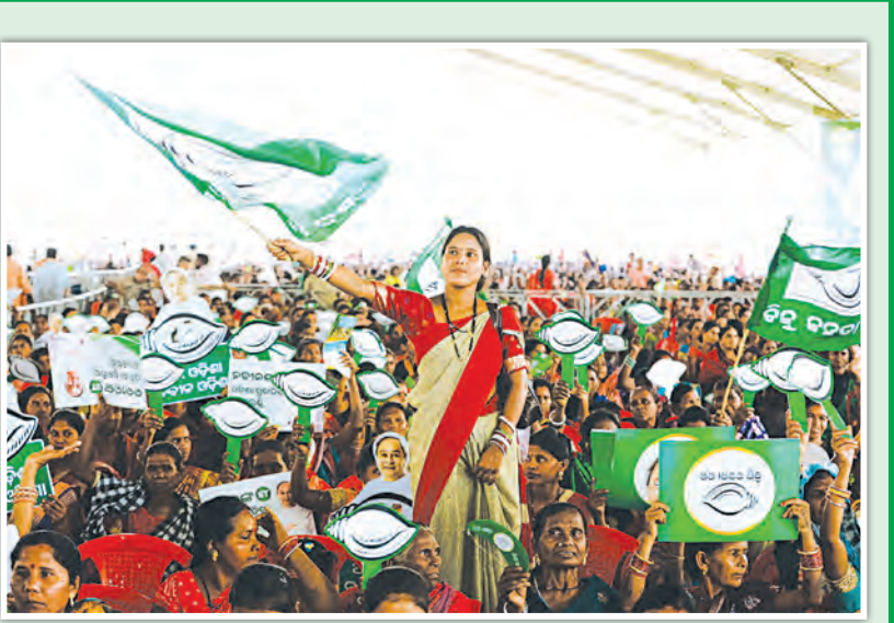
ଭବାନୀପାଟଣା ଓ ନୁଆପଡ଼ାରେ ବିଜେଡି ସୁପ୍ରିମୋ ନବୀନ ପଟ୍ଟନାୟକଙ୍କ ପ୍ରଚାର ଅବସରରେ ଉତ୍ସାହିତ ବିଜେଡି କର୍ମୀ, ନେତା, ଜନସାଧାରଣ