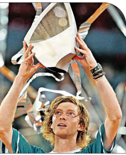
ମାଡ଼ିନ୍, ୨।୫ (ଏକେଡ଼ି)

ମାଡ଼ିନ୍ ଓପନ୍ ଟେନିସ୍ ଟୁର୍ଣ୍ଣାମେଣ୍ଟର ପୁରୁଷ ଏକକ ପ୍ରତିଯୋଗିତାରେ ଭୁବନେଶ୍ୱରୀ ୨ମ ସିଡ୍ ଖେଳାଳି ଆଣ୍ଡ୍ରେ ଭୁବଲେଉ ଚାମ୍ପିଅନ ହୋଇଛନ୍ତି। ଏକ ଫାଇନାଲରେ ଭୁବଲେଉ ୪-୬, ୬-୫, ୬-୫ ସେଟ୍‌ରେ ଅଣ୍ଡ୍ରେ କାନାଡାର ଫେଲିକ୍ସ ଅଗୁର ଅଲିଆଜିମ୍‌ଙ୍କୁ ପରାସ୍ତ କରି ଟାଇଟଲ୍ ହାସଲ କରିଛନ୍ତି। ଏଥିସହ ସେ କ୍ୟାରିୟରର ଦ୍ୱିତୀୟ ମାଷ୍ଟର୍‌୧୦୦୦ ମୋଟ୍ ଉପରେ ୧୭ତମ ଏକକ ଟାଇଟଲ୍ ହାସଲ କରିଛନ୍ତି। ପ୍ରଥମ ସେଟ୍‌ରେ ପରାସ୍ତ ହୋଇଥିଲେ ମଧ୍ୟ ପ୍ରତ୍ୟାବର୍ତ୍ତନ କରି ସେ ବାକି ଦୁଇଟି ସେଟ୍‌ରେ ବାକି ମାରିଥିଲେ। ପୂର୍ବରୁ ସେ ସେମିଫାଇନାଲରେ ଆମେରିକାର ହାଡ୍‌ସନ୍ ସିଡ୍ ଖେଳାଳି ଟେଲର ଫ୍ରିଜ୍‌ଙ୍କୁ ୬-୪, ୬-୩ ସିଡ୍‌ସ୍‌ରେ ହରାଇ ଫାଇନାଲକୁ ଉଠିଥିଲେ।