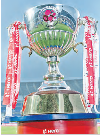
କୋଲକାତା, ୫।୫ (ଏକେଡ଼ି)

ଭାରତର ସବୁଠୁ ଶ୍ରେଷ୍ଠ କ୍ଲବ୍‌ଲିଗ୍ ପୁଟବଲ ପ୍ରତିଯୋଗିତା ଇଣ୍ଡିଆନ୍ ସୁପର ଲିଗ୍ (ଆଇଏସଏଲ୍) ର ୧୦ମ ଫ୍‌ଏରଷ୍ଟ ଉଦ୍‌ଘାଟିତ ହୋଇଯାଇଛି। ଶନିବାର ସ୍ଥାନୀୟ ସକ୍ରିୟ କ୍ଲବ୍ ଖୁବ୍‌ପ୍ରତିଯୋଗୀ ଅନୁଷ୍ଠିତ ଗ୍ରାଣ୍ଡ ଫାଇନାଲରେ ଯେଉଁମାନେ ମୋହନ ବାଗାନ ପୁଟବଲ କ୍ଲବ୍‌ସ୍କୁ ୩-୧ ଗୋଲରେ ପରାସ୍ତ କରି ମୁମ୍ବାଇ ସିଟି ହିଟାୟର ଲାଗି ଏହି ସମ୍ମାନଜନକ ଟ୍ରଫି ହାସଲ କରିଛି। ପଲ୍‌ଲେ ଲିଗ୍ ସିଲ୍ଲୁ ବିଜେତା ମୋହନ ବାଗାନର ଟ୍ରଫି ଜିତିବା ସ୍ୱପ୍ନ ଅଧୁରା ରହିଯାଇଛି। ଆଇଏସଏଲ୍‌ର ଏହି ଫ୍‌ଏରଷ୍ଟ ପରିଫେକ୍ସନ୍ ଉପରେ ନଜର ପକାଇଲେ ପ୍ରତିଯୋଗିତାରେ ୧୦ଟି ଦଳ ଅଂଶଗ୍ରହଣ କରିଥିଲେ। ଏଥିରେ ପାଇନାଲକୁ ମିଶାଇ ୧୩ଟି ମ୍ୟାଚ୍ ଖେଳାଯାଇଥିବାବେଳେ ମୋଟ ୩୮୪