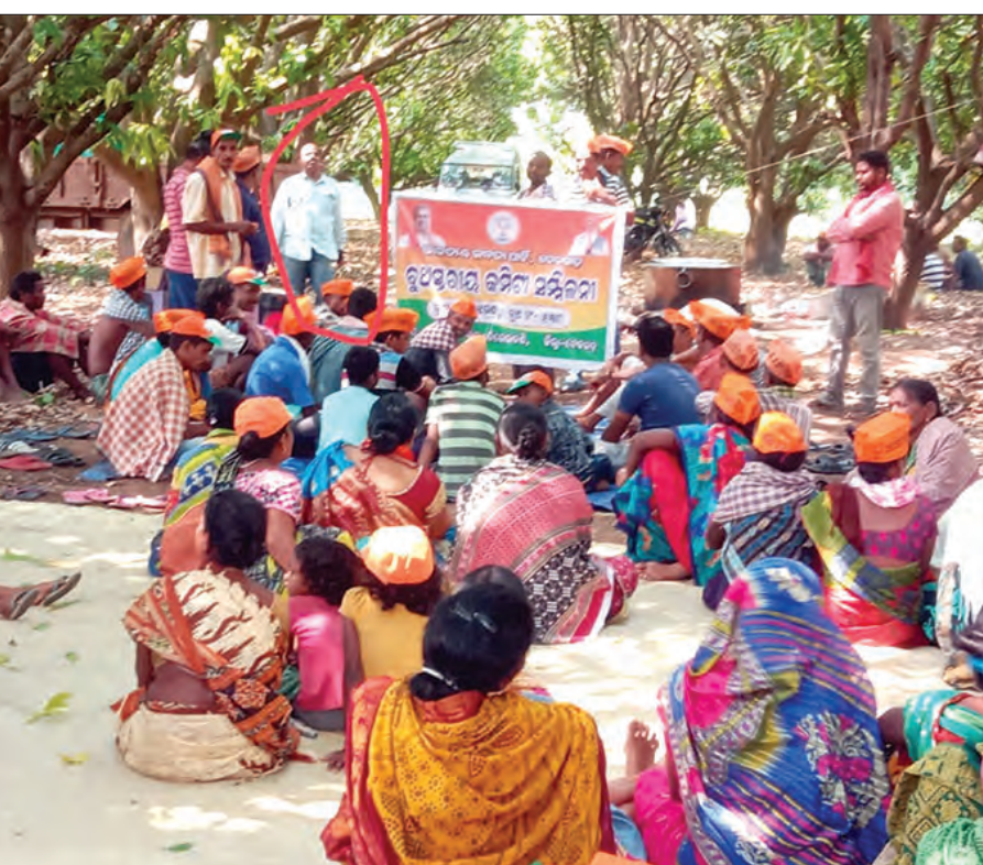
ଝାରସୁଗୁଡ଼ା, ୫୫୫(ସମ୍ପାଦକ): ବିଜେପି ନିର୍ବାଚନରେ ଦେବଗଡ଼ ବିଜେପିର ପ୍ରଚାର ପ୍ରସାରରେ ଶିକ୍ଷକ ଗୋଷ୍ଠୀ ମାଡ଼ିଥିବାର ଏକାଧିକ ଚିତ୍ର ସାମ୍ବାଦିକ ଆସୁଥିବା ବେଳେ ରବିବାର ପୁଣିଥରେ ବିଜେପିର ବୁଧସ୍ୱରାୟ କର୍ମୀ ସମ୍ମିଳନୀରେ ଦେବଗଡ଼ ମହିଳା ମହାବିଦ୍ୟାଳୟରେ

ଚଳିତ ନିର୍ବାଚନରେ ଦେବଗଡ଼ ବିଜେପିର ପ୍ରଚାର ପ୍ରସାରରେ ଶିକ୍ଷକ ଗୋଷ୍ଠୀ ମାଡ଼ିଥିବାର ଏକାଧିକ ଚିତ୍ର ସାମ୍ବାଦିକ ଆସୁଥିବା ବେଳେ ରବିବାର ପୁଣିଥରେ ବିଜେପିର ବୁଧସ୍ୱରାୟ କର୍ମୀ ସମ୍ମିଳନୀରେ ଦେବଗଡ଼ ମହିଳା ମହାବିଦ୍ୟାଳୟରେ