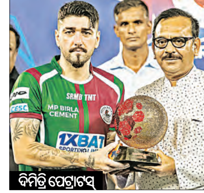
ଦିନିତ୍ରିଅସ୍କୁ ଗୋଲ୍‌ମେନ୍ ଓ

ଦିନିତ୍ରିଅସ୍କୁ ଗୋଲ୍‌ମେନ୍ ଓ ଆଇଏସଏଲ୍‌ର ଏହି ଫ୍‌ଏରଷ୍ଟରେ ବୁଲକଶ ଖୋଲାଇଁ ଏମିଟି ଲେଖାଏ ଗୋଲ୍ ଦେଇଥିଲେ। ସେମାନେ ହେଲେ ଓଡ଼ିଶା ଏସ୍‌ସିର ରୟ