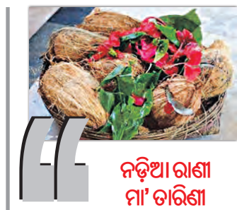
ନଡ଼ିଆ ରାଣୀ ମା' ତାରିଶା

ସଙ୍କଟ ହରିଶା, ଦୁଃଖନାଶିନୀ, ବିଜୟପ୍ରଦାୟିନୀ ମା' ତାରିଶା । ଭକତ ତାଙ୍କରେ ଉତ୍ତର ଦିଏ, ପଣତକାନ୍ତିରେ କୋଳେଇ ନିଏ । ସେ କରୁଣାମୟ ଓ ଦୟାଶୀଳ । ମା' ର ମହିମା, ଅବ୍ୟକ୍ତ ଓ ଅବର୍ଣ୍ଣନୀୟ ।