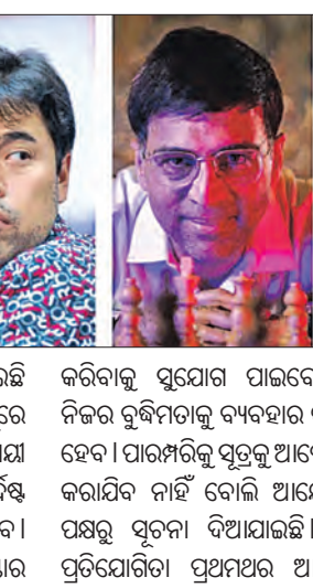
କରିବାକୁ ସୁଯୋଗ ପାଇବେ ନାହିଁ। ନିଜର ବୁକିମ୍‌ଗାଳି ବ୍ୟବହାର କରିବାକୁ ହେବ। ପାରମ୍ପରିକ ପୁରୁଷ ଆସିଆ ଗ୍ରହଣ କରାଯିବ ନାହିଁ ବୋଲି ଆୟୋଜକଙ୍କ ପକ୍ଷରୁ ସୂଚନା ଦିଆଯାଇଛି। ଏଭଳି ପ୍ରତିଯୋଗିତା ପ୍ରଥମଥର ଆୟୋଜିତ

କରିବେ ବୋଲି ଆ ଯେ। କ କ କାସାବୁଙ୍କା ଷ୍ଟ୍ ଏକ୍ସପୋଜି ଓ ଉଦ୍ଦାଳ ମରକୋ ଟେସ୍ ଫେଡେରେସନ। ଏହି ପ୍ରତିଯୋଗିତାଟି ଏକ ଭିନ୍ନ ଶୈଳୀରେ ଖେଳା ଯିବ। କୁ ପ୍ରଭାକୁ ତାହାର ନାମ ରଖାଯାଇଛି କାସାବୁଙ୍କା ଭାରିଆଣ୍ଡ୍। ଏଥିରେ ଜଣେ ଖେଳାଳି ନିଜ ଇଚ୍ଛା ଅନୁଯାୟୀ ନୁହେଁ, ବରଂ ସେମାନଙ୍କୁ ଏକ ନିର୍ଦ୍ଦିଷ୍ଟ ପୋଲିସିନ୍‌ରୁ ଖେଳିବାକୁ କୁହାଯିବ। ଏହା ଫଳରେ କେହି ପ୍ରାଧାନ୍ୟ ବିଷ୍ଣାର