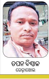
ଚନ୍ଦନ ବିଶ୍ୱାଳ ରେଡ଼ାଖୋଲ

୨୦ବର୍ଷ ହେଲାଣି ଗାଁ ପାଖ ଜଙ୍ଗଲକୁ ସୁରକ୍ଷା ଦେଇଆସୁଛନ୍ତି ରେଡ଼ାଖୋଲ ବନଖଣ୍ଡ ବଡ଼ମାଲ ରେଞ୍ଜ ସୁନାମୁଦି ଗାଁର ମହିଳାମାନେ । ବିନା ସରକାରୀ ସାହାଯ୍ୟ ଓ ପ୍ରୋତ୍ସାହନରେ ଗଛ ଲଗାଇ ଚାଙ୍ଗରା ଭୂଇଁରେ ସୃଷ୍ଟି କରିପାରିଛନ୍ତି ସୁନାର ସବୁଜ ଜଙ୍ଗଲ । ଗାଁ କୁ ଗାଁ ବୁଲି ବୁଲି ଜଙ୍ଗଲ ବିଷୟରେ ସଚେତନ କରୁଛନ୍ତି ମହିଳାମାନେ ।