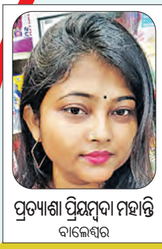
ପ୍ରତ୍ୟକ୍ଷା ପ୍ରିୟଦର୍ପା ମହାନ୍ତି ବାଲେଶ୍ୱର

ସମୟରେ ବାଲେଶ୍ୱରର ମିଠା ବା ଗଜା କାରିଗରମାନେ ମୋଗଲ ଦରବାରକୁ ଯାଇ ବାଲେଶ୍ୱରୀ ଗଜା ରାନ୍ଧୁଥିଲେ । ପରବର୍ତ୍ତୀ ସମୟରେ ଗଜା ବୁଲି ଭାଗରେ ବିଭକ୍ତ ହୋଇଗଲା ଶୁଖିଲା ଗଜା ଓ ରସ ଗଜା । ଆଗରୁ ଖାଦ୍ୟକୁ ବହୁତ ଦିନ ରଖିବା ଉଦ୍ଦେଶ୍ୟରେ ଖାଦ୍ୟ ପ୍ରସ୍ତୁତ ହେଉଥିଲା । ଦୀର୍ଘ ୧୫ ବର୍ଷ ଧରି ଗଜା ତିଆରି କରୁଥିବା ମିଠା କାରିଗର ଅମୂଲ୍ୟ ମହାନିକ କହିଛନ୍ତି, 'ଅତୀତରେ କୁଇଣ୍ଡାଲ କୁଇଣ୍ଡାଲ ଗଜା ତିଆରି କରୁଥିଲୁ । ଏବେ ତାହାର ପରିମାଣ କମିଯାଇଛି । ଲୋକେ ଏବେ ମଇଦା ଅପେକ୍ଷା ଛେନା ଜାତୀୟ ମିଠା ଅଧିକ ପସନ୍ଦ କରୁଛନ୍ତି ।