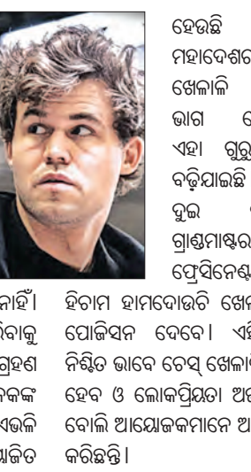
ହିବାମ ହାମ୍‌ପାଉଡି ଖେଳାଳିମାନଙ୍କୁ ପୋଲିସିନ୍ ଦେବେ। ଏହି ଷ୍ଟାଇଲ୍ ନିଶ୍ଚିତ ଭାବେ ଟେସ୍ ଖେଳାଳିଙ୍କୁ ପସନ୍ଦ ହେବ ଓ ଲୋକପ୍ରିୟତା ଅର୍ଜନ କରିବ ବୋଲି ଆୟୋଜକମାନେ ଆଶା ପ୍ରକାଶ କରିଛନ୍ତି।