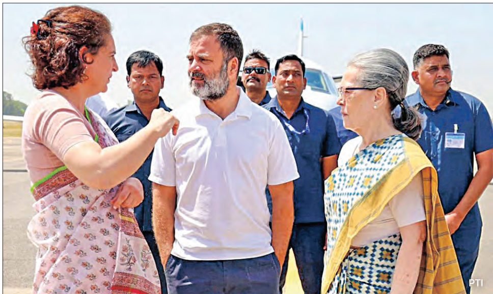
ରାଧିକାରେଲୋ ଆସନରେ କଂଗ୍ରେସ ରାହୁଲଙ୍କୁ ପ୍ରାର୍ଥୀ କରିଛି। ରାହୁଲ କେରଳର ଖାନ୍ନୁର ସ୍ୱାସ୍ଥ୍ୟ ଅଞ୍ଚଳରେ ରାଧିକାରେଲୋ ଆସନରୁ କଂଗ୍ରେସ ପ୍ରାର୍ଥୀ ଭାବେ ଲଢ଼ିଛନ୍ତି। ସେଠାରେ ଲୋକସଭା ନିର୍ବାଚନ ଦ୍ୱିତୀୟ ପର୍ଯ୍ୟାୟରେ ଗତ ୨୬ ତାରିଖରେ ମତଦାନ ସରିଛି। କଂଗ୍ରେସର ରଣନୀତିକାରମାନେ ରାହୁଲଙ୍କୁ ରାଧିକାରେଲୋରୁ ମଧ୍ୟ ନିର୍ବାଚନ ଲଢ଼ିବାକୁ ପରାମର୍ଶ ଦେଇଥିଲେ, ଯାହା ରାହୁଲ ଗ୍ରହଣ କରିଛନ୍ତି। କଂଗ୍ରେସର ରଣନୀତିକାରମାନେ ରାହୁଲଙ୍କୁ ପ୍ରାର୍ଥୀ କରିଛନ୍ତି। ଗାନ୍ଧୀ ଆମେ ଲୋକସଭା ଆସନରେ

ପିତାମହ ପିରୋଜ ଗାନ୍ଧୀ, ମାତାମହ ଇନ୍ଦିରା ଗାନ୍ଧୀ, ମା' ସୋନିଆ ଗାନ୍ଧୀଙ୍କ ପରେ ଏବେ ରାଧିକାରେଲୋରେ ନିର୍ବାଚନ ଲଢ଼ିବେ ରାହୁଲ ଗାନ୍ଧୀ। ଆଜି ଅପରାହ୍ନରେ ରାହୁଲ ରାଧିକାରେଲୋରେ କଂଗ୍ରେସ ପ୍ରାର୍ଥୀ ଭାବେ ନାମାଙ୍କନ ଦାଖଲ କରିଛନ୍ତି। ୧୯୫୨ରେ ରାହୁଲଙ୍କ ପିତାମହ ପିରୋଜ ଗାନ୍ଧୀ ରାଧିକାରେଲୋ ଲୋକସଭା ଆସନରୁ ଫର୍ସ୍ଟ ଟର୍ମ ନିର୍ବାଚିତ ହୋଇଥିଲେ। ସେ ୧୯୫୭ ଲୋକସଭା ନିର୍ବାଚନରେ ମଧ୍ୟ ଏହି ଆସନରୁ ଫର୍ସ୍ଟ ଟର୍ମ ପୁନଃନିର୍ବାଚିତ ହୋଇଥିଲେ। ରାହୁଲଙ୍କ ମାତାମହ ଭୃତପୁତ୍ର ପ୍ରଧାନମନ୍ତ୍ରୀ ଇନ୍ଦିରା ଗାନ୍ଧୀ ୧୯୬୭ରୁ ୧୯୭୭ଯାଏଁ ରାଧିକାରେଲୋ ସ୍ୱାସ୍ଥ୍ୟ ରହିଥିଲେ। ଇନ୍ଦିରା ୧୯୭୭ରେ ଏମ୍‌କେଡ଼ି ପରବର୍ତ୍ତୀ ଲୋକସଭା ନିର୍ବାଚନରେ ରାଜ ନାରାୟଣଙ୍କଠାରୁ ହାରିଥିଲେ, କିନ୍ତୁ ୧୯୮୦ରେ ଫର୍ସ୍ଟ ଟର୍ମ ପ୍ରତ୍ୟାବର୍ତ୍ତନ କରିବାକୁ ସକ୍ଷମ ହୋଇଥିଲେ। ୧୯୮୦ ଲୋକସଭା ନିର୍ବାଚନରେ ଇନ୍ଦିରା ରାଧିକାରେଲୋ ଓ ସେତେବେଳର ଅଧିକାରୀ ବର୍ତ୍ତମାନ ତେଲଙ୍ଗାନାର ମେଡ଼ିକାଲ ବିଜ୍ଞାନ ସଂସଦର ସେକ୍ରେଟରୀ ଭାବେ ନିର୍ବାଚିତ ହେବା ପରେ