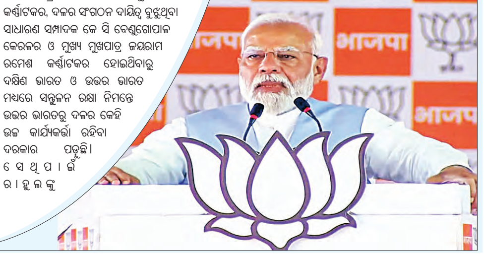
ରାଧିକାରେଲୋରୁ ଲଢ଼ିବାକୁ ରାହୁଲଙ୍କୁ ପ୍ରୋତ୍ସାହନ ଦେଇ ବୋଲି ରାଜନୈତିକ ବିଶ୍ଳେଷକମାନେ କହିଛନ୍ତି। କିନ୍ତୁ ବିଧାନସଭା ନିର୍ବାଚନରେ କଂଗ୍ରେସରୁ ଦଳର କର୍ତ୍ତାବ୍ୟ ଓ ତେଲଙ୍ଗାନାରେ ଜିତିଛି କିନ୍ତୁ ରାଜସ୍ଥାନ ଓ ଛତିଶଗଡ଼ରେ ହାରିଛି। ବିଜେପିର ସଫଳ ମୁକାବିଲା କରିବା ନିମନ୍ତେ କଂଗ୍ରେସରୁ ଉତ୍ତର ଭାଗରୁ

କଂଗ୍ରେସ ନେତା ରାହୁଲ ଗାନ୍ଧୀ କେରଳର ଖାନ୍ନୁର ସ୍ୱାସ୍ଥ୍ୟ ଅଞ୍ଚଳରେ ନିର୍ବାଚନ ଲଢ଼ିବେ ରାଧିକାରେଲୋ ଆସନରୁ ପ୍ରାର୍ଥୀ ହେବାରୁ ପ୍ରଧାନମନ୍ତ୍ରୀ ନରେନ୍ଦ୍ର ମୋଦୀ ତାଙ୍କ ନିର୍ବାଚନ ପ୍ରଚାର ସଭାରେ ରାହୁଲଙ୍କ ନାମ ନେଇ କହିଛନ୍ତି, ତେଣୁ ମତ୍ ଭାଗେ ମତ୍ ଅର୍ଥାତ୍ ଭାଗେ ମତ୍ ହୁଅନ୍ତୁ, ପକ୍ଷରେ କରନ୍ତୁ। ବିରୋଧୀଙ୍କୁ ବିଜେପି ସେମାନଙ୍କ ପକ୍ଷରେ କେନ୍ଦ୍ରୀୟ ଯାତ୍ରା ଏକେଡ଼ିକୁ ଲଗାଇ ଦେଇ କହିବା ବେଳେ ରାହୁଲ ପ୍ରାୟତଃ ପ୍ରଧାନମନ୍ତ୍ରୀ ମୋଦୀଙ୍କୁ ଧମକାଇ କହିଥିବା, ତେଣୁ ମତ୍। ତେଣୁ ଏବେ ରାହୁଲ ପରାମର୍ଶ ଉପରେ ପୁଣି ଆସନରୁ ଲଢ଼ିବାକୁ ନିଷ୍ପତ୍ତି ନେଇଥିବାରୁ ପ୍ରଧାନମନ୍ତ୍ରୀ ମୋଦୀ ପ୍ରତ୍ୟୁତ୍ତରେ ରାହୁଲଙ୍କୁ ତାଙ୍କ ନିଜ ଭାଷାରେ ତେଣୁ ମତ୍, ଭାଗେ ମତ୍ ବୋଲି ପରାମର୍ଶ ଦେଇଛନ୍ତି। ପ୍ରଧାନମନ୍ତ୍ରୀ ମୋଦୀ କଂଗ୍ରେସ ନେତା ରାହୁଲଙ୍କୁ ତେଣୁ ମତ୍, ଭାଗେ ମତ୍ କହିଥିବାରୁ ପ୍ରତିକ୍ରିୟାରେ କଂଗ୍ରେସ ସଭାପତି ମଲ୍ଲିକାର୍ଜୁନ ଖଟ୍ଟରେ କହିଛନ୍ତି, ପ୍ରଧାନମନ୍ତ୍ରୀ ମୋଦୀ କାର୍ଯ୍ୟକ୍ରମ ଉଲ୍ଲଙ୍ଘନ କରୁଥିବା ସତ୍ତ୍ୱେ ମଧ୍ୟ ମତ୍ ଭାଗେ ମତ୍ ହେବାରୁ ଉତ୍ତର ଭାଗରୁ ଦଳର କେହି ଉଚ୍ଚ କାର୍ଯ୍ୟକର୍ତ୍ତା ରହିବା ଦରକାର ପଡ଼ିଛି। ସେ ଥିବାରୁ ରାହୁଲଙ୍କୁ