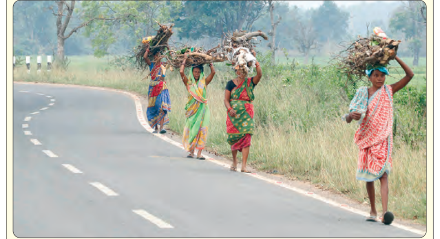
ଫେଲ୍ ମାରିଛି ପ୍ରଧାନମନ୍ତ୍ରୀ ଉତ୍ତମ କୋଟ୍ଟା ଯୋଜନା ଏବେ ବି ଜଙ୍ଗଲରୁ ଜାଳେଣି ଫଗୁନ କରୁଛନ୍ତି ମହିଳା

କେବଳ ଭାଗ୍ୟବାନ ଛାତ୍ରଛାତ୍ରୀଙ୍କୁ ଏପରି ସୁଯୋଗ ପ୍ରାପ୍ତ ହୁଏ ବୋଲି ପ୍ରୋତ୍ସାହନ ଦେଇ କାର୍ଯ୍ୟକ୍ରମର ସଫଳତା ପାଇଁ ତାଙ୍କ ଅନୁଷ୍ଠାନ ତରଫରୁ ସବୁ ପ୍ରକାର ସାହାଯ୍ୟ ଦିଆଯିବାର ପ୍ରତିଶ୍ରୁତି ଦେଇଥିଲେ।