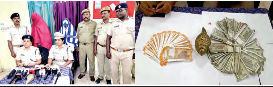
୫୦ ହଜାର ଟଙ୍କା ଓ ପିତଳ ଶଙ୍ଖ ଜବତ