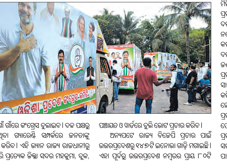
ଓଡ଼ିଶାର ଗାଁ ଗାଁରେ କଂଗ୍ରେସ ବୁଲାଇବ। ଦଳ ପକ୍ଷରୁ ଦିଆଯାଇଥିବା ଗାମାରେଣ୍ଡି ସମ୍ପର୍କରେ ଜନତାଙ୍କୁ ସଚେତନ କରିବ। ଏହି ଭ୍ୟାନ ରାଜ୍ୟ ରାଜଧାନୀରୁ ଆରମ୍ଭ କରି ପ୍ରତ୍ୟେକ ଜିଲ୍ଲା ସ୍ତରରେ ମହଜୁତା, ବୁକ୍, ପଞ୍ଚାୟତ ଓ ଓଡ଼ିଶାରେ ବୁଲି ଭୋଟ ପ୍ରଚାର କରିବ। ଅନ୍ୟପକ୍ଷେ ରାଜ୍ୟ ବିଜେପି ପ୍ରଚାର ପାଇଁ ଉତ୍ତରପ୍ରଦେଶରୁ ୧୪୭ଟି ଇନୋଡା ଗାଡ଼ି ମିଗାଇଛି। ଏହା ପୂର୍ବରୁ ଉତ୍ତରପ୍ରଦେଶ ନମ୍ବର ପ୍ରାୟ ୮୦ଟି

ଅକ୍ଷ-ତେଲଙ୍ଗାନାରୁ କଂଗ୍ରେସ ଆଣିଲା ଏଲ୍‌ଇଡି ଭ୍ୟାନ ଉତ୍ତରପ୍ରଦେଶରୁ ୧୪୭ ପ୍ରଚାର ଗାଡ଼ି ଆଣିବ ବିଜେପି ସୋସିଆଲ ମିଡିଆରେ ବିଜେଡି 'ନବୀନ ଓଡ଼ିଶା' କାହାଣୀ ମଣ୍ଡଳରେ ଦଳୀୟ କାର୍ଯ୍ୟକ୍ରମ ସାଙ୍ଗକୁ ବାଜକ ରାଲି ଓ ଶୋଭାଯାତ୍ରା ଦେଖିବାକୁ ମିଳୁଛି। ତେବେ ଏ ସବୁ ଭିତରେ ପୋର୍ଟ ପୂର୍ବରୁ କିପରି ପ୍ରତ୍ୟେକ ଭୋଟରଙ୍କ ପାଖରେ ପହଞ୍ଚି ହେବ ଓ ନିଜ ପ୍ରାର୍ଥୀଙ୍କ ସମ୍ପର୍କରେ ସମର୍ଥନ ବଢ଼ିପାରିବ ସେ ନେଇ ସବୁ ଦଳ ପ୍ରୟାସ