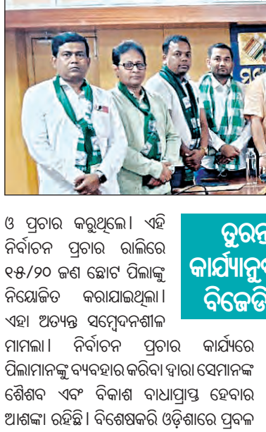
ଦୁରନ୍ତ ଦୃଢ଼ କାର୍ଯ୍ୟାନୁଷ୍ଠାନ ପାଇଁ ବିଜେଡିର ଦାବି

ଓ ପ୍ରଚାର କରୁଥିଲେ। ଏହି ନିର୍ବାଚନ ପ୍ରଚାର ରାଲିରେ ୧୫/୨୦ ଜଣ ଛୋଟ ପିଲାଙ୍କୁ ନିଯୋଜିତ କରାଯାଇଥିଲା। ଏହା ଅତ୍ୟନ୍ତ ସମ୍ବେଦନଶୀଳ ମାମଲା। ନିର୍ବାଚନ ପ୍ରଚାର କାର୍ଯ୍ୟରେ ପିଲାମାନଙ୍କୁ ବ୍ୟବହାର କରିବା ଦ୍ୱାରା ସେମାନଙ୍କ ଶୈଶବ ଏବଂ ବିକାଶ ବାଧାପ୍ରାପ୍ତ ହେବାର ଆଶଙ୍କା ରହିଛି। ବିଶେଷକରି ଓଡ଼ିଶାରେ ପ୍ରଦଳ ଓ ପ୍ରଚାର କରୁଥିଲେ। ଏହି ନିର୍ବାଚନ ପ୍ରଚାର ରାଲିରେ ୧୫/୨୦ ଜଣ ଛୋଟ ପିଲାଙ୍କୁ ନିଯୋଜିତ କରାଯାଇଥିଲା। ଏହା ଅତ୍ୟନ୍ତ ସମ୍ବେଦନଶୀଳ ମାମଲା। ନିର୍ବାଚନ ପ୍ରଚାର କାର୍ଯ୍ୟରେ ପିଲାମାନଙ୍କୁ ବ୍ୟବହାର କରିବା ଦ୍ୱାରା ସେମାନଙ୍କ ଶୈଶବ ଏବଂ ବିକାଶ ବାଧାପ୍ରାପ୍ତ ହେବାର ଆଶଙ୍କା ରହିଛି। ବିଶେଷକରି ଓଡ଼ିଶାରେ ପ୍ରଦଳ