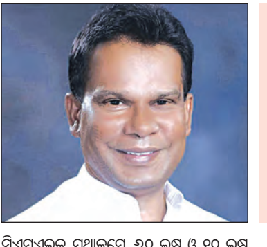
କୋଇଲା ଦୁର୍ନୀତି ମାମଲା ଦଣ୍ଡାଦେଶ ଉପରେ ରୋକ୍ ଲଗାଇଲେ ନୂଆଦିଲ୍ଲୀ ହାଇକୋର୍ଟ