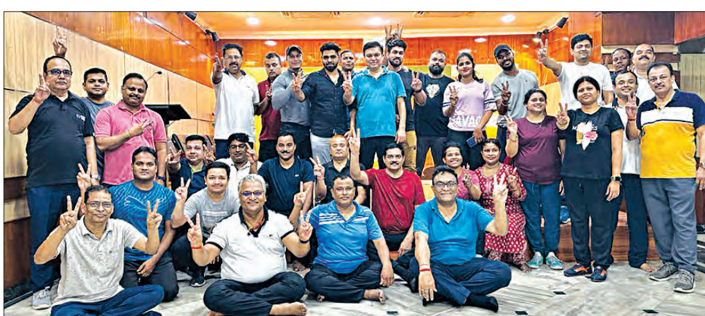
ଭୁବନେଶ୍ୱର: ବିଶ୍ୱ ସ୍ୱାସ୍ଥ୍ୟ ଦିବସ ଅବସରରେ ଭାରତୀୟ ଷ୍ଟେଟ୍ ବ୍ୟାଙ୍କ ପକ୍ଷରୁ ସଚେତନତା କାର୍ଯ୍ୟକ୍ରମ

ଭୁବନେଶ୍ୱର, ୭୪ (ସମ୍ବିଧ): ପ୍ରବଳ ଖରାରେ ସିଝିଥିବା ରାଜଧାନୀବାସୀଙ୍କୁ ବର୍ଷା ପରେ ସାମାନ୍ୟ ଆଶ୍ଚର୍ଯ୍ୟ ମିଳିଛି । ପ୍ରବଳ ଗ୍ରୀଷ୍ମ ପ୍ରବାହରୁ ଲୋକେ ଗ୍ରାହିତହୋଇଛନ୍ତି । ଦିନସାରା ଆକାଶ ମେଘୁଆ ଥିବାବେଳେ ହଠାତ୍ ସନ୍ଧ୍ୟାରେ ବର୍ଷା ହେବା ଯୋଗୁଁ ସହରୀ ଲୋକଙ୍କ ଜୀବନଯାତ୍ରା ଅଚାନକ ଠିକ୍ ହୋଇଗଲା । ଯିଏ ଯେଉଁଠି ଥିଲେ ଅଟକି ଯାଇଥିଲେ । ବାଲକ୍ ଚାଳକମାନେ ପୂର୍ବରୁ ଅସ୍ପଷ୍ଟ ଥିବାରୁ ବର୍ଷା ଛାଡ଼ିବା ପର୍ଯ୍ୟନ୍ତ ସୁରକ୍ଷିତ ସ୍ଥାନରେ ଅଶ୍ରୁୟ ନେଇଥିଲେ । ଅନ୍ୟପକ୍ଷରେ ସୁନିର୍ଦ୍ଧା-୩, ଅଶୋକନଗର, ଲକ୍ଷ୍ମୀସାଗର, ଖଣ୍ଡଗିରି ଆଦି କିଛି ସ୍ଥାନରେ ପବନ ଯୋଗୁଁ ଗଛ ଭାଙ୍ଗି ପଡ଼ି ରାସ୍ତା ଅବରୋଧ ହୋଇଯାଇଥିଲା । ଏହାସହ ବାଣୀବିହାର, ରସୁଲଗଡ଼, ସିଆରପି, ଖଣ୍ଡଗିରି, ବରମୁଣ୍ଡା, ରାଜମହଲ, ଏକ ଛକ ଅଞ୍ଚଳରେ ବର୍ଷା ଛାଡ଼ିଯିବ ପରେ ଅଚାନକ ରାସ୍ତାରେ ଭିଡ଼ ହୋଇଯାଇଥିଲା । ବିଶେଷକରି ରସୁଲଗଡ଼ ଛକରୁ ପଲ୍ଲୀଶ୍ରୀ ପର୍ଯ୍ୟନ୍ତ ଗାଡ଼ି କାମ୍ ହୋଇଯାଇଥିବା ବେଶ୍ ବାକ୍ ମିଳିଥିଲା ।