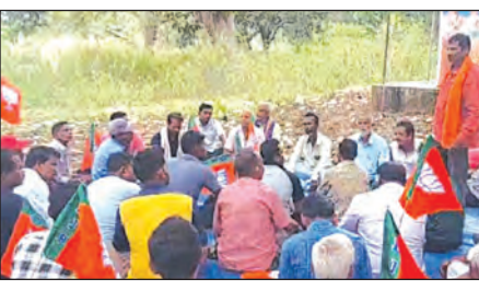
ଜନସାଧାରଣଙ୍କୁ ସଚେତନ କରିବେ ବୋଲି କହିଛନ୍ତି। ଖାଏ ଏଥିପାଇଁ ବେଗୁନିଆ-ବୋଲଗଡ଼ ନିର୍ବାଚନମଣ୍ଡଳୀରେ ଗଡ଼ା ହୋଇଥିବା 'ଅପରାଜିତା ହଟାଏ, ବିଜେପି ବଞ୍ଚାଅ' ଅଭିଯାନ

ବିଜେପିରେ ଦୀର୍ଘ ଦିନ ହେଲା କାର୍ଯ୍ୟ କରୁଥିବା ଅଭିଜ୍ଞ, ଦକ୍ଷତାସମ୍ପନ୍ନ ନେତାଙ୍କୁ କଣ୍ଠଦେବା କରି ନିଜ ପଡ଼ିଆରା ଜାହିର କରିବାରେ ଲାଗିଛନ୍ତି। ଏନେଇ ଦଳରେ