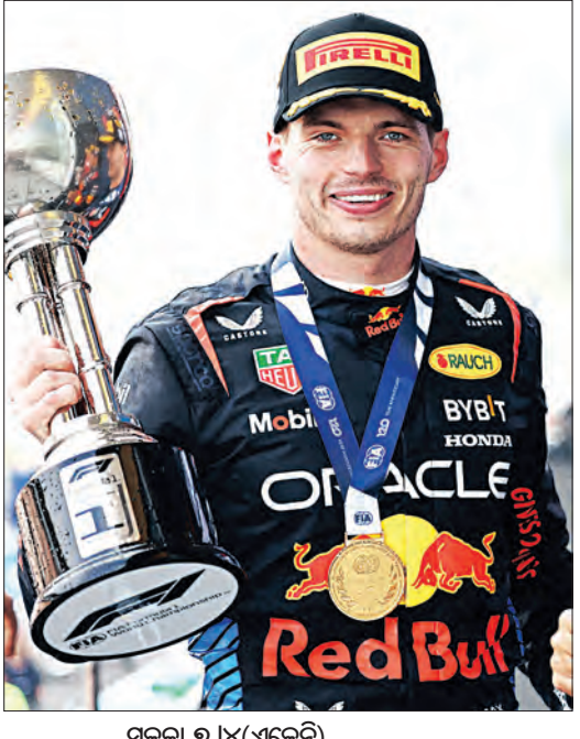
ସୁକୁକା, ୧୪ (ଏକେନ୍ଦ୍ର) ନେଦରଲାଣ୍ଡସ୍ ଓ ବେଲଜିୟମର ଫର୍ମୁଲା-୧ ରେସିଂ ଡ୍ରାଇଭର ରେଡ୍ ବୁଲ୍ ମ୍ୟାକ୍ ଭର୍ଷାପେନ୍ ଏଥର କ୍ରୀଡ଼ା ଦର୍ଶକ ଫର୍ମୁଲା-୧ ଗ୍ରାଁ ପ୍ରିରେ ବାଜି ମାରିଛନ୍ତି।

ରବିବାର ସୁକୁକା ଅନ୍ତର୍ଜାତୀୟ ରେସିଂ କୋର୍ସରେ ଅନୁଷ୍ଠିତ ଫାଇନାଲ ରେସ୍ରେ ଭର୍ଷାପେନ୍ ୧: ୫୪: ୨୩.୫୬୨ ସେକେଣ୍ଡ ସମୟ ନେଇ ୨୬ ପଏଣ୍ଟ ହାସଲ କରିବା ସହ ଶୀର୍ଷରେ ରହି ଚାମ୍ପିଅନ ହାସଲ କରିଛନ୍ତି। ଏଥିସହ ଚଳିତ ସିଜନରେ ସେ ୪ଟି ରେସ୍ରେ ଶୀର୍ଷରେ ଚାମ୍ପିଅନ ହୋଇଛନ୍ତି। ସେହିପରି ରେଡ୍ ବୁଲ୍ ଅନ୍ୟତମ ଡ୍ରାଇଭର ସର୍ଭିଲ୍ ପେରେଜ ୧୨.୫୩୫ ସେକେଣ୍ଡ ସମୟ ଅଧିକ ନେଇ ଦ୍ୱିତୀୟ ସ୍ଥାନରେ ରହିଥିବା ବେଳେ ମେକ୍ସିକୋର କାର୍ଲୋସ୍ ସେଜ୍ ୨୦.୮୬୬ ସେକେଣ୍ଡ ସମୟ ଅଧିକ ନେଇ ତୃତୀୟ ସ୍ଥାନରେ ରହିଛନ୍ତି। ଅଭିଜ୍ଞ ଫର୍ମୁଲା-୧ ଆଲୋଗ୍ସ୍ ଷଷ୍ଠ ଓ ମର୍ସିଡିଜ୍ ତରଫର ଚାମ୍ପିଅନ ଲୁଇସ୍ ହାମିଲଟନ ୯୩ ସ୍ଥାନରେ ରହିଛନ୍ତି। ଭର୍ଷାପେନ୍ ସହକରେ ରେସ୍ରେ ବାଜି ମାରିଥିଲେ। ତାଙ୍କିଏଲ୍ ରିକାର୍ଡୋ ଓ ଆଲେକ୍ସ ଆଲବୋନୋଙ୍କ କାର୍ ମଧ୍ୟରେ ଧକ୍କା ହେବାରୁ ରେସ୍ ବାଧାପ୍ରାପ୍ତ ହୋଇଥିଲା। ଦୁର୍ଘଟଣା ପରେ ଦୁଇ ଡ୍ରାଇଭର ସେଠାରୁ ଚାଲିଯାଇଥିଲେ। ଅବସରରୁ ପ୍ରତ୍ୟାବର୍ତ୍ତନ କରିବା ପରେ ଭର୍ଷାପେନ୍ଙ୍କ ପ୍ରଦର୍ଶନରେ ଉନ୍ନତ ଆସିଛି।