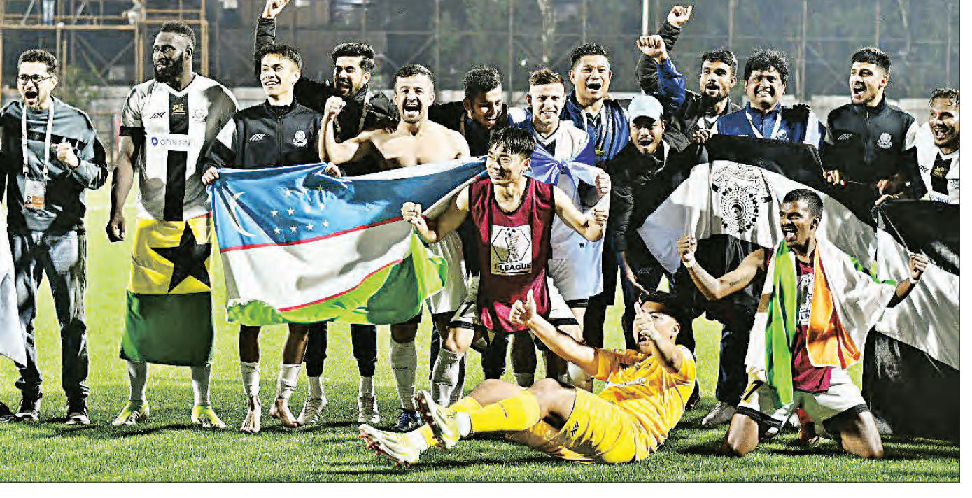
ପରାଜୟ ସହ ୫୨ ହାସଲ କରି ଚାଲିବା ଶୀର୍ଷରେ ରହିବା ସହ ବାଜି ମାରିଛି। ଆଇ ଗୋଟିଏ ମ୍ୟାଚ୍ ବାଜିଥିଲେ ତା'ର ପକାପକ ଅକ୍ ଚାଲିବାକୁ ପ୍ରଭାବିତ କରିବ ନାହିଁ। ତେଣୁ ଲିଗ୍ ଶେଷ ହେବା ପୂର୍ବରୁ ମହମ୍ମତାନ ଟାଇଟଲ ଜିତିଛି। ଶ୍ରୀନିଧି ଡେବାନ ୨୨ ମ୍ୟାଚ୍ ଖେଳି ୧୩ ବିଜୟ, ୫ ଡ୍ର ଓ ୪ ପରାଜୟ ସହ ୪୪ ଅକ୍ ହାସଲ କରି ଦ୍ୱିତୀୟ ସ୍ଥାନରେ ରହିଛି। ସେହିପରି ରିଅଲ୍ କଣ୍ଟ୍ରାର ୨୩ ମ୍ୟାଚ୍ ଖେଳି ୧୧ ବିଜୟ, ୭ ଡ୍ର ଓ ୫ ପରାଜୟ ସହ ୪୦ ପଏଣ୍ଟ

ନୂଆଦିଲ୍ଲୀ, ୧୪ (ଏକେନ୍ଦ୍ର) ଭାରତୀୟ ଘରୋଇ ପୁଟ୍ ବଲ ପ୍ରତିଯୋଗିତାର ଦ୍ୱିତୀୟ ସ୍ଥାନୀୟ ଚୂର୍ଣ୍ଣମେଷ୍ଟ ଆଇ ଲିଗ୍ରେ ଏଥର ମହମ୍ମତାନ ସ୍ପୋର୍ଟ୍ କ୍ଲବ୍ ଚାମ୍ପିଅନ ହୋଇଛି। ୧୩୩ ବର୍ଷର ପୁରୁଣା ଏହି କ୍ଲବ୍ ୨-୧ ଗୋଲରେ ଶିକ୍ ଲାଙ୍ଗ୍ କ୍ଲବ୍କୁ ପରାସ୍ତ କରି ଏହି ସଫଳତା ପାଇଛି। ଲିଗ୍ରେ ମହମ୍ମତାନ ସ୍ପୋର୍ଟ୍ ୨୩ଟି ମ୍ୟାଚ୍ ଖେଳି ୧୫ ବିଜୟ, ୭ ଡ୍ର ଓ ଗୋଟିଏ