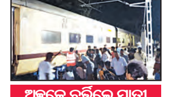
ଅଳ୍ପକେ ବର୍ତ୍ତିଲେ ଯାତ୍ରୀ

କାଶୀନଗର, ୨୪(ସମ୍ବିଧ): ଗଜପତି ଜିଲ୍ଲା କାଶୀନଗର ରେଳଷ୍ଟେସନରେ ପୁରୀ-ଗୁଣ୍ଡୁପୁର ଟ୍ରେନ୍ ଏସି ବଗିରେ ନିଆଁ ଲାଗି ଯାଇଥିଲା। ତେବେ ଅଳ୍ପକେ ବର୍ତ୍ତିଯାଇଛି ସମସ୍ତ ଯାତ୍ରୀ। ସୂଚନା ଅନୁଯାୟୀ, ଆଜି ପୁରୀରୁ ଗୁଣ୍ଡୁପୁର ଅଳ୍ପଦୂରରେ ଆସୁଥିବା ପାଞ୍ଚୋଟି ଟ୍ରେନ୍ କାଶୀନଗର ରେଳଷ୍ଟେସନ ଠାରେ