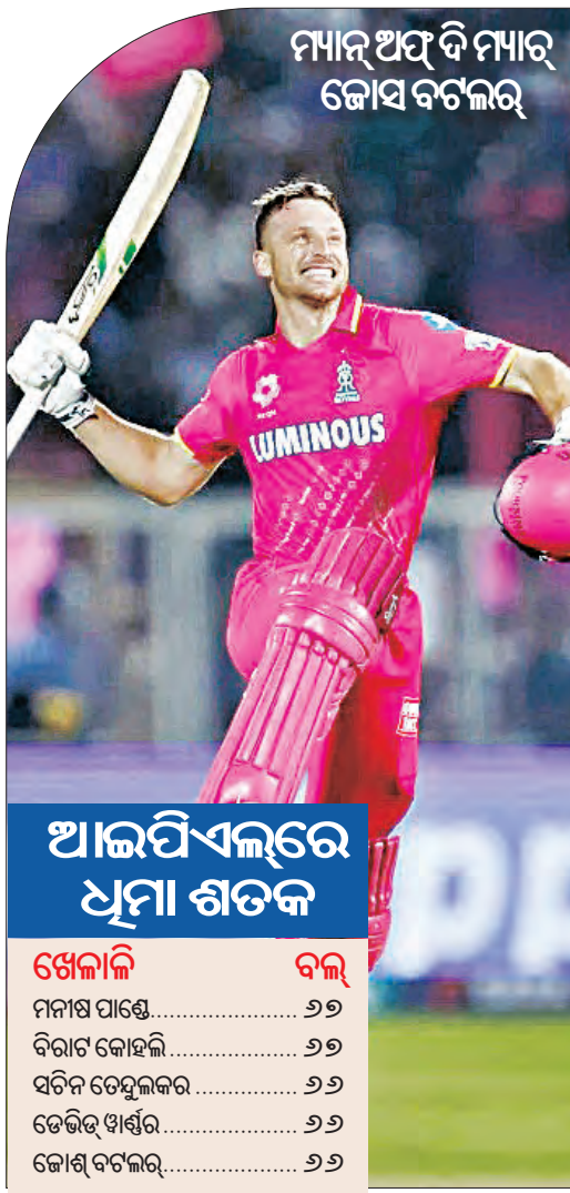
ମମାନ ଅପ୍ ଦି ମମାର କୋସ ବଟଲର