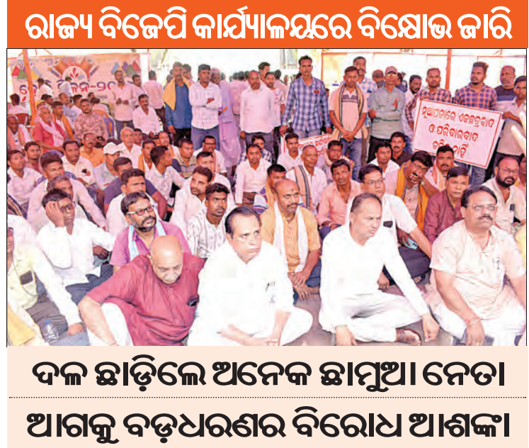
ରାଜ୍ୟ ବିଜେପି କାର୍ଯ୍ୟାଳୟରେ ବିରୋଧ ଜାରି। ଦଳ ଛାଡ଼ିଲେ ଅନେକ ଛାମୁଆ ନେତା ଆଗକୁ ବଢ଼ିବାର ବିରୋଧ ଆଣିବ।

ଅନେକ ବିଜେପି କର୍ମୀ ଦଳ ପକ୍ଷରୁ ଘୋଷିତ ପ୍ରାର୍ଥୀଙ୍କ ବିରୋଧରେ ଆଜି ରାଜ୍ୟ କାର୍ଯ୍ୟାଳୟରେ ମେଳି ହୋଇଛି। ଅପରପକ୍ଷେ ଆଜି ଅନେକ ନେତା ଦଳ ନିଷ୍ଠାରେ ଅସନ୍ତୋଷ ପ୍ରକାଶ କରି ଦଳ ଛାଡ଼ିଛନ୍ତି।