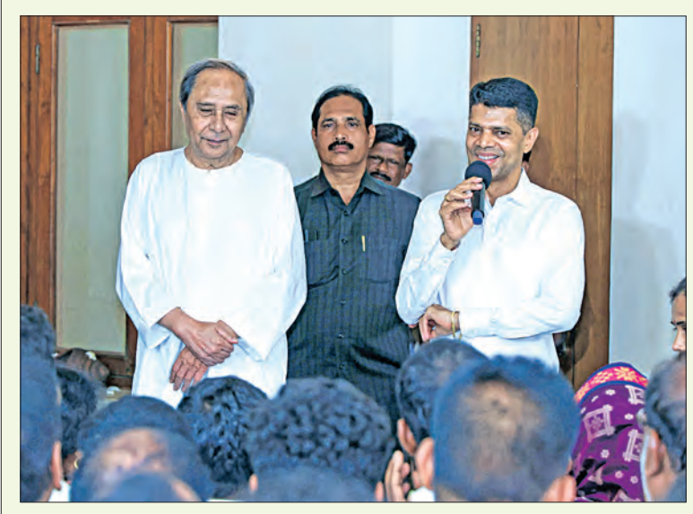
ନବୀନ ନିବାସରେ ମୁଖ୍ୟମନ୍ତ୍ରୀ ନବୀନ ପଟ୍ଟନାୟକଙ୍କୁ ଭେଟି କୃତଜ୍ଞତା ଜଣାଉଛନ୍ତି ହିଝାଳି ଓ ଆସ୍କା ନିର୍ବାଚନମଣ୍ଡଳୀର ଜନସାଧାରଣ ଓ ନେତୃତ୍ୱ

ଅନେକ ବିଜେପି କର୍ମୀ ଦଳ ପକ୍ଷରୁ ଘୋଷିତ ପ୍ରାର୍ଥୀଙ୍କ ବିରୋଧରେ ଆଜି ରାଜ୍ୟ କାର୍ଯ୍ୟାଳୟରେ ମେଳି ହୋଇଛି। ଅପରପକ୍ଷେ ଆଜି ଅନେକ ନେତା ଦଳ ନିଷ୍ଠାରେ ଅସନ୍ତୋଷ ପ୍ରକାଶ କରି ଦଳ ଛାଡ଼ିଛନ୍ତି।