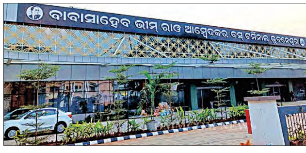
ଆଗକୁ ଆହୁରି ମଜବୁତ କରାଯିବ। ଏହାର ଦ୍ୱିତୀୟ ପର୍ଯ୍ୟାୟ ରୂପାନ୍ତରଣ କରାଯିବ। ଏହାକୁ ମେଟ୍ରୋ କରାଯିବ ଓ ଉପରେ ସ୍ଥାନୀୟ ଲୋକଙ୍କୁ ସୁବିଧା କରାଯିବ।

■ ଭୁବନେଶ୍ୱର, ୫.୧୪ (ସମିପ): ବରମୁଣ୍ଡା ସ୍ଥିତ ବାବା ସାହେବ ଭାମ ରାଓ ଆନୁଷ୍ଠାନିକ ବସ ଚର୍ଚ୍ଚନାଳୟ (ବିଏସ୍‌ଏସିଟି) ଏବେ ବିଶ୍ୱସ୍ତରାୟ ବସଷ୍ଟାଣ୍ଡର ପରିଚୟ ହାସଲ କରିଛି।