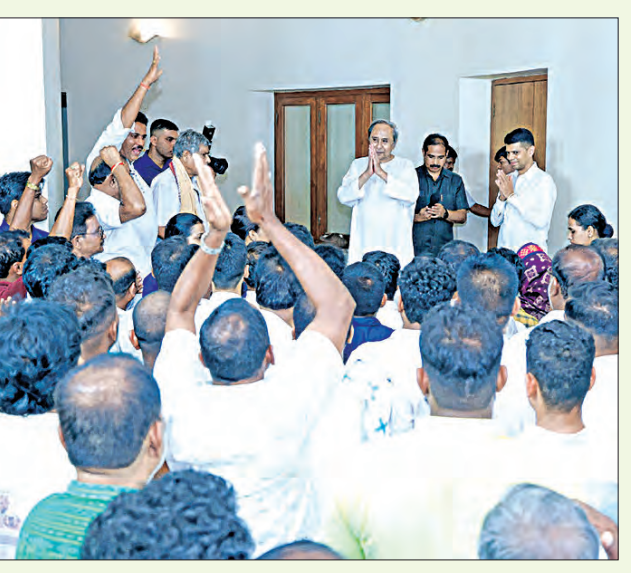
ନବୀନ ନିବାସରେ ମୁଖ୍ୟମନ୍ତ୍ରୀ ନବୀନ ପଟ୍ଟନାୟକଙ୍କୁ ଭେଟି କୃତଜ୍ଞତା ଜଣାଉଛନ୍ତି ହିଝାଳି ଓ ଆସ୍କା ନିର୍ବାଚନମଣ୍ଡଳୀର ଜନସାଧାରଣ ଓ ନେତୃତ୍ୱ