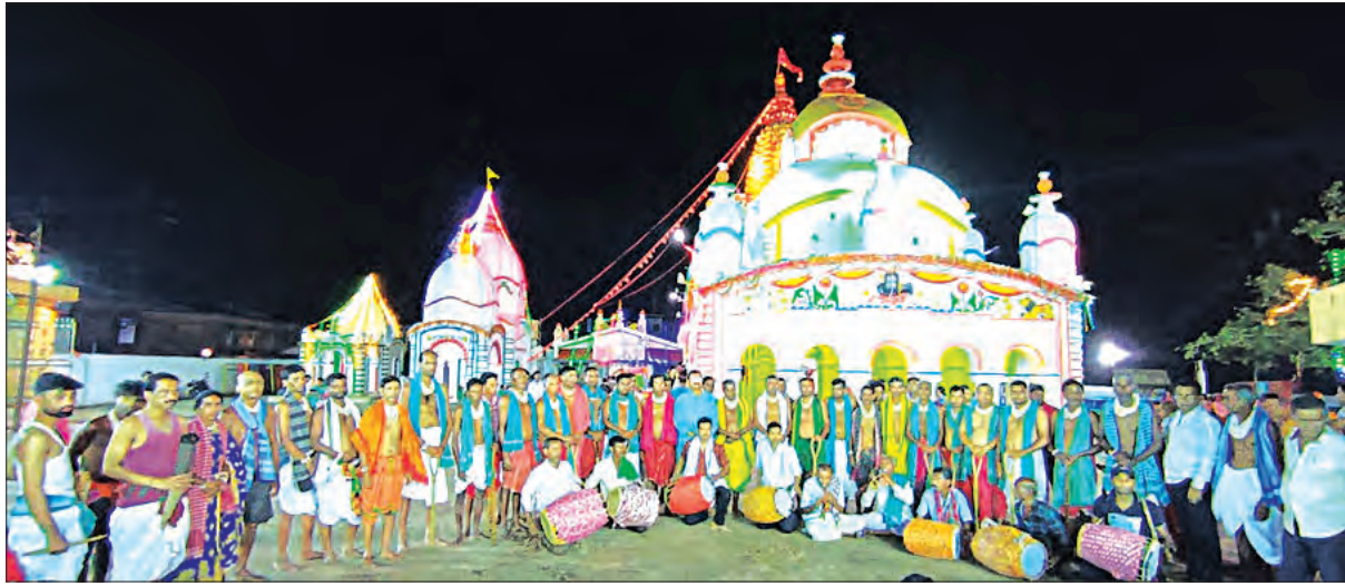
ଚନ୍ଦନେଶ୍ୱର, ୫୪ (ସମିପ) :

ବାଲେଶ୍ୱର ଜିଲ୍ଲା ଭୋଗରାଇ ବ୍ଲକର ହୁଗୁଳି ପଞ୍ଚାୟତରେ ଜଳଯନ୍ତ୍ର ଭାବେ ପୂଜିତ ପୂର୍ବ ଭାରତ ପ୍ରସିଦ୍ଧ ବାବା ଚନ୍ଦନେଶ୍ୱର ମହାଦେବଙ୍କ ପବିତ୍ର ଚତୁକ ମେଳା ଗତ ସୋମବାର ଶୁଭାରମ୍ଭ ହୋଇଛି। ଆସନ୍ତା ୧୧ ତାରିଖ ଗୁରୁବାର ବାର ମହାନାଳ