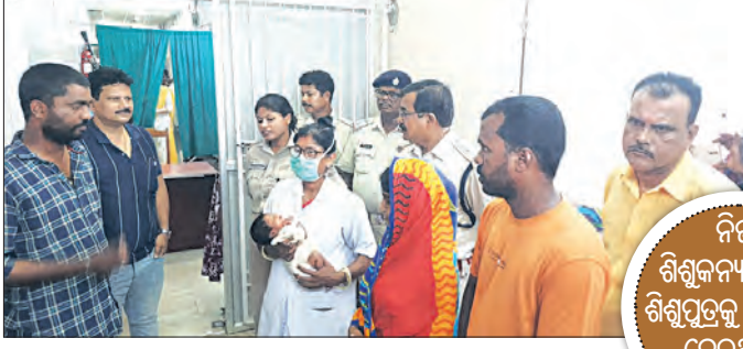
ନିଜ ଶିଶୁକନ୍ୟାକୁ ରଖି ଶିଶୁପୁତ୍ରକୁ ଚୋରାଇ ନେଇଥିଲେ

ବାଲେଶ୍ୱର ଜିଲ୍ଲା ମୁଖ୍ୟ ଚିକିତ୍ସାଳୟର ଶିଶୁ ଓ ଶିଶୁପୁତ୍ର ଉଦ୍‌ଘାଟନ ପୂର୍ବରୁ ଶିଶୁପୁତ୍ର ଉଦ୍‌ଘାଟନ କରାଯାଇଥିଲା।