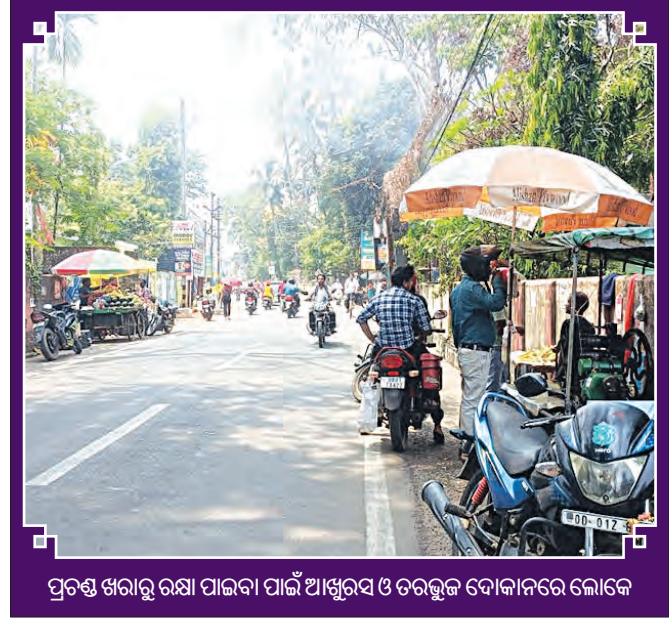
ପ୍ରବନ୍ଧ ଖରାବୁ ରଖି ପାଇବା ପାଇଁ ଆଖିରୁ ଓ ତରଳୁକ ଦୋକାନରେ ଲୋକେ