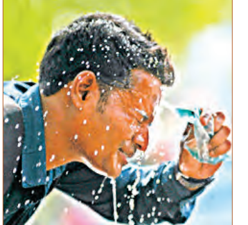
ଆହୁରି ୨ ଦିନ ଅନୁଗୁଳ ହେବ ଗୁରୁଗୁଳି ୬ ଜିଲ୍ଲାକୁ ଗ୍ରୀଷ୍ମ ଲହରୀ ସତର୍କତା ଜାରି

■ ଭୁବନେଶ୍ୱର, ୪୧ (ସମ୍ପାଦକ): ଚଳିତ ଗ୍ରୀଷ୍ମ ଋତୁରେ ପ୍ରଥମ ଥର ପାଇଁ ରାଜ୍ୟରେ ତାପମାତ୍ରା ୪୨ ଡିଗ୍ରୀ ଛୁଇଁଛି। ମାଲକାନଗିରି ଓ ବୌଦ୍ଧ ରାଜ୍ୟର ସବୁଠୁ ଉଚ୍ଚ ସହର ପାଲଟିଛି ଓ ଏଠାରେ ତାପମାତ୍ରା ୪୨ ଡିଗ୍ରୀ ରେକର୍ଡ କରାଯାଇଛି। ସେହିପରି ଅନୁଗୁଳରେ ତାପମାତ୍ରା ୪୧.୬ ଡିଗ୍ରୀ ରହିଥିବା ବେଳେ ବଲାଙ୍ଗୀରରେ ୪୧.୬, ଝାରସୁଗୁଡ଼ାରେ ୪୧.୬, ଭବାନୀପାଟଣା ଓ ଚିଟିଲାଗଡ଼ରେ ୪୧, ନୂଆପଡ଼ାରେ ୪୦.୪, ରାଉରକେଲାରେ ୪୦.୨, ସୁନ୍ଦରଗଡ଼ରେ ୪୦.୧ ଓ ତାଳଚେରରେ ତାପମାତ୍ରା ୪୦ ଡିଗ୍ରୀ ସେଲସିୟସ ରେକର୍ଡ କରାଯାଇଛି। ଅନୁପା ଭାବେ କଟକ ଓ ଭୁବନେଶ୍ୱର ତାପମାତ୍ରା ଯଥାକ୍ରମେ ୩୮ ଓ ୩୭.୪ ଡିଗ୍ରୀ ରେକର୍ଡ କରାଯାଇଛି। ଲଗାତାର ଭାବେ ୪ ଦିନ ହେବ ଅସମ୍ଭାଳ ତାତି ସାଙ୍ଗକୁ ଗୁରୁଗୁଳିର ପ୍ରଭାବ ରାଜ୍ୟବାସୀଙ୍କୁ ଅସ୍ୱସ୍ଥ କରୁଛି। ଗତକାଲି ୧୦ ଟି ସ୍ଥାନରେ ତାପମାତ୍ରା ୪୦ ଡିଗ୍ରୀ ଉପରେ ରହିଥିବା ବେଳେ ଗୁରୁବାର ୧୧ ଟି ସହରରେ ତାପମାତ୍ରା ୪୦ ଡିଗ୍ରୀ କିମ୍ବା ଏହାଠାରୁ ଅଧିକ ରେକର୍ଡ କରାଯାଇଛି। ପାଣିପାଗ କେନ୍ଦ୍ରର ସୂଚନା ଅନୁଯାୟୀ ଆଗାମୀ ଦୁଇ ଦିନ ପର୍ଯ୍ୟନ୍ତ ରାଜ୍ୟରେ ଏପରି ତାତି ଲାଗି ରହିବା ସହ ଏହି ସମୟରେ କିଛି ସ୍ଥାନରେ ଗ୍ରୀଷ୍ମ ଲହରୀ ପରିସ୍ଥିତି ସୃଷ୍ଟି ହୋଇପାରେ। ଏହାକୁ ଦୃଷ୍ଟିରେ ରଖି ୫ ଓ ୬ ତାରିଖ ପାଇଁ ବିଭିନ୍ନ ଜିଲ୍ଲାକୁ ହିଟ୍ ୱେଭ୍ ଆଲର୍ଟ ଜାରି କରାଯାଇଛି। ତେବେ ୨ ଦିନ ପରେ ଅର୍ଥାତ୍ ୬ ତାରିଖ ବେଳକୁ ତାତିରୁ ଏକ ବଡ଼ ଧରଣର ବିଶ୍ୱାସନୀୟତା ସାମାନ୍ୟ ଆଶ୍ୱସ୍ତି ମିଳିବାର ସମ୍ଭାବନା ରହିଛି ବୋଲି ପାଣିପାଗ କେନ୍ଦ୍ର ପୂର୍ବାନୁମାନ କରିଛି। ଭୁବନେଶ୍ୱର ଆଞ୍ଚଳିକ ପାଣିପାଗ କେନ୍ଦ୍ର ଜାରି କରିଥିବା ବୁଲେଟିନ୍ ଅନୁସାରେ ଆସନ୍ତାକାଲି ଅର୍ଥାତ୍ ଶୁକ୍ରବାର ବଲାଙ୍ଗୀର, ବୌଦ୍ଧ, ଅନୁଗୋଳ, ମାଲକାନଗିରି, ନୟାଗଡ଼