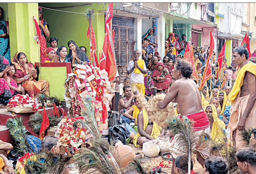
ଦେଖିବାକୁ ଲୋକଙ୍କ ମନରେ ବିପୁଳ ଆନନ୍ଦ ଗ୍ରାମ ପ୍ରବେଶ ସହ ବନ୍ଦାଣ କାର୍ଯ୍ୟକ୍ରମରେ ଆବଶ୍ୟକ ଦେଖିବାକୁ ମିଳୁଛି। ଦିନ ବେଳେ ପ୍ରଥମେ ନାଚ ସମସ୍ତ ପଦାର୍ଥ ସମ୍ପର୍କରେ ଏଥିରେ ସଚେତନତା

ପାରମ୍ପରିକ ଦଣ୍ଡନାଚରେ ଦୁର୍ଲ୍ଲଭ ଶେରଗଡ଼। ଗଞ୍ଜାମର ଏହି ପ୍ରସିଦ୍ଧ ଲୋକକଳା ସାରା ଜିଲ୍ଲାକୁ ଚଳଚଞ୍ଚଳ କରି ରଖୁଥିବା ବେଳେ ଶେରଗଡ଼ରେ ମଧ୍ୟ ଏହାର ପ୍ରଭାବ ଅନୁଭୂତ ହେଉଛି। ଗଞ୍ଜାମ ଜିଲ୍ଲାର ପ୍ରସିଦ୍ଧ କୁଳାଗଡ଼ ଦଣ୍ଡ ଦଳ ଗୁରୁବାର ଶେରଗଡ଼ ସହର ଖର୍ଚ୍ଚ ନୂଆରେ ରହିଥିବା ବେଳେ ଏହି ଦଣ୍ଡକୁ ଦର୍ଶନ କରିବାକୁ ହଜାର ହଜାର ଫୁଲ୍ୟାରେ ଶ୍ରଦ୍ଧାଳୁ ଏକାଠି ହୋଇଥିଲେ। ଫଳରେ ଗୁରୁବାର ସାରା ସହର ଚଳଚଞ୍ଚଳ ହୋଇ ଉଠିଥିଲା।