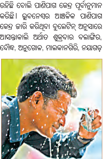
ଆହୁରି ୨ ଦିନ ଅନୁଗୁଳ ହେବ ଗୁରୁଗୁଳି ୬ ଜିଲ୍ଲାକୁ ଗ୍ରୀଷ୍ମ ଲହରୀ ସଫଟକା କରି

■ ଭୁବନେଶ୍ୱର, ୪।୪ (ସମ୍ପାଦକ): ଚଳିତ ଗ୍ରୀଷ୍ମ ଋତୁରେ ପ୍ରଥମ ଥର ପାଇଁ ରାଜ୍ୟରେ ତାପମାତ୍ରା ୪୨ ଡିଗ୍ରୀ ଛୁଇଁଛି। ମାଲକାନଗିରି ଓ ବୌଦ୍ଧ ରାଜ୍ୟର ସବୁଠୁ ଉଚ୍ଚ ସହର ପାଲଟିଛି ଓ ଏଠାରେ ତାପମାତ୍ରା ୪୨ ଡିଗ୍ରୀ ରେକର୍ଡ କରାଯାଇଛି। ସେହିପରି ଅନୁଗୁଳରେ ତାପମାତ୍ରା ୪୧.୬ ଡିଗ୍ରୀ ରହିଥିବା ବେଳେ ବଲାଙ୍ଗୀରରେ ୪୧.୬, ଝାରସୁଗୁଡ଼ାରେ ୪୧.୬, ଭବାନୀପାଟଣା ଓ ଚିଟିଲାଗଡ଼ରେ ୪୧, ନୂଆପଡ଼ାରେ ୪୦.୪, ରାଉରକେଲାରେ ୪୦.୨, ସୁନ୍ଦରଗଡ଼ରେ ୪୦.୧ ଓ ତାଳଚେରରେ ତାପମାତ୍ରା ୪୦ ଡିଗ୍ରୀ ସେଲସିୟସ ରେକର୍ଡ କରାଯାଇଛି। ଅନୁପପ ଭାବେ କଟକ ଓ ଭୁବନେଶ୍ୱର ତାପମାତ୍ରା ଯଥାକ୍ରମେ ୩୮ ଓ ୩୭.୪ ଡିଗ୍ରୀ ରେକର୍ଡ କରାଯାଇଛି। ଲଗାତାର ଭାବେ ୪ ଦିନ ହେବ ଅସମ୍ଭାଳ ତାତି ସାଙ୍ଗକୁ ଗୁରୁଗୁଳିର ପ୍ରଭାବ ରାଜ୍ୟବାସୀଙ୍କୁ ଅସ୍ତବ୍ୟସ୍ତ କରିଛି। ଗତକାଲି ୧୦ ଟି ସ୍ଥାନରେ ତାପମାତ୍ରା ୪୦ ଡିଗ୍ରୀ ଉପରେ ରହିଥିବା ବେଳେ ଗୁରୁବାର ୧୧ ଟି ସହରରେ ତାପମାତ୍ରା ୪୦ ଡିଗ୍ରୀ କିମ୍ବା ଏହାଠାରୁ ଅଧିକ ରେକର୍ଡ କରାଯାଇଛି।