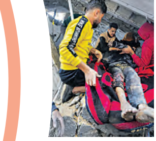
ତାରିଖରୁ ଯୁଦ୍ଧ ଆରମ୍ଭ ହେବା ପରଠାରୁ ଲଗାତାର ସାମ୍ବାଦିକଙ୍କ ମୃତ୍ୟୁ ଖବର ଆସିବା ଜାରି ରହିଥିବାରୁ ବିଶ୍ୱବ୍ୟାପୀ ଅନେକ ଗଣମାଧ୍ୟମ ସଂଗଠନ ଏ ନେଇ ଉଦ୍‌ବେଗ ପ୍ରକାଶ କରିଛନ୍ତି । ଟି.ଡି. ରୋଡିଓ, ପ୍ରେମ ମିଡିଆ ଏବଂ ମଲ୍ଟିମିଡିଆ ପାଇଁ କାର୍ଯ୍ୟ କରୁଥିବା ଅନେକ ସାମ୍ବାଦିକ, ଫଟୋଗ୍ରାଫର ଏବଂ କ୍ୟାମେରା ଅପରେଟର ଗାଜା ଯୁଦ୍ଧର ଶିକାର ହୋଇଛନ୍ତି ।