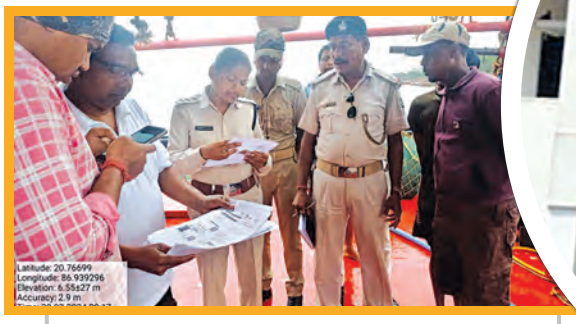
ରିପୋର୍ଟ- କେନ୍ଦ୍ରାପଡ଼ା ବ୍ଲକରେ

କେନ୍ଦ୍ରାପଡ଼ା ଜିଲ୍ଲା ମହାକାଳପଡ଼ା ବ୍ଲକର ଅନେକ ଅଞ୍ଚଳକୁ ବଙ୍ଗୋପସାଗର ଛୁଇଁଛି । ବାମ୍ଲାଦେଶ ସହିତ ଜଳପଥର ସିଧାସଳଖ ସଂଯୋଗ ଥିବାରୁ ଯନ୍ତ୍ରଚାଳିତ ଡ୍ରାଲର୍ ଯାଜକୁ ମାଛଧରା ଭଙ୍ଗା ସାହାଯ୍ୟରେ ବି ଅନେକ ବାମ୍ଲାଦେଶୀ ଏହି ଅଞ୍ଚଳରେ ପ୍ରବେଶ କରୁଛନ୍ତି । ପଡ଼ୋଶୀ ଜିଲ୍ଲାର ଅପରାଧମାନେ ଏହି ଅଞ୍ଚଳରେ ସହଜରେ ଲୁଚିଛପି ରହି ଯାଉଥିବା ଅଭିଯୋଗ ହୁଏ । ଏହି ବ୍ଲକ ଅଞ୍ଚଳର ସୁରକ୍ଷା ପାଇଁ ସରକାର ଚିନ୍ତିତାପାଇ ଏବଂ ଜମ୍ବୁରେ ଭୁଲଟି ସାମୁଦ୍ରିକ ଥାନା ପ୍ରତିଷ୍ଠା କରିଛନ୍ତି । ମାତ୍ର ଆବଶ୍ୟକ ପାଖର ବୋର୍ ଏବଂ ଜଳଦସ୍ତୀ ଓ ସଶସ୍ତ୍ର ଅନୁପ୍ରବେଶକାରୀଙ୍କୁ ସାମନା କରିବା ପାଇଁ ଅତ୍ୟାଧୁନିକ ଅସ୍ତ୍ର, ଯଥେଷ୍ଟ ସଂଖ୍ୟକ କର୍ମଚାରୀଙ୍କ ଅଭାବ ଯୋଗୁଁ ଉପକୂଳବର୍ତ୍ତୀ ବଡ଼ଘର, ରାମନଗର, ଖରିନାସା, ପେଟିଛଲା, ବଉଳକଣି, ଜମ୍ବୁ, ସୁନାତି, ଲାଞ୍ଜୁଡ଼ା, ଗୋରୁଆ, ବଡ଼ିହି, କମ୍ପାର ବଡ଼ବାଣୁଆ ପଞ୍ଚାୟତରେ ଅନୁପ୍ରବେଶକାରୀ ପଶି ଯାଉଥିବା ଅଭିଯୋଗ ହେଉଛି ।