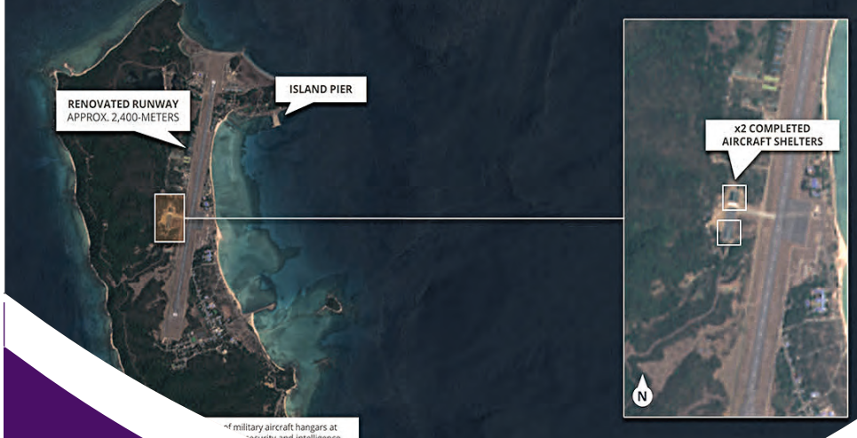
4 military aircraft hangars at security and intelligence development in "nose and tail"

ଭା ରତର ଗୋଟିଏ ପରେ ଗୋଟିଏ ପଡୋଶୀ ରାଷ୍ଟ୍ରକୁ ଚୀନ୍ ଫସାଇବାରେ ଲାଗିଛି । ପାକିସ୍ତାନ, ଶ୍ରୀଲଙ୍କା, ମାଳଦ୍ୱୀପ ପରେ ଚୀନ୍ ବାଂଲାଦେଶ ଏବଂ ମ୍ୟାଁମାରକୁ ନିଜ ଜାଲରେ ପକାଇଛି । ବାଂଲାଦେଶରେ ବିଶାଳ ନୌସେନା ବେସ୍ ବନାଇବା ପରେ ଏହି ଦେଶ ଏବେ ମ୍ୟାଁମାରରେ ସାମରିକ ଘାଟି ନିର୍ମାଣ କରୁଛି । ଏହା ଭାରତର ଚିନ୍ତା ବଦଳାଇ ଦେଇଛି । ଉପଗ୍ରହ ଚିତ୍ରରୁ ଏହି ସୂଚନା ମିଳିଛି । ରିପୋର୍ଟ ଅନୁଯାୟୀ ମ୍ୟାଁମାର ସେନା ବଙ୍ଗୋପସାଗର ଉପକୂଳରେ ଥିବା ନିକ କୋକୋ ଦ୍ୱୀପରେ ଯୁଦ୍ଧ ବିମାନ ରହିବା ପାଇଁ ହ୍ୟାଙ୍ଗାର ନିର୍ମାଣ କାର୍ଯ୍ୟ ଶେଷ କରିଛି । ଏହା ଦ୍ୱାରା ମ୍ୟାଁମାର ସେନାର କ୍ଷମତା ଅଧିକ ବୃଦ୍ଧି ପାଇଛି । ଏହା ମ୍ୟାଁମାରର ଆଜିପୁଷ୍ପ ଉପରେ ମଧ୍ୟ ପ୍ରଶ୍ନ ଉଠାଇଛି । ଏହି ସେନା ଘାଟି ଚୀନ୍ ସହାୟତାରେ ନିର୍ମାଣ କରାଯାଇଛି । ଏଠାରେ ଚୀନ୍ ବୁଲତା ଏକେଡ୍ମିର ଆଖା ମାଧ୍ୟ ରହିଛି । ଏହା