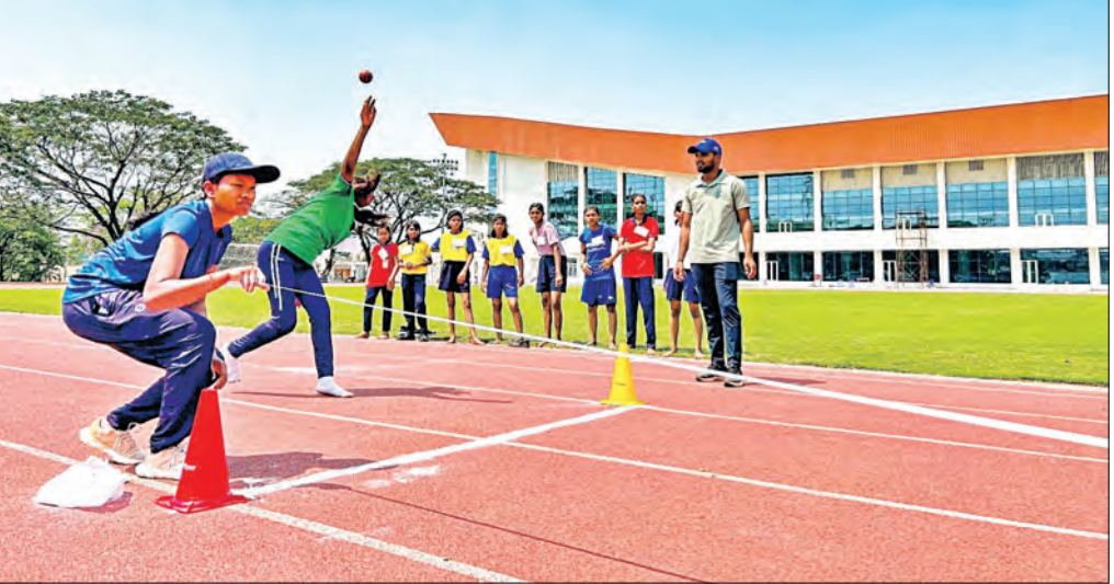
ଭୁବନେଶ୍ୱର, ୩୫ (ସମିସ)

ସେମାନଙ୍କ ମଧ୍ୟରୁ ୧୦ ହଜାର ୯୫୪ଜଣ କ୍ରୀଡା ବିଭାଗ କ୍ରୀଡା ଯଥା ଖୋ ଖୋ, ଦୋଡ୍ କୁଦ, ଫୁଟବଲ ଓ ଭଲିବଲ୍ କ୍ରୀଡାରେ ଭାଗନେଇଥିଲେ।