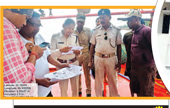
ରିପୋର୍ଟ- କେନ୍ଦ୍ରାପଡ଼ା ବ୍ଲକରେ