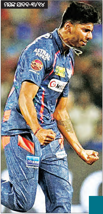
ବେଙ୍ଗାଲୁରୁ, ୨୪ (ଏକେଡ଼ି)

ଶେଷସ୍ଥାନରେ ରହିଛି । ଏହି ମ୍ୟାଚ୍‌ରେ ତି କକ୍ ୫୬ ବଲ୍‌ରେ ୮୧ ଓ ନିକୋଲସ୍ ପୁରନ ୨୧ ବଲ୍‌ରେ ଅପରାଜିତ ୪୦ ରନ୍ କରିବା ପାଇଁ ପ୍ରଥମେ ବ୍ୟାଟି କରିଥିବା ଲକ୍ଷ୍ମୀ ୫ ଓକେଟ୍‌ରେ ୧୮ ରନ୍ କରିଥିଲେ । ଜବାବରେ ମୟଙ୍କ ଘାତକ ଓ ନଦୀନ ଉଲ୍ ହକ୍ ବୋଲିଂର ଉଚିତ ମୁକାବିଲା କରି ନ ପାରି ଘରୋଇ ମାଟିରେ ବେଙ୍ଗାଲୁରୁ ୧୯.୪ ଓଭରରେ ୧୫୩ ରନ୍ କରି ଅଲଆଉଟ୍ ହୋଇଯାଇଛି । ଦଳ ପକ୍ଷରୁ ମହିପାଲ ଲୋମ୍‌ପର ୧୩ ବଲ୍‌ରେ ୩୩, ରଜତ ପଟ୍ଟିପାଲ ୨୯, ବିରାଟ କୋହଲି ୧୬ ବଲ୍‌ରେ ୨୨ ଓ ପାଫ ଡୁ ପ୍ଲେସି ୧୩ ବଲ୍‌ରେ ୧୯ ରନ୍ କରିବା ସହେଦି ଦଳ ବିଜୟ ହୋଇପାରି ନଥିଲା । ମୟଙ୍କ ଘାତକ ବୋଲିଂ କରି ୪ ଓଭରରେ ମାତ୍ର ୧୪ ରନ୍ ଦେଇ ୩ଟି ଓ ନଦୀନ ୨୫ ରନ୍‌ରେ ୨ଟି ଓକେଟ୍ ପାଇଛନ୍ତି । ପୁରନ ଦ୍ରୁତ ୪୦ ରନ୍ କରିବା ପରେ ତାଙ୍କର ଡ୍ରୋଉଟ୍ ପ୍ରୋଗ୍ରେସ୍‌ରେ ଗୋଟିଏ ରନ୍ ଆଉଟ୍ ଓ ଚମତ୍କାର କ୍ୟାଚ୍ ନେଇ ଅଲଭାଉଟ୍ ହୋଇ ପ୍ରଦର୍ଶନ କରିଛନ୍ତି ।