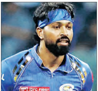
ନୂଆଦିଲ୍ଲୀ, ୨୪ (ଏକେଡ଼ି)

ରାଜତ୍‌ପୁର୍କୁ ହରାଇ ବିଜୟ ସାଧି ରାଖିଥିଲା । ଏହି ସଂସ୍କରଣରେ ମୁମ୍ବାଇ ୫ମ ସ୍ଥାନରେ ରହି ନକ୍-ଆଉଟ୍‌ରୁ ବଞ୍ଚିତ ହୋଇଥିଲା । ୨୦୧୪ରେ କ୍ରମାଗତ ୫ ପରାଜୟ ୨୦୧୩ରେ ପ୍ରଥମଥର ଟାଇଟଲ୍ ଜିତିବା ପରେ ଲକ୍ଷ୍ମୀଆର୍ ଏହା ପରବର୍ତ୍ତୀ ସଂସ୍କରଣ ନୈରାଶ୍ୟଜନକ ଭାବେ ଆରମ୍ଭ କରିଥିଲା । ପ୍ରଥମ ୫ଟି ମ୍ୟାଚ୍‌ରେ ମୁମ୍ବାଇକୁ ପରାଜୟର ସାମ୍ରାଜ୍ୟ କରିବାକୁ ପଡ଼ିଥିଲା । ଏହାସହେଦି ଦଳ ଦ୍ଵେ-ଅପରେ ପ୍ରବେଶ କରି ସିଏସ୍କେ ନିକଟତର ହାରିଥିଲା ।