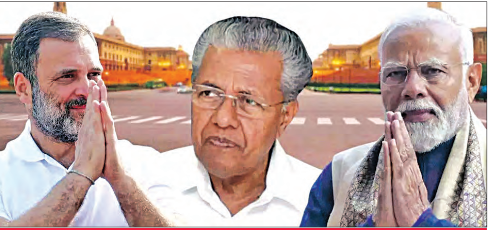
ମୁଖ୍ୟ ପ୍ରତିଦ୍ୱନ୍ଦ୍ୱୀ : କଂଗ୍ରେସ, ବାମପନ୍ଥୀ, ବିଜେପି

୧୯୯୯ ଲୋକସଭା ନିର୍ବାଚନରେ କେରଳରେ କଂଗ୍ରେସ ନେତୃତ୍ୱାଧୀନ ଯୁକ୍ତି-ଏଚ୍ ୧୧ଟି ଆସନରେ ବିଜୟ ହୋଇଥିଲା ବେଳେ ବାମପନ୍ଥୀ ମେଣ୍ଟ ଏକାଧିକ ୯ଟି ଆସନରେ ବିଜୟ ହୋଇଥିଲା। ସେହିପରି ୨୦୦୪ରେ ଯୁକ୍ତି-ଏଚ୍ ୧୨, ଏକାଧିକ ୧୮, ୨୦୦୯ରେ ଯୁକ୍ତି-ଏଚ୍ ୧୬, ଏକାଧିକ ୪, ୨୦୧୪ ନିର୍ବାଚନରେ ଯୁକ୍ତି-ଏଚ୍ ୧୨, ଏକାଧିକ ୮ ଏବଂ ୨୦୧୯ ନିର୍ବାଚନରେ ଯୁକ୍ତି-ଏଚ୍ ୧୯ ଏବଂ ଏକାଧିକ ୮ ମାତ୍ର ଗୋଟିଏ ଆସନରେ ବିଜୟ ହୋଇଥିଲା। ଅର୍ଥାତ୍ ବିଗତ ୫ଟି ଲୋକସଭା ନିର୍ବାଚନରେ ବାମପନ୍ଥୀ ମେଣ୍ଟ ହେଉ କି କଂଗ୍ରେସ ନେତୃତ୍ୱ ମେଣ୍ଟ, ଏହି ଦୁଇ ଦଳ ହିଁ କେରଳରେ ପ୍ରଭାବ ବିସ୍ତାର କରିଆସିଥିଲା। କଂଗ୍ରେସ ନେତୃତ୍ୱ ମେଣ୍ଟ ଅଧିକ ଲୋକସଭା ଆସନରେ ବିଜୟ ହେଲେ କଂଗ୍ରେସ ପାଇଁ କୌଣସି ସମସ୍ୟା ନଥିଲା ବେଳେ ବାମପନ୍ଥୀ ମେଣ୍ଟର ଅଧିକ ଆସନରେ ବିଜୟ କଂଗ୍ରେସ ପାଇଁ ମଧ୍ୟ କୌଣସି ସମସ୍ୟା ନଥିଲା। କିନ୍ତୁ ବାମପନ୍ଥୀ ଦଳର ଭୋଟ ଶେୟାର ହ୍ରାସ ଏବଂ ବିଜେପିର ଭୋଟ ଶେୟାର ବୃଦ୍ଧି ପାଇବା ଘଟଣା ରାଜ୍ୟ ରାଜନୀତି ପାଇଁ ପରବର୍ତ୍ତନ ମୋଡ଼ ହୋଇଛି। ୨୦୧୪ ନିର୍ବାଚନରେ ଯୁକ୍ତି-ଏଚ୍ ୧୨ର ଭୋଟ ଶେୟାର ହାର ୪୧.୯୮ ପ୍ରତିଶତ ରହିଥିଲା ବେଳେ ୨୦୧୯ରେ ଏହି ହାର ୪୭.୪୮ ପ୍ରତିଶତ ରହିଥିଲା। କିନ୍ତୁ ଏକାଧିକ ଭୋଟ ଶେୟାର ୨୦୧୪ରେ ୪୦.୧୨ ପ୍ରତିଶତ ରହିଥିଲେ ହେଁ ୨୦୧୯ରେ ଏହି ହାର ୩୬.୨୯ ପ୍ରତିଶତ ହ୍ରାସ ପାଇଥିଲା। ଏଭଳି ସ୍ଥିତି ୨୦୧୪ରେ ରହିଥିବା ୧୦.୮୨ ପ୍ରତିଶତ ଏନଡିଏ ଭୋଟ ଶେୟାର ୨୦୧୯ରେ ୧୫.୬୪ ପ୍ରତିଶତକୁ ବୃଦ୍ଧି