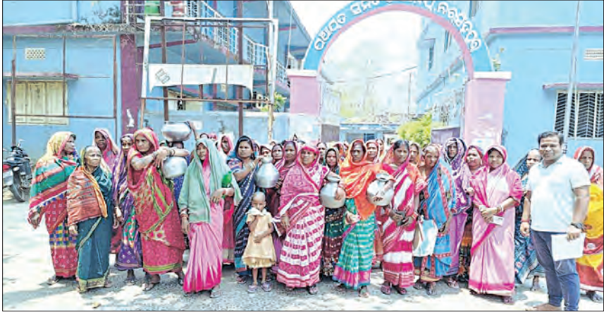
ନରସିଂହପୁର, ୨୬/୪ (ସମିପ)

୫୦ ବର୍ଷ ହେବ ଲାଗି ରହିଛି ପାନୀୟଜଳ ସମସ୍ୟା • ଗରା ବାଲି ଧରି ମହିଳାଙ୍କ ପ୍ରତିବାଦ