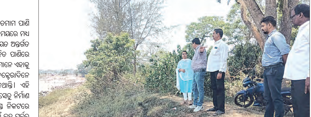
କାର୍ଯ୍ୟ ନିର୍ମାଣ ଚାଲିଛି। କିନ୍ତୁ ନିର୍ମାଣସ୍ଥାନ ଏହି ସ୍ତର ସ୍ଥଳକୁ ଛାଡ଼ିଦେଲା ପରେ ସେଠାରୁ ବହୁ ତଳକୁ ନଦୀର ବାମପାର୍ଶ୍ୱ ବନ୍ଧ ନଦୀର ପ୍ରଖର ସ୍ରୋତରୁ ଚାଲିଛି। ବନ୍ଧର ସୁରକ୍ଷା ପାଇଁ ଅଞ୍ଚଳବାସୀଙ୍କ ତରଫରୁ ବିଭାଗୀୟ କର୍ତ୍ତୃପକ୍ଷଙ୍କୁ ଦୃଷ୍ଟି ଆକର୍ଷଣ କରାଯାଇଥିଲା। ଏହି ଘଟଣାକୁ ଗୁରୁତ୍ୱ ସହ ନେଇ ଆଜି ଡେରାବିଶ ତହସିଲଦାର ପ୍ରଞ୍ଚାପାଠରୀତା ପୁଷ୍ପି, ଜଳସେବନ ବିଭାଗ ପୂର୍ବିକ ସେକ୍ଟରର ସହକାରୀ ଯତ୍ନୀ ଜ୍ଞାନଦାନ କିଶୋର ପାଣିଗ୍ରାହୀ, ଦାନପୁର ରାଜସ୍ୱ ନିରୀକ୍ଷକ

ମହାନଦୀର ଶାଖାନଦୀ ଲୁଣାଣଦୀରେ ବର୍ଷ ତମାମ ପାଣି ପ୍ରବାହିତ ହୋଇଥାଏ। ଏପରିକି ନିବାସୀଙ୍କ ସମୟରେ ମଧ୍ୟ ଏହି ନଦୀର ଡେରାବିଶ ବ୍ଲକ୍ ହରିଅଳ ଅଞ୍ଚଳରେ ବେଲମାଳ ଠାରେ ଅକାତ କାତ ପାଣି ସହିତ ପାଣିରେ ପ୍ରବଳ ସ୍ରୋତ ମଧ୍ୟ ରହିଥାଏ। ସ୍ଥାନୀୟ ଲୋକମାନେ ଏହାକୁ ବେଲମାଳ ଗଣସ୍ଥଳ ଭାବରେ ନାମିତ କରିଥିବା ବେଳେ ଡେରାବିଶ ମଧ୍ୟ ଏହା ମଧ୍ୟକୁ କେହି ପ୍ରବେଶ କରିନଥାନ୍ତି। ଏହି ସ୍ଥାନରୁ ମାତ୍ର ୨୦୦ ମିଟର ତଳକୁ ଦାନପୁର ସେତୁ ନିର୍ମାଣ କରାଯାଇଛି। ତେବେ ଏହି ବେଲମାଳ ଗଣସ୍ଥଳ ନିକଟରେ ନଦୀର ବାମପାର୍ଶ୍ୱ ବନ୍ଧକୁ ସୁରକ୍ଷା ଦେବାପାଇଁ ବହୁ ପୂର୍ବରୁ ବନ୍ଧରେ ସ୍ତର ନିର୍ମାଣ କାର୍ଯ୍ୟ ହୋଇଥିଲା। ତେବେ ପ୍ରାକୃତିକ ଭାବେ କିଛି ବର୍ଷ ପୂର୍ବରୁ ନଦୀର ଗତିପଥ ବଦଳି ଘଣ୍ଟିଆ ପାର୍ଶ୍ୱ ପାଣିଓଳା ଗ୍ରାମରେ ବନ୍ୟାପାଣି ମାତ୍ର ହେବା ଫଳରେ ଗ୍ରାମକୁ ସୁରକ୍ଷା ଦେବା ପାଇଁ ପାଣିଓଳା ନିକଟରେ ଜଳସମ୍ପଦ ବିଭାଗ ପକ୍ଷରୁ ପଥର ସ୍ତର ନିର୍ମାଣ କରାଯାଇଥିଲା। ଏହା ଫଳରେ ପାଣିଓଳା ଗ୍ରାମକୁ ସୁରକ୍ଷା ମିଳିଲା। ଏହି ସ୍ତର ନିର୍ମାଣ ଗତିପଥ ବଦଳି ବାମପାର୍ଶ୍ୱ ବନ୍ଧ ଯୁଗ୍ମ ହେବାକୁ ଲାଗିଲା। ତେଣୁ ଏହାକୁ ସୁରକ୍ଷା ଦେବାପାଇଁ ଜଳସମ୍ପଦ ବିଭାଗ ପକ୍ଷରୁ ସ୍ତର