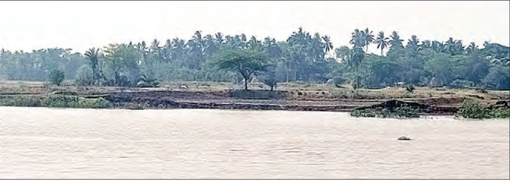
ବେଆଇନ ଭାବେ ଦଖଲ କରୁଥିବା ସହ ନଦୀକୁଲିଆ ମାଟିକୁ ସୁରକ୍ଷା ଦେଉଥିବା ଗଛକାଟି ଚିଲୁଡ଼ି ଘେରି କରିବାରୁ ଏଭଳି ସ୍ଥିତି ହୋଇଥିବା ପରିବେଶବିତ୍ କହିଛନ୍ତି। ତେବେ ବୈତରଣା ନଦୀ ଏଠାକୁ ଏହି ମୌଜାରେ ଭିତରକନିକା ବନ୍ୟାପ୍ରାଣୀ

କନିକା ତହସିଲ ଅଞ୍ଚଳରେ ଜମି ମାପିଆଙ୍କ ସହ ତାଳ ଦେଇ କେତେକ ଅଞ୍ଚଳରେ ଚିଲୁଡ଼ି ମାପିଆ ସକ୍ରିୟ ରହି ସରକାରୀ ଦଣ୍ଡା, ଗୋଡ଼ର, ଗ୍ରାମ୍ୟ ଜଙ୍ଗଲ, ପାଣିନାଳ ଭଳି ସର୍ବସାଧାରଣ ସମ୍ପତ୍ତିକୁ ବେଆଇନ ଭାବେ ଦଖଲ କରିବା, ସେଥିରେ ଚିଲୁଡ଼ି ଘେରି କରିବାକୁ ଗଛ ନଷ୍ଟ କରିବା ଫଳରେ ଗଡ଼କାଳି ବୈତରଣା ନଦୀର ଗୁଆଲିଆଁ ନିକଟରେ ୫ ଫୁଟ ଓସାର ଏବଂ ୨୦୦ ମିଟର ଲମ୍ବ ମାଟି ଅତଡ଼ା ଧର୍ମି ଯାଇଛି। କନିକା ତହସିଲର ବିଭିନ୍ନ ରାଜସ୍ୱ ମୌଜାରେ ସରକାରୀ ସମ୍ପତ୍ତି ହତୁଡ଼ି କରି