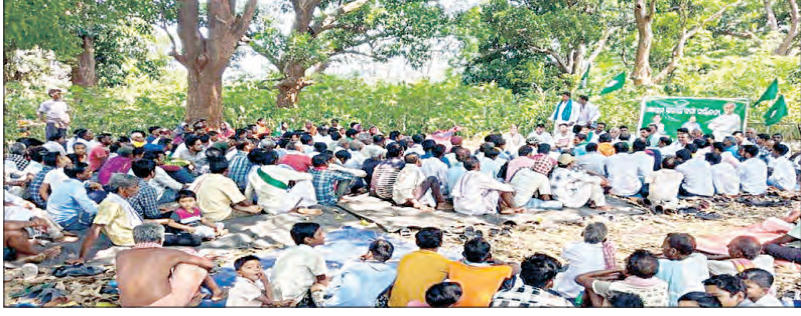
ଅନୁଗୋଳ, ୨୫ ୪(ସମ୍ପିପ)

ଅନୁଗୋଳ ବ୍ଲକର ୯ ଗୋଟି ପଞ୍ଚାୟତ ଆଠମଣ୍ଡଳ ବିଧାନସଭା ନିର୍ବାଚନ ମଣ୍ଡଳୀରେ ଅନୁଗୋଳ ଚଳିତ ସାଧାରଣ ନିର୍ବାଚନରେ ଏହି ୯ ପଞ୍ଚାୟତରେ ବିଜେଡି ପ୍ରତି ଜନସମର୍ଥନ ବୃଦ୍ଧି ପାଇବାରେ ଲାଗିଛି। ନୂତନ ଭୋଟରମାନେ ବିଜେଡିକୁ ଭୋଟ ଦେବା ପାଇଁ ମନ ସ୍ଥିରକରି