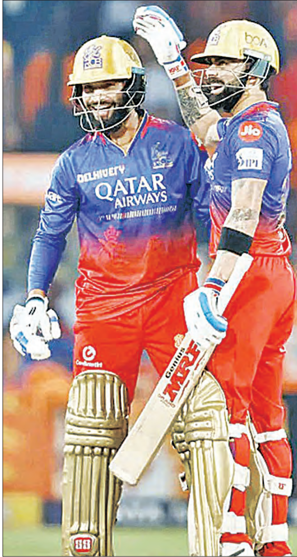
ବିଷ୍ଣୋଇକ ବ୍ୟାଟି କରି ୧୨ ବଲ୍ରେ ୫୧ ରନ୍ କରି ଆଉଟ୍ ହୋଇଥିଲେ । ଦଳ ୩-୫ ଓଭର ଖେଳି ୪୮ ରନ୍ରେ ପ୍ରଥମ ଓଭର ହରାଇଥିଲା । ଗତ ମ୍ୟାଚ୍ରେ ହିରୋ ଓଲ୍ କ୍ୟାଚ୍ ୬ ରନ୍ରେ ଆଉଟ୍ ହୋଇଥିଲେ । ୬ ଓଭରରେ ୨ ଓଭର ପଡ଼ିଯିବା ପରେ କୋହଲି ପାଳି ସକାରିବାରେ ମନୋନିବେଶ କରିଥିଲେ । କିନ୍ତୁ ତାଙ୍କ ସହ

ପୂର୍ବ ପରାଜୟର ପ୍ରତିଶୋଧ ନେଇଛି ରୟାଲ ଚ୍ୟାଲେଞ୍ଜର୍ସ ବେଙ୍ଗାଲୁରୁ । ଏଠାରେ ଗୁରୁବାର ଅନୁଷ୍ଠିତ ଆଇପିଏଲ୍ ୪୧ତମ ଲିଗ୍ ମ୍ୟାଚରେ ରୟାଲ ଚ୍ୟାଲେଞ୍ଜର୍ସ ୩୫ ରନ୍ରେ ଘରୋଇ ସନ୍ତରାଜକର୍ଷ ହାଇଦ୍ରାବାଦକୁ ପରାସ୍ତ କରିଛି । ଏହା ପୂର୍ବରୁ ବେଙ୍ଗାଲୁରୁରେ ଏପ୍ରିଲ ୧୫ ତାରିଖ ଦିନ ଅନୁଷ୍ଠିତ ହାଇ ଷ୍ଟେଡିଂ ଓ ରେକର୍ଡ୍ ବ୍ରେକିଂ ମୁକାବିଲାରେ ସନ୍ତରାଜକର୍ଷ ୨୫ ରନ୍ରେ ବିଜୟ ହୋଇଥିଲା । ୯ମ ମୁକାବିଲାକୁ ବିତାଣି ମ୍ୟାଚ୍ ଭାବେ ଘରୋଇ ରୟାଲ ଚ୍ୟାଲେଞ୍ଜର୍ସ ପ୍ରଥମ ଟେଲିଭିଜନ୍ ଟିଭି ରହିଛି । ଏହି ମ୍ୟାଚ୍ରେ ବିରାଟ କୋହଲି ୪୩ ବଲ୍ରେ ୫୧ ଓ ରଜତ ପଟିଦାର ୨୦ ବଲ୍ରେ ୫୦ ରନ୍ କରିବା ପରେ ପ୍ରଥମେ ବ୍ୟାଟି କରିଥିବା ରୟାଲ ଚ୍ୟାଲେଞ୍ଜର୍ସ ୬ ଓଭରରେ ୨୦୬ ରନ୍ କରିଥିଲା । ଜବାବରେ ସନ୍ତରାଜକର୍ଷ ହାଇଦ୍ରାବାଦର ସମସ୍ତ ବ୍ୟାଟର ବିଫଳ ହେବା ଯୋଗୁଁ ଦଳ ୮ ଓଭରରେ ୧୨୧ ରନ୍ କରିଥିଲା । ଦଳ ପକ୍ଷରୁ ଶାହବାଜ୍ ଅହମ୍ମଦ୍ ସର୍ବାଧିକ ୪୦*, ଅଭିଷେକ ଶର୍ମା ଓ ପ୍ୟାଟ୍ କମିନ୍ସ୍ ଦ୍ରୁତ ୩୧ ରନ୍ ଲେଖାଏଁ କରିଥିଲେ । ଗ୍ରାଭିଏ ହେଡ୍ ୧, ଆଇଡେନ୍ ମାର୍କରାମ ୬, ହେନ୍ରିକ୍ କ୍ଲୁସେନ ୬ ରନ୍ ଘାଟକ ସାବ୍ୟସ୍ତ ହୋଇଥିଲା । ଚ୍ୟାଲେଞ୍ଜର୍ସ ପକ୍ଷରୁ ସ୍ଟିଭ୍ ବ୍ଲିକ୍ ଶର୍ମା ଓ କାମେନେନ୍ ଗ୍ରାନ୍ଥ୍ ୨ଟି ଲେଖାଏଁ ଓଭର ମିଳିଥିଲା ।