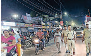
ଅନୁଗୋଳ, ୨୫ ୪(ସମ୍ପିପ): ଜନସାଧାରଣ ଏବଂ ବୁଦ୍ଧିଜୀବୀଙ୍କ ଅଭିଯୋଗକୁ କେନ୍ଦ୍ରକରି ଅନୁଗୋଳ ବସଷାଖାରୁ ବକାଉ ଛକ, ଖାଇଲ ବକାଉ ଛକଠାରୁ ଗାନ୍ଧିମାର୍ଗ ପର୍ଯ୍ୟନ୍ତ ପ୍ରତ୍ୟେକ ଦିନ ପୁଲିସ ତରଫରୁ ପୁଫ ପାଟ୍ରୋଲ୍ କରି ରାସ୍ତାରେ ବେଆଇନ