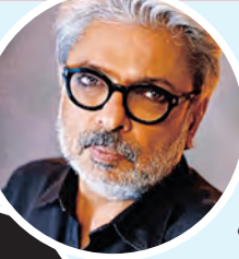
ଲାଗିଥିଲେ ୬୦୦ ଶ୍ରମିକ

କିଭିତର ଆରମ୍ଭାଦି ନିର୍ଦ୍ଦେଶକ ସଞ୍ଜୟ ଲାଲା ଭଟ୍ଟାଲାଙ୍କ ବହୁପ୍ରଚାରିତ ହେବିରିଜ୍ 'ହୀରାମଣି' ୧୬ ମାସ ପୂର୍ଣ୍ଣ ବାଜାରର ଗ୍ରାହ୍ୟ ପ୍ରମିୟର ନିକଟରେ ପହଞ୍ଚିଲେ ହୋଇଥିଲା । ଏଥିରେ ସଲମାନ୍ ଖାନ୍, ରେଖା, ଆଲିଆ ଭଟ୍ଟ, ଉର୍ବଶା ଚୌହାନ ଆଦି କଳିଭୃତ୍ ସେଲିବ୍ରିଟିମାନେ ଯୋଗ ଦେଇଥିଲେ । ଏହା ମେ' ୧ ନେତୃତ୍ୱରେ ପ୍ରସାରିତ ହେବ । ମନାଷା କୋଇଲା, ସୋନାକ୍ଷା ସିନ୍ଧା, ଅଦିତି ରାଓ ହେନ୍ଦେରା, ରଚା ଚକ୍ର, ସଞ୍ଜୟା ଶେଖ୍ ଲିଡ୍