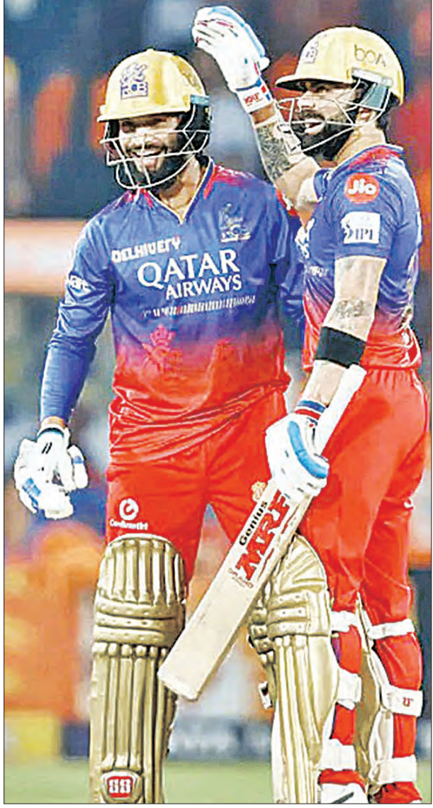
ବିଷ୍ଣୋଇକ ବ୍ୟାଟି କରି ୧୨ ବଲ୍‌ରେ ୨୫ ରନ କରି ଆଉଟ୍ ହୋଇଥିଲେ । ଦଳ ୩-୫ ଓଭର ଖେଳି ୪୮ ରନରେ ପ୍ରଥମ ଓଭର ହରାଇଥିଲା । ଗତ ମ୍ୟାଚ୍‌ରେ ହିରୋ ଓଲି କ୍ୟାକ୍ ୬ ରନରେ ଆଉଟ୍ ହୋଇଥିଲେ । ୬-୫ ରନରେ ୨ ଓଭର ପଢ଼ିଥିବା ପରେ କୋହଲି ପାଳି ସକାରିବାରେ ମନୋନିବେଶ କରିଥିଲେ । କିନ୍ତୁ ତାଙ୍କ ସହ

ପୂର୍ବ ପରାଜୟର ପ୍ରତିଶୋଧ ନେଇଛି ରୟାଲ ଚ୍ୟାଲେଞ୍ଜର୍ସ ବେଙ୍ଗାଲୁରୁ । ଏଠାରେ ଗୁରୁବାର ଅନୁଷ୍ଠିତ ଆଇପିଏଲର ୪୧ତମ ଲିଗ୍ ମ୍ୟାଚରେ ରୟାଲ ଚ୍ୟାଲେଞ୍ଜର୍ସ ୩୫ ରନରେ ଘରୋଇ ସନ୍‌ରାଇଜର୍ସ ହାଜତାବାଦକୁ ପରାସ୍ତ କରିଛି । ଏହା ପୂର୍ବରୁ ବେଙ୍ଗାଲୁରୁରେ ଏପ୍ରିଲ ୧୫ ତାରିଖ ଦିନ ଅନୁଷ୍ଠିତ ହାଇ ଷ୍ଟେଡିଂ ଓ ରେକର୍ଡ ବ୍ରେକିଂ ମୁକାବିଲାରେ ସନ୍‌ରାଇଜର୍ସ ୨୫ ରନରେ ବିଜୟ ହୋଇଥିଲା । ୯ମ ମୁକାବିଲାକୁ ବିତାଣ ମ୍ୟାଚ୍ ଭାବେ ଘରୋଇ ରୟାଲ ଚ୍ୟାଲେଞ୍ଜର୍ସ ପ୍ରେମୀଙ୍କୁ ଚୋକିତ କରି ରହିଛି । ଏହି ମ୍ୟାଚ୍‌ରେ ବିରାଟ କୋହଲି ୪୩ ବଲ୍‌ରେ ୫୧ ରନ ପ୍ରତିଦାନ ୨୦ ବଲ୍‌ରେ ୫୦ ରନ କରିବା ପରେ ପ୍ରଥମେ ବ୍ୟାଟି କରିଥିବା ରୟାଲ ଚ୍ୟାଲେଞ୍ଜର୍ସ ୬ ଓଭରରେ ୨୦୬ ରନ କରିଥିଲା । ଜବାବରେ ସନ୍‌ରାଇଜର୍ସ ହାଜତାବାଦର ସମସ୍ତ ବ୍ୟାଟର ବିଫଳ ହେବା ଯୋଗୁଁ ଦଳ ୮ ଓଭରରେ ୧୨୧ ରନ କରିଥିଲା । ଦଳ ପକ୍ଷରୁ ଶାହବାଜ୍ ଅହମ୍ମଦ୍ ସର୍ବାଧିକ ୪୦*, ଅଭିଷେକ ଶର୍ମା ଓ ପ୍ୟାଟ୍ କମିନ୍ସ ଦ୍ରୁତ ୩୧ ରନ ଲେଖାଏଁ କରିଥିଲେ । ଗ୍ରାଭିଏ ହେଡ୍ ୧, ଆଇଡେନ୍ ମାର୍କରାମ ୬, ହେନ୍‌ରିକ୍ କ୍ଲୁସେନ ୬ ରନ ଘାଟକ ସାବ୍ୟସ୍ତ ହୋଇଥିଲା । ଚ୍ୟାଲେଞ୍ଜର୍ସ ପକ୍ଷରୁ ସ୍ୱପ୍ନିଲ ବି, କର୍ଣ୍ଣ ଶର୍ମା ଓ କାମେନେନ୍ ଗ୍ରାନ୍‌ଜ୍ ୨ଟି ଲେଖାଏଁ ଓଭର ମିଳିଥିଲା ।