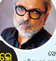
ଲାଗିଥିଲେ ୭୦୦ ଶ୍ରମିକ