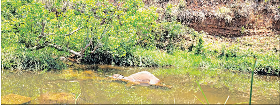
ଲୁହାପତ୍ତା, ୨୪ ୧୪ (ସମ୍ପାଦକ)

ରାଉରକେଲା ବନଖଣ୍ଡ ବାକି ବନାଞ୍ଚଳ କେବଳାଙ୍ଗ ସେକ୍ଟର ତାଳିମୁଡ଼ିହ ଗ୍ରାମ ନିକଟରେ ଥିବା କୁରାଡ଼ି ନାଳ ପାଣିରେ ଅସୁସ୍ଥ ଦନ୍ତାହାତୀର ମୃତ୍ୟୁ ଘଟିଛି। ଏହି ଅସୁସ୍ଥ ଦନ୍ତାହାତୀ କେଳଡ଼ା ରେଖି ଅଞ୍ଚଳରୁ ଗତ ୨୨ ତାରିଖ ରାତିରେ