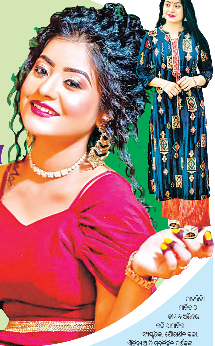
ମାନନ୍ତି । ମାଳିତ ଓ ଜାଗନ୍ନାଥ ଅଭିନୟ କରି ସାମାଜିକ, ସାଂସ୍କୃତିକ, ପୌରାଣିକ କଳା, ଐତିହ୍ୟ ଆଦି ସବୁକୁ ଧାରାବାହିକ ପାଖରେ ପହଞ୍ଚାଇବାକୁ ମଞ୍ଚ ପ୍ରୟାସ କରେ।

ମଞ୍ଚରୁ ଧାରାବାହିକ କିପରି ସୃଷ୍ଟି ହେଉଛି ? ଧାରାବାହିକ କିପରି ସୃଷ୍ଟି ହେଉଛି ତାହା ପଚାରିବା ପରେ ମୋତେ ଅଭିନୟ କରିବାର ଲଜ୍ଜା ଥିଲା। ତେଣୁ ଆବେଗରେ କୋର୍ସ କରି ମଞ୍ଚନାଟକ କଲୁଥିଲି। ପରେ ଧାରାବାହିକ ପାଇଁ ଅତିଥିତ ହେଉଥିଲି। 'ମାୟା'ରେ କାମ କରିବାକୁ ମୋତେ ସୁଯୋଗ ମିଳିଥିଲା। ପରେ 'ହୁଆବୋହୁ', 'ବୋହୂ ଆମର ଏନ୍‌ଆର‌ଆଇ', 'ଜୟ ମା' ଲକ୍ଷ୍ମୀ ଆଦିରେ କାମ କରିଛି। ଏବେ 'ହୁ ମୋ ଆଖିର ତାରାର' ବର୍ଷା ଚରିତ୍ରରେ ମୋତେ ଅଧିକ ଦର୍ଶକାୟ ଆଡୁଟି ଦେଇଛି। ଏହାଛଡା 'ଲାଗେ ପ୍ରେମ ନକର', 'ତୋ କାହାଣୀରେ ମୁଁ ନାହିଁ' ଭଳି ଓଡ଼ିଆ ଟି.ଭି. ଉତ୍କଳମେଣ୍ଡାରା ଟି.ଭି. ପ୍ୟାନ ଇଣ୍ଡିଆ 'ସି'ରେ କାମ କରିବାର ସୌଭାଗ୍ୟ ଲାଭ କରିଛି।