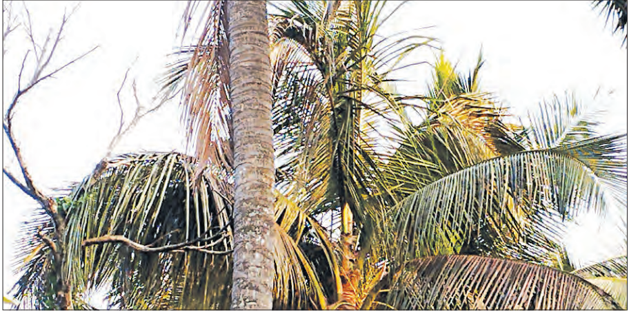
ଭୋଗରାଜ, ୨୪୪୪ (ସମିପ) :