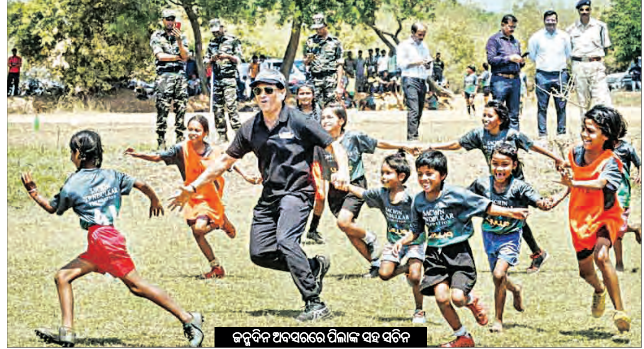
ଜନ୍ମଦିନ ଅବସରରେ ପିଲାଙ୍କ ସହ ସଚିନ୍

ମହେନ୍ଦ୍ର ସିଂ ଥୋନିଙ୍କ ନେତୃତ୍ୱରେ ଭାରତ ଘରୋଇ ପରିବେଶରେ ୨୦୧୧ରେ ଦିନିକିଆ ବିଶ୍ୱକପ୍ ଚାମ୍ପିଅନ ହୋଇଥିଲା । ସଚିନ୍ ଏହି ଦଳର ସଦସ୍ୟ ଥିଲେ । ସବୁପ୍ରକାର ସଫଳତା ହାସଲ କରିଥିଲେ ମଧ୍ୟ ସଚିନ୍ ବିଶ୍ୱକପ୍ ଜିତିବାର ସୌଭାଗ୍ୟ ପାଇ ନଥିଲେ । ଶେଷରେ ତାଙ୍କୁ ବିଶ୍ୱକପ୍ ଜିତିବାର ସୌଭାଗ୍ୟ ମିଳିଥିଲା ।