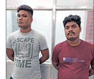
ପାଢ଼ିତାକୁ ୧୨ ଲକ୍ଷ ଟଙ୍କା କ୍ଷତିପୂରଣ ପ୍ରଦାନ ନିର୍ଦ୍ଦେଶ ୨୦୨୩ରେ କୁଶପଲ୍ଲୀ ଗ୍ରାମରେ ହୋଇଥିଲା ଗଣଦୁଷ୍ଟମୀ ଉଭୟ ଅଭିଯୁକ୍ତଙ୍କ ଡିଏନ୍ଏ ରିପୋର୍ଟ ଥିଲା ପଜିଟିଭ୍