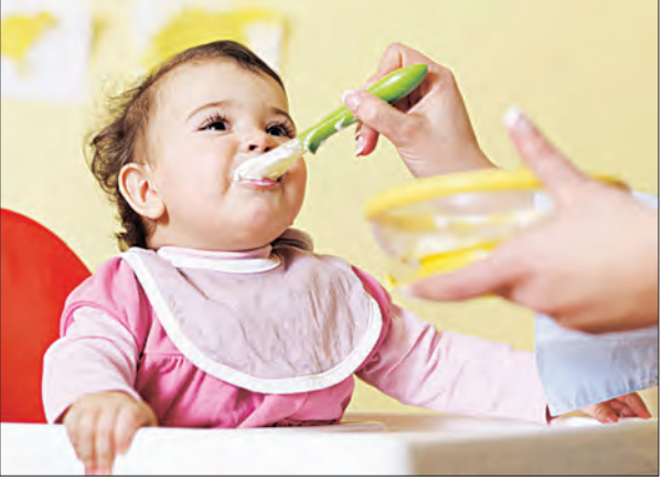
ଗ୍ରହଣ କରାଯିବ। ସରକାର ଶିଶୁ ଖାଦ୍ୟ ପ୍ରସ୍ତୁତକାରୀ ପରୀକ୍ଷା କରାଯିବା ସହ ବେକି ପୁଡ଼ ପର୍ଯ୍ୟନ୍ତ ପ୍ରସ୍ତୁତକାରୀ ବର୍ତ୍ତମାନ ସମୟରେ ଶିଶୁ ଖାଦ୍ୟ

ନୂଆଦିଲ୍ଲୀ, ୨୩।୪ (ଏକେଡି): ନେସ୍‌ଲେ ବିବାଦ ପରେ ଶିଶୁ ଖାଦ୍ୟର ମାନକୁ ନେଇ କେନ୍ଦ୍ର ସରକାର କଠୋର ଆଭିଯୁକ୍ତ ଗ୍ରହଣ କରିଛନ୍ତି। ଏହାପରେ ଶିଶୁ ଖାଦ୍ୟ ଏବଂ ଶିଶୁ ଖାଦ୍ୟ ଉତ୍ପାଦନ କରୁଥିବା କମ୍ପାନୀଗୁଡ଼ିକ ବର୍ତ୍ତମାନ କଠୋର କାର୍ଯ୍ୟାନୁଷ୍ଠାନ ସମ୍ମୁଖୀନ ହୋଇପାରନ୍ତି। କାରଣ ସରକାରଙ୍କ ପକ୍ଷରୁ ଶିଶୁ ଖାଦ୍ୟ ପ୍ରସ୍ତୁତକାରୀ କମ୍ପାନୀଗୁଡ଼ିକର ସାମଗ୍ରୀର ଯାଞ୍ଚ ଆରମ୍ଭ କରିବାକୁ ଯାଉଛନ୍ତି। ଯଦି କୌଣସି କମ୍ପାନୀର ଉତ୍ପାଦ ମାର୍ଗଦର୍ଶିକା ଅନୁଯାୟୀ ପ୍ରସ୍ତୁତ କରାଯାଇ ନ ଥାଏ ତେବେ ସେ କ୍ଷେତ୍ରରେ କଠୋର କାର୍ଯ୍ୟାନୁଷ୍ଠାନ