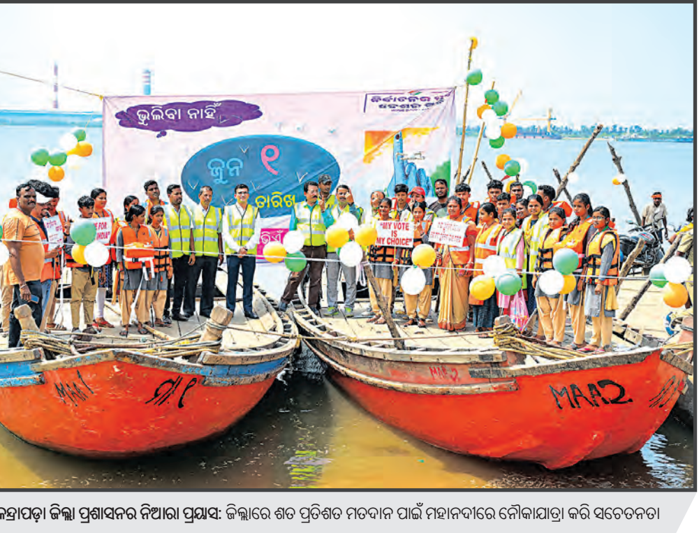
କେନ୍ଦ୍ରାପଡ଼ା ଜିଲ୍ଲା ପ୍ରଶାସନର ନିଆରା ପ୍ରୟାସ: ଜିଲ୍ଲାରେ ଶତ ପ୍ରତିଶତ ମତଦାନ ପାଇଁ ମହାନଦୀରେ ନୌକାଯାତ୍ରା କରି ସଚେତନତା

ବିଧାନସଭା ଆସନ ହାତେଇବାକୁ ସମ୍ମତ ହୋଇଥିଲା । କଂଗ୍ରେସ ପାଇଁ ଏହି ଆସନକୁ ବଜାୟ ରଖିବା ଓ ବିଜେପି ପାଇଁ ଜିଲ୍ଲାରେ ଖାତା ଖୋଲିବା ଏଥର ବ୍ୟାଲେଜି ହୋଇଥିବା ନେଇ ଆଲୋଚନା ହେଉଛି । ଗତ ୨୦୧୯ ନିର୍ବାଚନରେ ବାରବାଟୀ-କଟକରେ କଂଗ୍ରେସ ଜିତିଥିବା ବେଳେ ବାଙ୍କୀରେ କେବଳ ଦ୍ୱିତୀୟ ସ୍ଥାନରେ ରହିଥିଲେ କଂଗ୍ରେସ ପ୍ରାର୍ଥୀ । ବାକି ସବୁଠି ଦଳ ଦୟନୀୟ ପ୍ରଦର୍ଶନ କରିଥିଲା । ସେହିପରି ଚୌଦ୍ୱାର-କଟକ, ମାହାଙ୍ଗା, କଟକ ସଦର, ନିଆଳି, ଆଠଗଡ଼, ବଡ଼ପୁା ଆଦି ୬ ବିଧାନସଭା କ୍ଷେତ୍ରରେ ଗତ ୨୦୧୯ ନିର୍ବାଚନରେ ବିଜେପି ପ୍ରାର୍ଥୀ ଦ୍ୱିତୀୟ ସ୍ଥାନରେ ରହି ପରାଜିତ ହୋଇଥିଲେ । କିନ୍ତୁ ୨୦୨୨ ଡ୍ରିଗ୍ରାଫି ପଞ୍ଚାୟତ ନିର୍ବାଚନରେ ଉଭୟ କଂଗ୍ରେସ ଓ ବିଜେପି ଶୋଚନୀୟ ପ୍ରଦର୍ଶନ କରିଥିଲେ । ଏଣୁ ଏଥର ନିର୍ବାଚନ ଦୁଇ ଦଳ ପାଇଁ ଆହ୍ୱାନ ହୋଇଛି ।