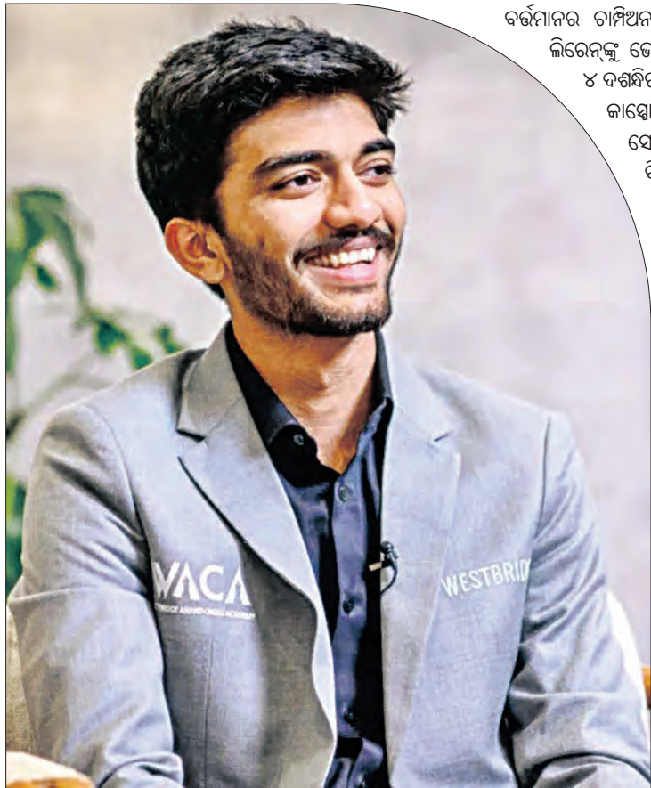
ବର୍ତ୍ତମାନ ଚାମ୍ପିଅନ ଚାନ୍ଦ୍ର ଗ୍ରାଣ୍ଡମାଷ୍ଟର ତିଳକ ଲିରେନ୍‌ଙ୍କୁ ଭେଟିବେ। ପୂର୍ବରୁ ଏହି ରେକର୍ଡ ୪ ବର୍ଷରୁ ପୁରୁଷ ରୁଷ୍ଟର ୨୨ ବର୍ଷୀୟ ଗ୍ୟାରି କାସ୍ପାରୋଭଙ୍କ ନାମରେ ରହିଥିଲା। ସେହିପରି ବିଶ୍ୱଚାମ୍ପିଅନ୍ ବିଶ୍ୱାଥାନ ଆନନ୍‌ଙ୍କ ପରେ ଭାରତରୁ ମାତ୍ର ଦ୍ୱିତୀୟ ଖେଳାଳି ଭାବେ ଗୁଜରାଟୀ କ୍ୟାଣ୍ଡିଡେଟ୍ ଚାଲଚଳ ବିଜୟ ହୋଇଛି। ଏହି ଚୁର୍ଣ୍ଣମେଣ୍ଟରୁ ତାଙ୍କୁ ୨୦ ରେଟି ପଦ ଲାଭ ହେବ।

ଆକାଶରେ ପାଇବେ। ଏହି ଚୁର୍ଣ୍ଣମେଣ୍ଟରେ ପ୍ରତ୍ୟେକ ଅଧ୍ୟାପକଙ୍କ ଲାଗି ୩୫୦୦ ଯୁଗ୍ମ ପୁରସ୍କାର ବିଧାନରେ ନିୟମ ରହିଛି। ବିଶ୍ୱଚେଷ୍ଟା ଚାମ୍ପିଅନ୍‌ସିପରେ ପାଇନାଲରେ ଗତଥର ରୁଷ୍ଟର ଇଥାନ ନେପୋମିଆଚିକ୍‌ଙ୍କୁ ପରାସ୍ତ କରି ଲିରେନ୍ ବିଶ୍ୱ ଚାମ୍ପିଅନ୍ ହୋଇଥିଲେ। ଚାଲଚଳ ବଜାୟ ରଖିବା ଲାଗି ଏଥର ସେ ଗୁଜରାଟୀ ପୁରସ୍କାର ଜିତିବେ।