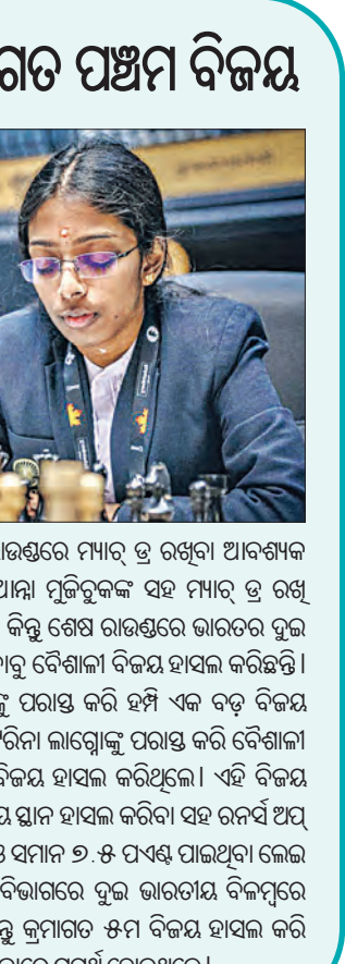
ବୈଶାଳୀଙ୍କ କ୍ରମାଗତ ପଞ୍ଚମ ବିଜୟ। ବିଭାଗରେ ପୂର୍ବାନୁମାନଯାୟୀ ତାଙ୍କର ଚାନ୍ଦ୍ର ଗ୍ରାଣ୍ଡମାଷ୍ଟର ତିଳକ ଲିରେନ୍‌ଙ୍କୁ ହାତୀ ହୋଇଛି। ଏହା ଫଳରେ ପହିଲା ବିଶ୍ୱ ଚାମ୍ପିଅନ୍ ସିପ୍ ଟାଇମ୍‌ସ୍‌ରେ ଲାଗି ସେ ନିଜ ଦେଶର ଲୁ ଖେଳାଳିଙ୍କ ସହ ଆସିବାକୁ ସମର୍ଥ ହୋଇଛି।

ଚେଷ୍ଟାରେ ସେ ଗୁଜରାଟୀ ସହ ସମାନ ପଦ ସଂଗ୍ରହ କରିଥିଲେ। ଫଳରେ ଚାମ୍ପିଅନ ହେବା ଲାଗି ସମାନ ପଦ ସଂଗ୍ରହ ପାଇଥିବା ଦୁଇ ଖେଳାଳିଙ୍କ ମଧ୍ୟରେ ୨ ରାଉଣ୍ଡ ଟାଇମ୍‌ବ୍ରେକ୍ ମୁକାବିଲା ହୋଇଥିଲା। କିନ୍ତୁ କାଲୁଆନୋ ଓ ନେପୋମିଆଚିକ୍‌ଙ୍କ ମଧ୍ୟରେ ମୁକାବିଲାଟି ଦୀର୍ଘ ୬ ଘଣ୍ଟା ଧରି ଚାଲିଥିଲା ଓ ୧୦୯ଟି ଟାଇମ୍‌ସ୍‌ରେ ଖେଳାଳି ମ୍ୟାଟ୍ ଡ୍ର ରଖିବାକୁ ସମର୍ଥ ହୋଇଥିଲେ। ଫଳରେ ଏମାନେ ପଦ ସଂଗ୍ରହ ଭାଗ କରିଥିଲେ ଓ ନାକାମୁରାଙ୍କ ସହ