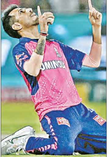
ପରେ ଏହି ଯୋଡ଼ି ଭାଙ୍ଗିଯାଇଥିଲା। ଏହା ପରେ ଟିକ ବର୍ଷା ୪୫ ବଲରେ ୫ ଚୌକା ଓ ୩

ସନ୍ଧ୍ୟାପକ ଘାତକ ବୋଲି ଓ ଯଶ୍ୱନ୍ତୀ ଜୟସ୍ଥାନଙ୍କ ଅପରାଜିତ ଶତକ ସହାୟତାରେ ଏଠାରେ ଯୋଗଦାନ ଅନୁଷ୍ଠିତ ଆଇପିଏଲର ୩୮ତମ ଲିଭ୍ ମ୍ୟାଚ୍‌ରେ ରାଜସ୍ଥାନ ରୟାଲ୍ ୯ ଝିକେଟ୍‌ରେ ମୁମ୍ବାଇ ଇଣ୍ଡିଆନ୍‌ଙ୍କୁ ପରାସ୍ତ କରିଛି। ଫଳରେ ରାଜସ୍ଥାନ ୮ମ ମ୍ୟାଚ୍‌ରୁ ୬ମ ବିଜୟ ସହ ପଦ ସଂଗ୍ରହ ପ୍ରଥମ ସ୍ଥାନ ବଜାୟ ରଖିଛି। ଅନ୍ୟପକ୍ଷରେ ମୁମ୍ବାଇ ୮ମ ମ୍ୟାଚ୍‌ରୁ ୫ମ ପରାଜୟ ବରଣ କରିଛି। ଏହି ମ୍ୟାଚ୍‌ରେ ସନ୍ଧ୍ୟାପକ ଘାତକ ୧୮ ରନ୍‌ରେ ୫ ଝିକେଟ୍ ନେବା ଫଳରେ ପ୍ରଥମେ ବ୍ୟାଟିଂ କରିଥିବା ମୁମ୍ବାଇ ୯ ଝିକେଟ୍‌ରେ ୧୨୯ ରନ୍ କରିଥିଲା। ଜବାବରେ ରାଜସ୍ଥାନ