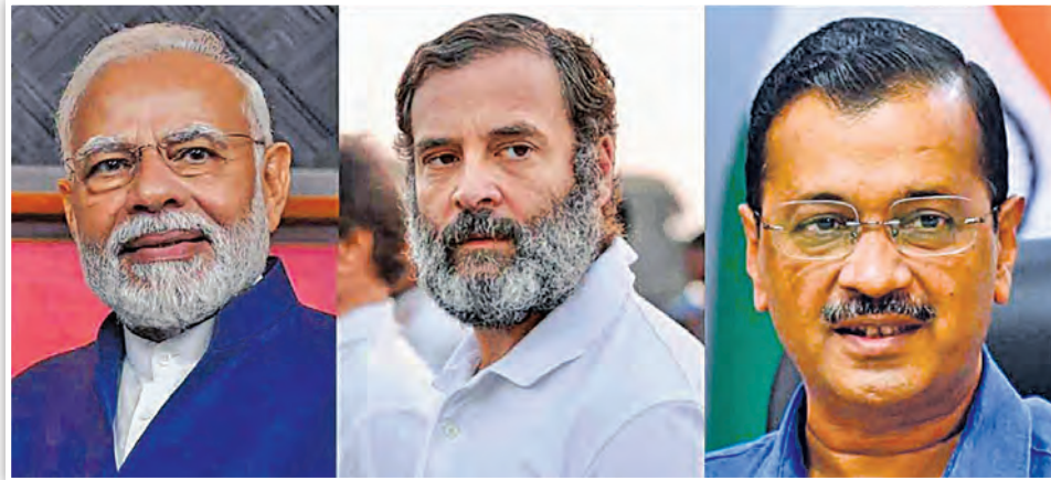
ମୁଖ୍ୟ ପ୍ରତିଦ୍ୱନ୍ଦ୍ୱୀ ଦଳ: ବିଜେପି, କଂଗ୍ରେସ, ଆୟ