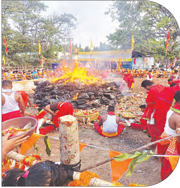
ତାଳଚେରସଦର, ୨୨୧୪ (ସମିପ)