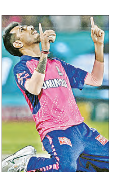
ପରେ ଏହି ଯୋଡ଼ି ଭାଙ୍ଗିଯାଇଥିଲା। ଏହା ପରେ ଡିକେଟ୍ ବର୍ମା ୪୫ ବଲରେ ୫ ଚୌକା ଓ ୩

ସମ୍ମାନ ରଖିଲେ ଡିକେଟ୍-ନେହାଲ ମୁମ୍ବାଇ ଦଳ ପ୍ରଥମେ ବ୍ୟାଟିଂ ଲାଗି ଆମନ୍ତ୍ରଣ ପାଇବା ପରେ ୨୦ ରନରେ ପ୍ରଥମ ୩ଟି ଓ ୫୨ ରନରେ ୪ଟି ଡିକେଟ୍ ହରାଇ ବିପକ୍ଷରେ ପଡ଼ିଥିଲା। କିନ୍ତୁ ଚଳିତ ସିନେକରେ ଭଲ ଫର୍ମରେ ଥିବା ଡିକେଟ୍ ବର୍ମା ଓ ପ୍ରଥମ ମ୍ୟାଟ୍ ଖେଳୁଥିବା ନେହାଲ ଖାଧେରା ୫୮ ଡିକେଟ୍‌ରୁ ୫୨ ବଲରେ ୯୯ ରନ ହୋଇ ବଳକୁ ଏକ ଭଲ ସ୍ଥିତିରେ ପହଞ୍ଚାଇଥିଲେ। ୧୨ଟି ଓଭର ଶେଷରେ ଦଳ ୪ ଡିକେଟ୍ ହରାଇ ୧୫୧ ରନ କରିଥିଲା। କିନ୍ତୁ ୨୪ ବଲରୁ ୩ ଚୌକା ଓ ୪୫୫ ବଲରୁ ୧୨୦ଟି ଡିକେଟ୍ ହାସଲ କରିଥିଲେ।