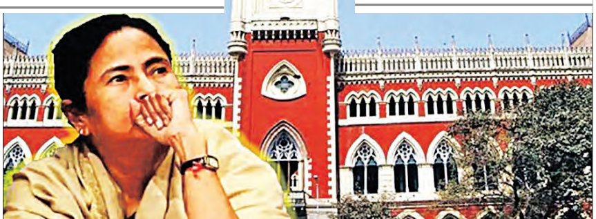
ନେତାଙ୍କ ସମେତ କିଛି ବିଧାୟକ ଏବଂ ଶିକ୍ଷା ବିଭାଗର ବହୁ ଅଧିକାରୀଙ୍କୁ ଗିରଫ କରିଥିଲା । ତେବେ ଏହି ବୋଲି କହିବା ସହିତ ହାଇକୋର୍ଟଙ୍କ ରାୟ ବିରୋଧରେ ସୁପ୍ରିମକୋର୍ଟ ଯିବେ ବୋଲି କହିଛନ୍ତି ।