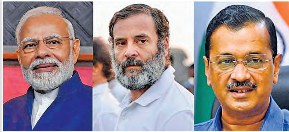
ମୁଖ୍ୟ ପ୍ରତିଦ୍ୱନ୍ଦ୍ୱୀ ଦଳ: ବିଜେପି, କଂଗ୍ରେସ, ଆୟ

ଅଞ୍ଚଳରେ ଭୋଟମାନଙ୍କ ଉପରେ ପ୍ରଭାବ ପଡ଼ିପାରେ ବୋଲି କୁହାଯାଇଛି। ଏହାବ୍ୟତୀତ ନିକଟରେ କଂଗ୍ରେସ ଛାଡ଼ି ବିଜେପିରେ ସାମିଲ ହୋଇଥିବା କିଛି ପ୍ରମୁଖ ନେତାଙ୍କୁ ବିଜେପିରେ ଏବେ ଗୁରୁତ୍ୱ ଦିଆଯାଉଥିବାରୁ ଏହା ଦଳୀୟ କର୍ମକର୍ତ୍ତାଙ୍କ ପାଇଁ ଅସନ୍ତୋଷର କାରଣ ହୋଇଛି। କଂଗ୍ରେସ ଗତ ବିଧାନସଭା ନିର୍ବାଚନରେ ୧୮୨ଟି ଆସନ ମଧ୍ୟରୁ ମାତ୍ର ୧୭ଟି ଆସନରେ ବିଜୟ ହୋଇଥିଲା। ଏହାପରେ ରାଜ୍ୟରେ ଦଳୀୟ କର୍ମକର୍ତ୍ତାଙ୍କ ସଂଗଠନିକ ଦସତା ବୃଦ୍ଧି ସହିତ ଆଦିବାସୀ ଏବଂ ଭିନ୍ନ ସଂପ୍ରଦାୟ ଭିତ୍ତିରେ ନୂଆ ରଣନୀତି ସହିତ କାର୍ଯ୍ୟ କରି ଦଳକୁ ଆହୁରି ସଶକ୍ତ କରିବାକୁ ଦଳ ଗୁରୁତ୍ୱ ଦେଉଥିଲା।