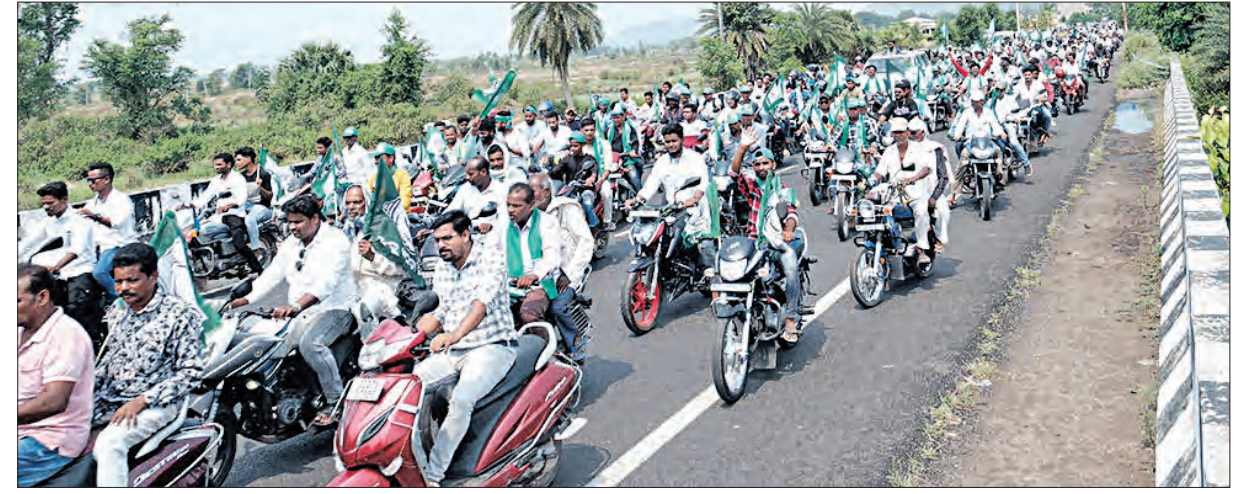
ନାମାଙ୍କନ ପାଇଁ ବିଶାଳ ଶୋଭାଯାତ୍ରା