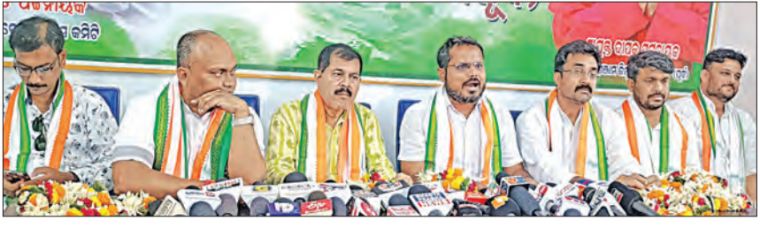
ବୁଦ୍ଧପୁର, ୨୨ ୧୪ (ସମିପ)

କେନ୍ଦ୍ରର ମୋଦି ସରକାର ଅମଳରେ ଦେଶରେ ବେକାରୀ ସମସ୍ୟା ଉକ୍ତ ହୋଇଛି। ସେହିଭଳି ପ୍ରବାସୀ ସଂଖ୍ୟା ମଧ୍ୟ ବିଭିନ୍ନ ରାଜ୍ୟରେ ବୃଦ୍ଧି ପାଇଛି। ଲୋକଙ୍କୁ