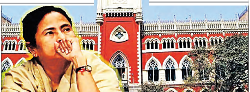
ନେତାଙ୍କ ସମେତ କିଛି ବିଧାୟକ ଏବଂ ଶିକ୍ଷା ବିଭାଗର ବହୁ ଅଧିକାରୀଙ୍କୁ ଗିରଫ କରିଥିଲା । ତେବେ ଏହି ବୋଲି କହିବା ସହିତ ହାଇକୋର୍ଟଙ୍କ ରାୟ ବିରୋଧରେ ସୁପ୍ରିମକୋର୍ଟ ଯିବେ ବୋଲି କହିଛନ୍ତି ।