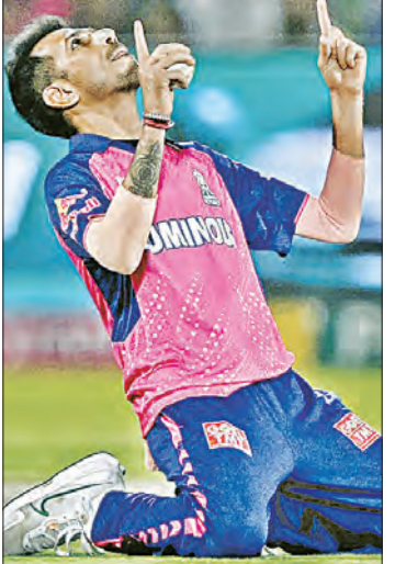
ପରେ ଏହି ଯୋଡ଼ି ଭାଙ୍ଗିଯାଇଥିଲା। ଏହା ପରେ ଡିକ୍‌ ବର୍ମା ୪୫ ବଲ୍‌ରେ ୫ ଚୌକା ଓ ୩

ସନ୍ଦୀପ ଶର୍ମାଙ୍କ ଘାତକ ବୋଲି ଓ ଯଶ୍‌ବା ଜୟସ୍ଥାନଙ୍କ ଅପରାଜିତ ଶତକ ସହାୟତାରେ ଏଠାରେ ଯୋଗଦାନ ଅନୁଷ୍ଠିତ ଆଇପିଏଲର ୩୮ତମ ଲିଗ୍ ମ୍ୟାଚ୍‌ରେ ରାଜସ୍ଥାନ ରୟାଲ୍ ୯ ଓକେଟ୍‌ରେ ମୁମ୍ବାଇ ଇଣ୍ଡିଆନ୍‌କୁ ପରାସ୍ତ କରିଛି। ଫଳରେ ରାଜସ୍ଥାନ ୮ମ ମ୍ୟାଚ୍‌ରୁ ୬ମ ବିଜୟ ସହ ପଦ୍ମ ସାରଣୀର ପ୍ରଥମ ସ୍ଥାନ ବଜାୟ ରଖିଛି। ଅନ୍ୟପକ୍ଷରେ ମୁମ୍ବାଇ ୮ମ ମ୍ୟାଚ୍‌ରୁ ୫ମ ପରାଜୟ ବରଣ କରିଛି। ଏହି ମ୍ୟାଚ୍‌ରେ ସନ୍ଦୀପ ଶର୍ମା ୧୮ ରନ୍‌ରେ ୫ ଓକେଟ୍ ନେବା ଫଳରେ ପ୍ରଥମେ ବ୍ୟାଟିଂ କରିଥିବା ମୁମ୍ବାଇ ୯ ଓକେଟ୍‌ରେ ୧୨୯ ରନ୍ କରିଥିଲା। ଜବାବରେ ରାଜସ୍ଥାନ