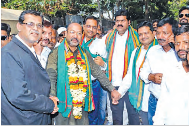
ବୁଦ୍ଧପୁର, ୨୨ ୧୪ (ସମିପ)