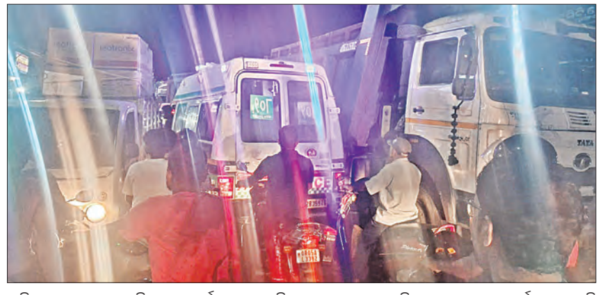
ଭଳି ଅପାଦବଶମ୍ଭୁ ଗାଡ଼ି ମଧ୍ୟ ଦୀର୍ଘ ସମୟ ଧରି ଏହି ଭିଡ଼ ମଧ୍ୟରେ ପର୍ଯ୍ୟନ୍ତ ରହିବାକୁ ପଡ଼ୁଛି। ତେଣୁ ରୁଗ୍ଣ ପାରାଦୀପ ଶିଳ୍ପାଞ୍ଚଳକୁ ଯାଉଥିବା ଗାଡ଼ିଗୁଡ଼ିକୁ କଟକ-ଚାନ୍ଦବାଲି ରାଜପଥରେ ପୂର୍ବାହୁଲ ରାତି ୧୦ଟା ପର୍ଯ୍ୟନ୍ତ ଚଳପ୍ରଚଳ ବନ୍ଦ କରିବାକୁ ଅଞ୍ଚଳର ଜନସାଧାରଣ ଦାବି କରିଛନ୍ତି।

ପାଇଁ ଦୁହୁରିଆ ବାଟଦେଇ କଟକ - ଚାନ୍ଦବାଲି ରାଜପଥକୁ ବ୍ୟବହାର କରୁଛନ୍ତି। ଯାହା ଫଳରେ ଏହି ରାଜପଥଟି ଉପରୋକ୍ତ ଭାରୀଯାନ ପାଇଁ ବ୍ୟସ୍ତବହୁଳ ହୋଇପଡ଼ୁଥିବା ବେଳେ ସମାଧିବଦା ରାସ୍ତା କାମ୍ ହୋଇ ରହିଛି। ପରିସ୍ଥିତି ଏପରି ଉପରୋକ୍ତ ସାଧାରଣ ପଥଚାରୀଟିଏ ରାସ୍ତା ପାରିହେବାକୁ ଦୀର୍ଘସମୟ ଧରି