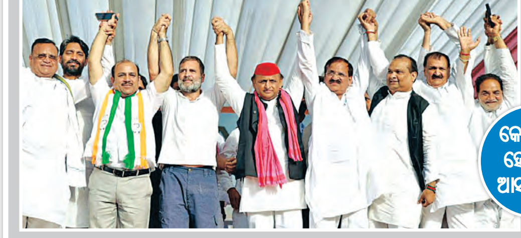
କେନ୍ଦ୍ରୀୟ ଉପସଭା ଆସନ ଖାଲି

ଝାଡ଼ଖଣ୍ଡର ରାଜଧାନୀ ସହର ରାଞ୍ଚିର ପ୍ରଭାତ ତାରା ମଇଦାନରେ ଆଜି ଇଣ୍ଡି ମେଣ୍ଟ ପକ୍ଷରୁ ଏକ ବଡ଼ ସଭାର ଆୟୋଜନ କରାଯାଇଥିଲା। ଝାଡ଼ଖଣ୍ଡ ମୁକ୍ତି ମୋର୍ଚ୍ଚା (ଜେଏମଏମ୍) ନେତୃତ୍ୱରେ ଆୟୋଜିତ ଏହି ସଭାରେ ଇଣ୍ଡି ମେଣ୍ଟର ପ୍ରାୟ ସମସ୍ତ ଅଂଶଦାର ବକଳନେତାମାନେ ଉପସ୍ଥିତ ଥିଲେ। ଏଥିରେ ଜେଏମଏମ୍