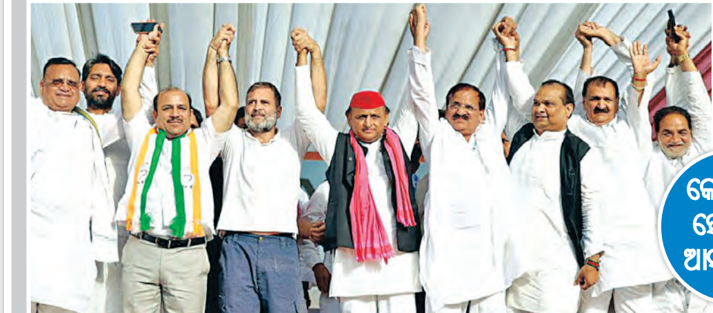
କେଜ୍ରିୱାଲ- ହେମନ୍ତଙ୍କ ଆସନ ଖାଲି

ଝାଡ଼ଖଣ୍ଡର ରାଜଧାନୀ ସହର ରାଷ୍ଟ୍ରର ପ୍ରଭାତ ତାରା ମିଳନଦାନରେ ଆଜି ଇଣ୍ଡି ମେଣ୍ଟ ପକ୍ଷରୁ ଏକ ବଡ଼ ସଭାର ଆୟୋଜନ କରାଯାଇଥିଲା। ଝାଡ଼ଖଣ୍ଡ ମୁକ୍ତି ମୋର୍ଚ୍ଚା (ଜେଏମଏମ୍) ନେତୃତ୍ୱରେ ଆୟୋଜିତ ଏହି ସଭାରେ ଇଣ୍ଡି ମେଣ୍ଟର ପ୍ରାୟ ସମସ୍ତ ଅଂଶଦାର ବକଳନେତାମାନେ ଉପସ୍ଥିତ ଥିଲେ। ଏଥିରେ ଜେଏମଏମ୍