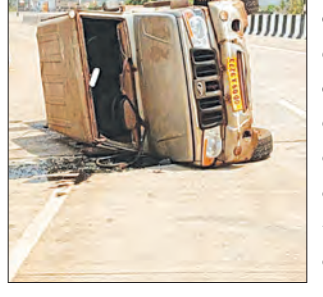
ରାଗସାମ୍ୟ ହରାଇ ଓଲଟିପଡ଼ିଥିଲା। ପୂର୍ବରୁ ମଧ୍ୟ ଆଖିକା କରାଯାଇଥିଲା ଯେ, ପୁ୍ଣ୍ୟସ୍ତମ୍ଭର ଉପରେ ଥିବା ଉଚ୍ଚ ଅକାବକା ରାସ୍ତା ଦୁର୍ଘଟଣାର କାରଣ ହୋଇପାରେ। ଅନ୍ୟ ପକ୍ଷରେ ପୁ୍ଣ୍ୟସ୍ତମ୍ଭର ଉପରେ ଗତି ନିୟନ୍ତ୍ରଣ ଓ ସିଦ୍ଧି କାମେରା ଲଗାଯାଇନାହିଁ। ବେପରୁଆ ଗାଡ଼ି ଚାଳକଙ୍କ ଗତି ନିୟନ୍ତ୍ରଣ କରା ନ ଗଲେ ପୁ୍ଣ୍ୟସ୍ତମ୍ଭର ଉପରେ ମଧ୍ୟ ଖସି ପଡ଼ିବାର ସମ୍ଭାବନା ରହିଛି। ଜିଲ୍ଲା ପ୍ରଶାସନ ଏ ଦିଗରେ ପଦକ୍ଷେପ ନେବା ପାଇଁ ଯୋଡ଼ା ଜନସାଧାରଣ ଦାବି କରିଛନ୍ତି।

କେନ୍ଦୁଝର ଜିଲ୍ଲା ଯୋଡ଼ା ସହରରେ ନୂତନ କରି ନିର୍ମାଣ ହୋଇଥିବା ରାଜ୍ୟର ଦୀର୍ଘତମ ପୁ୍ଣ୍ୟସ୍ତମ୍ଭର ଉପରେ ରବିବାର ଏକ ବୋଲେରୋ ଦୁର୍ଘଟଣାଗ୍ରସ୍ତ ହୋଇଛି। ଏଥିରେ ବୋଲେରୋ ଡ୍ରାଇଭର ସାମାନ୍ୟ ଆହତ ହୋଇଥିବା ପ୍ରତ୍ୟକ୍ଷଦର୍ଶୀ କହିଥିବା ବେଳେ ଆହତଙ୍କ ସଠିକ୍ ତଥ୍ୟ ମିଳି ପାରିନାହିଁ। ସୂଚନାଯୋଗ୍ୟ ଯେ, ଓଡ଼ର ବ୍ରିକ ଉପରେ ଥିବା ଏକ ଅକାବକା ରାସ୍ତାରେ ବୋଲେରୋଟି