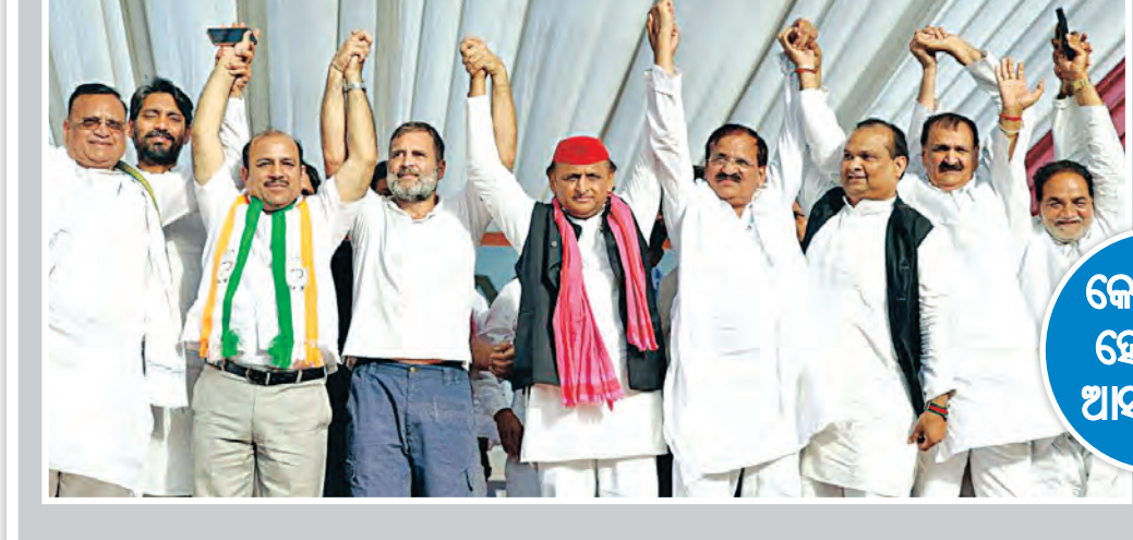
କେଜ୍ରିୱାଲ- ହେମନ୍ତଙ୍କ ଆସନ ଖାଲି

ଝାଡ଼ଖଣ୍ଡର ରାଜଧାନୀ ସହର ରାଞ୍ଚିର ପ୍ରଭାତ ତାରା ମଇଦାନରେ ଆଜି ଇଣ୍ଡି ମେଣ୍ଟ ପକ୍ଷରୁ ଏକ ବଡ଼ ସଭାର ଆୟୋଜନ କରାଯାଇଥିଲା। ଝାଡ଼ଖଣ୍ଡ ମୁକ୍ତି ମୋର୍ଚ୍ଚା (ଜେଏମଏମ୍) ନେତୃତ୍ୱରେ ଆୟୋଜିତ ଏହି ସଭାରେ ଇଣ୍ଡି ମେଣ୍ଟର ପ୍ରାୟ ସମସ୍ତ ଅଂଶଦାର ବକରନେତାମାନେ ଉପସ୍ଥିତ ଥିଲେ। ଏଥିରେ ଜେଏମଏମ୍