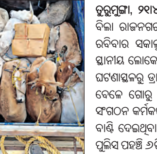
ହୁମୁମ୍ମା, ୨୧୪(ସମ୍ବିଧ): କେନ୍ଦୁଝର ଜିଲ୍ଲା ସାହାରପଡ଼ା ବ୍ଲକ ବିଳା ରାଜନଗର ରାସ୍ତାର ଗଦଗଡ଼ି ବେହେରା ସାହି ନିକଟରୁ ରବିବାର ସକାଳୁ ଏକ ଗୋରୁ ବୋଝେଇ ପିକ୍‌ଅପ ଭ୍ୟାନକୁ ସ୍ଥାନୀୟ ଲୋକେ ଜବତ କରି ପୁଲିସ ସହୁ ହସ୍ତାନ୍ତର କରିଛନ୍ତି। ଘଟଣାସ୍ଥଳରୁ ଡ୍ରାଇଭର ଓ ହେଲପର ଫେରାର ହୋଇଯାଇଥିବା ବେଳେ ଗୋରୁ ବୋଝେଇ ପିକ୍‌ଅପରୁ ସ୍ଥାନୀୟ ଅଞ୍ଚଳର ଏକ ସଂଗଠନ କର୍ମକର୍ତ୍ତା ଲୋକଙ୍କ ଆଧାର କାର୍ଡ ନେଇ ୧୦ ଗୋରୁକୁ ବାଣ୍ଟି ଦେଇଥିବା ବେଳେ ସୂଚନା ପାଇ ଘଟଣାସ୍ଥଳରେ ପାଟଣା ପୁଲିସ ପହଞ୍ଚି ୬ଟି ଗୋରୁକୁ ଉଦ୍ଧାର କରିଛି।