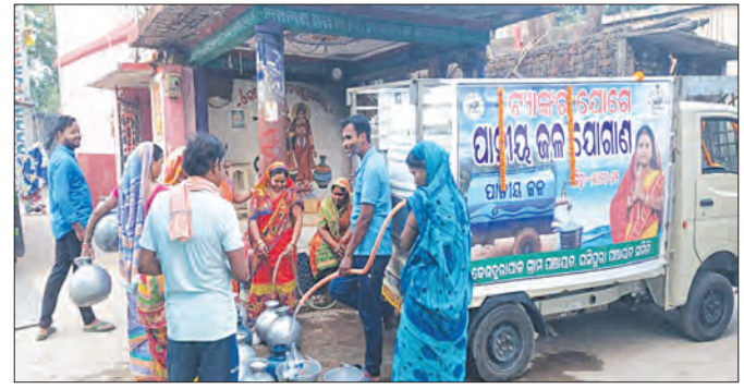
ବୋଟି କରାଯିବ ପରେ ପାନୀୟ ଜଳ ସମସ୍ୟା କେତେକାଂଶରେ ସମାଧାନ ହୋଇଥିବା ବେଳେ ଏବେ ୨୯୯୯ ପର୍ଯ୍ୟନ୍ତ ହାରସ ଅଟଳ ହୋଇପଡ଼ିଥିବାରୁ ପୁଣି ଆଉ ଏକ ସମସ୍ୟା ସୃଷ୍ଟି ହୋଇଛି। ରେମାଳ ତ୍ୟାମରେ ଜଳପତନ ଖସିଯାଇଥିବାରୁ ନଦୀରେ ପାଣି ଆସୁନଥିବା ଓ ଏଥି ଯୋଗୁ ୨୯୯୯ ପର୍ଯ୍ୟନ୍ତ ହାରସ ଅଟଳ ହୋଇପଡ଼ିଥିବାରୁ ହୋଇଛି।

ଗ୍ରାମ୍ୟ ପ୍ରବାହରେ ଦିନକୁ ଦିନ ଉଚ୍ଚାପ ବହୁଥିବା ଏବଂ ଗୁଳୁଗୁଳି ଓ ଅସହ୍ୟ ଚାଟିରେ ଲୋକେ ଛଟପଟ ହେଉଥିବା ବେଳେ କେଶଦୁରାପାଳ ଗ୍ରାମରେ ପାନୀୟ ଜଳର ଉତ୍କଟ ଅଭାବ ଏହି ଅବସ୍ଥାକୁ ଦୃଷ୍ଟିତ କରିଛି। ଏଠାରେ ଥିବା ଜଳ ଯୋଗାଣ ବ୍ୟବସ୍ଥାରେ ଦୀର୍ଘଦିନ ହେବ ସମସ୍ୟା ଲାଗି ରହିଥିବାରୁ ଗ୍ରାମବାସୀ ପାନୀୟଜଳ ପାଇଁ ନଥିବା ହାନିସ୍ଥା ହେଉଛନ୍ତି। ଏହି ଗ୍ରାମବାସୀଙ୍କୁ ପାନୀୟ ଜଳ ଯୋଗାଇ ଦେବାକୁ ରେମାଳ ନଦୀରେ ହୁଇଗୋଟି ଗଭୀର ନଳକୂପ ଖୋଳାଯାଇଅଛି। ୧୯୯୯ ପର୍ଯ୍ୟନ୍ତ ହାରସ ପାଇଁ