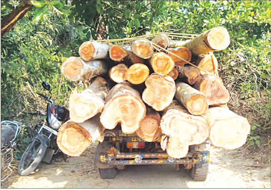
ଭୋଗରାଇ ବୁକ୍ସରେ ବହୁ ବର୍ଷ ଧରି ଚାଲିଆସୁଥିବା ଛୋଟ ବହୁ ୧୪ଟି କରତକଳ ସବୁଦିନ ପାଇଁ ବନ୍ଦ ହୋଇଯାଇଛି । ଫଳରେ ସରକାରୀ ଓ ବେସରକାରୀ ଗୃହ ନିର୍ମାଣ ପାଇଁ ସେଣ୍ଟିମିଟର କାଠ, ଗୃହ ସଜା, କବାଟ, ଝରକା, ଝିଅ ବାହାଘର ପାଇଁ ଯୌତୁକ ସାମଗ୍ରୀ ନିର୍ମାଣ, ଆସବାବପତ୍ର ନିର୍ମାଣ ଏବଂ ଜାଳେଣି କାଠ

ଓଡ଼ିଶାରେ ବନ୍ଦ ହେବା ପରେ କରତକଳ ସବୁ ସାମାନ୍ୟ ପଶୁମତ୍ସ୍ୟ ଚାଲିଯାଇଛି । ଫଳରେ ଓଡ଼ିଶାର କାଠ ପଶୁମତ୍ସ୍ୟ କରତକଳକୁ ଯାଉଛି । ଘରୋଇ ବ୍ୟବହାର ପାଇଁ ପଶୁମତ୍ସ୍ୟ କରତକଳକୁ କାଠ ନେଇଯାଉଥିବା ଲୋକେ ରାସ୍ତାରୁ ବନ୍ଦ ବିଭାଗ କର୍ମଚାରୀ ଓ ନିଜକୁ ସାମ୍ବୁଦ୍ଧି ପରିଚୟ ଦେଉଥିବା କିଛି ନକଲି ସାମ୍ବୁଦ୍ଧିକଙ୍କ ଦ୍ୱାରା ଲୁଚାଇ ଶିକାର ହେଉଛନ୍ତି । ଅନ୍ୟପକ୍ଷରେ ବନ୍ଦ ବିଭାଗ କର୍ମଚାରୀ ଓ ନକଲି ସାମ୍ବୁଦ୍ଧିକଙ୍କ ସହ ମଧୁରସିଦ୍ଧିକାରେ ରହି କାଠମାଫିଆ ମାନେ ବିକଳିତ ରାତିରେ ଓଡ଼ିଶାର ବହୁ ମୂଲ୍ୟବାନ କାଠକୁ ପଶୁମତ୍ସ୍ୟ ଚାଲାଇ କରୁଛନ୍ତି । ବାଲେଶ୍ୱର ଜିଲ୍ଲା ଭୋଗରାଇ ବୁକ୍ସରେ ଏଭଳି ଘଟଣା ଦେଖିବାକୁ ମିଳିଛି ।