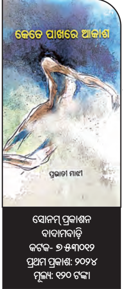
ସୋନମ୍ ପ୍ରକାଶନ ବାବାମବାଡ଼ି କଟକ-୭୫୩୦୧୨ ପ୍ରଥମ ପ୍ରକାଶନ: ୨୦୨୪ ମୂଲ୍ୟ: ୧୨୦ ଟଙ୍କା

“ମାଟି , ମଞ୍ଜି ମା' ଦି ପାଳ ହୁଅନ୍ତି/ ଉକୁଟି ଆସେ ନାଳ ଅଙ୍କୁର କାବନ/ ମା'ଟିଏ ସୁଖିଥିବାରୁ ପ୍ରଣାମ ନିଅନ୍ତି ଛଣ୍ଡର/ ଏବେ କିକୁ ମା' କାନ୍ଦକାନ୍ଦ ଚଉଦିଗ।” (ସ୍ତ୍ରୀ ଲୋକ) ମା' ହେଉଛି ସହନଶୀଳ, ସର୍ବସମ୍ପାଦ। ସନ୍ତାନ ପାଇଁ ସମର୍ପିତ ତା'ର ସାରା ଜୀବନ। ତେବେ ମା' ବି ବେଳେ ବେଳେ ଅସହାୟ ହୋଇପଡ଼େ, ଆଖିରୁ ଲୁହ ଝରାଏ। ନାରୀ ସ୍ୱାଧୀନତା କୋମଳ ଅନୁଭବ ପ୍ରକାଶିତ ହୋଇଛି ପ୍ରଭାତୀ ମାଝାଙ୍କ