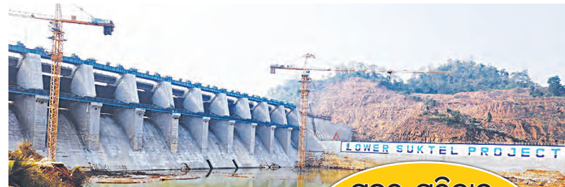
ପ୍ରକଳ୍ପ, ପ୍ରତିବାଦ, ସଂଘର୍ଷ ଓ ସଫଳତା