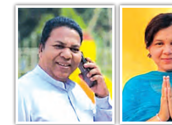
ନିର୍ବାଚନ ମଇଦାନରେ ବାପା-ଝିଅ

ଆସନରୁ ସଂପର୍କୀୟ ପୁରୁଣା ଅନାମ ଦିଆନ ଟିକଟ ପାଇଛନ୍ତି। ଏହି ଦୁଇଜଣ ଟିକଟ ପାଇବା ପଛରେ ଭୁଜବଳଙ୍କ ହାତ ଥିବା କଂଗ୍ରେସ କର୍ମୀମହଲରେ ଅଭିଯୋଗ ହେଉଛି। ତେଣୁ କର୍ମୀ ମହଲରେ ଗ୍ରହଣ କରିବେ, ତାହା ଦେଖିବା ବାକି ରହିଲା।