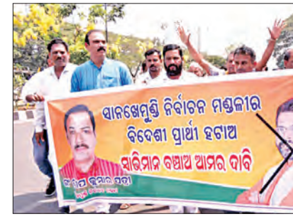
ବାଙ୍ଗିରିପୋଷି ବିଜେପିରେ ଲାଗିଲା ବିଦ୍ରୋହ ନିଆଁ ପ୍ରାର୍ଥୀ ଘୋଷଣା ପରେ ପଟ୍ଟାମୁଣ୍ଡର ସଂଗଠନ ୨ ଯାକ ଗୁମର ଖୋଲିଲେ ସାନଖେମୁଣ୍ଡି ଟିକଟ ଆଶାୟୀ ମନମୋହନଙ୍କ ସହଯୋଗୀ ମାରିଥିଲେ ୫୦ ଲକ୍ଷ

ପ୍ରତିଦିନ ବିଦ୍ରୋହୀ ମେଳି ହୋଇ ରାଜ୍ୟ ବିଜେପି କାର୍ଯ୍ୟାଳୟରେ ହଜାମା କରୁଛନ୍ତି। ଶୁକ୍ରବାର ଗଞ୍ଜାମ ଜିଲ୍ଲା ସାନଖେମୁଣ୍ଡିର ଦକାଇ କର୍ମୀ ଓ ନେତା ରାଜ୍ୟ ସଭାପତିଙ୍କ ବିରୋଧରେ ସମ୍ମାନ ଅଭିଯୋଗ ଆଣି ରାଜ୍ୟ କାର୍ଯ୍ୟାଳୟରେ ହୋ-ହଲ୍ଲା କରୁଛନ୍ତି। ଅନ୍ୟ ଦଳର ତଡ଼ାଖୁଆ ଜନବିରୋଧୀ ନେତାଙ୍କୁ ଦଳ ପ୍ରାର୍ଥୀ କରିଥିବାରୁ ଶୋଭା ପ୍ରକାଶ କରି ଭଙ୍ଗାଲୁକା କରିବାକୁ ମଧ୍ୟ ବିଜେପି କର୍ମୀ ପଛାଇ ନାହାନ୍ତି। ଦକ୍ଷତା ଅପେକ୍ଷା ଟଙ୍କା ଦେଲେ ଟିକଟ ମିଳୁଛି ବୋଲି ଅଭିଯୋଗ କରି