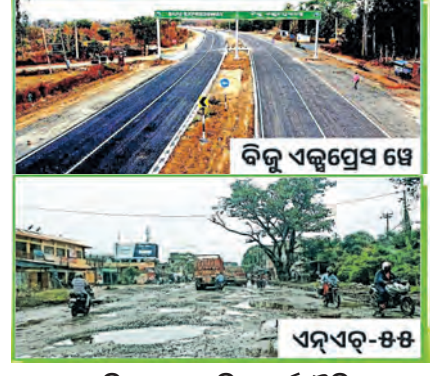
୮ କିଲୋର ସାମାଜିକ-ଅର୍ଥନୈତିକ ପରିବର୍ତ୍ତନର ମାଧ୍ୟମ ବିଜୁ ଏକ୍ସପ୍ରେସ୍-୬୬ ୨୦୨୬ ପୁଣି ବ୍ରହ୍ମପୁର-କୋରାପୁଟ ଦ୍ୱିତୀୟ ବିଜୁ ଏକ୍ସପ୍ରେସ୍-୬୬

ଦ୍ୱାରା ନିର୍ମିତ ଏହି ରାସ୍ତା ଦେଶର ଅନ୍ୟତମ ଶ୍ରେଷ୍ଠ ରାସ୍ତା । ଅପରପକ୍ଷେ ଦ୍ୱିତୀୟ ପଟୋଟି ଏନ୍-ଏଚ୍-୫-୫ର ଉତ୍ତର ୧୦ ବର୍ଷ ହେଲାଣି ଏହାର ନିର୍ମାଣ କାମ ସମ୍ପୂର୍ଣ୍ଣ । ଏନ୍-ଏଚ୍-୫-୫ରେ ଗତ ୫ ବର୍ଷରେ ୪୦୦ରୁ ଅଧିକ ଦୁର୍ଘଟଣା ଘଟିଛି, ୨୦୦ରୁ ଅଧିକ ଲୋକଙ୍କ ମୃତ୍ୟୁ । ► ପୃଷ୍ଠା-୯