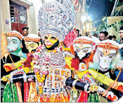
ହରଚଣ୍ଡାସାହି ଆଖଡ଼ା ପକ୍ଷରୁ ଶୋଭାଯାତ୍ରା