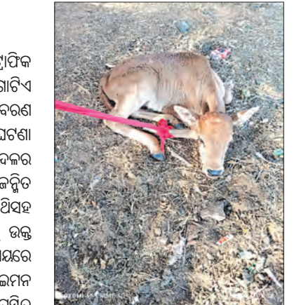
ସ୍ୱେଚ୍ଛାସେବୀଙ୍କ ଏକାକି ପଦକ୍ଷେପକୁ ଯାଧାରରେ ପ୍ରଞ୍ଚାୟା କରାଯାଇଛି।

ସୁନାବେଡ଼ା ପୌର ପରିଷଦର ଗ୍ରାମିକ ଛକ ନିକଟରେ ଏକ ଗାଈ ଗୋଟିଏ ବାଛୁରୀକୁ ଜନ୍ମ କରି ମୃତ୍ୟୁ ବରଣ କରିଥିବାବେଳେ ଖବର ପାଇ ଘଟଣା ସ୍ଥଳରେ ସ୍ଥାନୀୟ ସେବକ ଦଳର ସ୍ୱେଚ୍ଛାସେବୀମାନେ ପହଞ୍ଚି ଜନ୍ମିତ ବାଛୁରୀକୁ ଉଦ୍ଧାର କରିଛନ୍ତି।