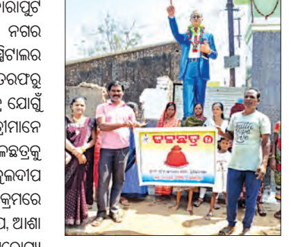
ପର୍ଯ୍ୟନ୍ତ ଜଳଛତ୍ର ଚାଲୁ ରହିବ ବୋଲି ସୂଚନା ଦେଇଛନ୍ତି।

କୋରାପୁଟ ଜିଲ୍ଲା ସେମିଲଗୁଡ଼ା ଆନ୍ଦୋଳନ ନଗର ପାଟକ ନିକଟରେ ସରକାରୀ ହସ୍ପିଟାଲର ସୁରକ୍ଷା ମହିଳା ଆରୋଗ୍ୟ ସମିତି ତରଫରୁ ଜଳଛତ୍ର ଖୋଲାଯାଇଛି।