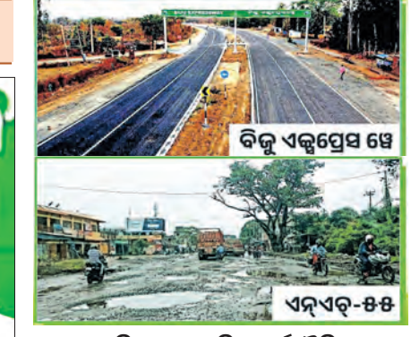
୮ କିଲୋର ସାମାଜିକ-ଅର୍ଥନୈତିକ ପରିବର୍ତ୍ତନର ମାଧ୍ୟମ ବିଜୁ ଏକ୍ସପ୍ରେସ୍-୬୬ ୨୦୨୬ ପୁଣି ବ୍ରହ୍ମପୁର-କୋରାପୁଟ ଦ୍ୱିତୀୟ ବିଜୁ ଏକ୍ସପ୍ରେସ୍-୬୬

ସାରା ନିର୍ମିତ ଏହି ରାସ୍ତା ଦେଶର ଅନ୍ୟତମ ଶ୍ରେଷ୍ଠ ରାସ୍ତା । ଅପରପକ୍ଷେ ଦ୍ୱିତୀୟ ପଟୋଟି ଏନ୍-ଏଚ୍-୫-୫ର ଉତ୍ତର ୧୦ ବର୍ଷ ହେଲାଣି ଏହାର ନିର୍ମାଣ କାମ ସରୁନାହିଁ । ଏନ୍-ଏଚ୍-୫-୫ରେ ଗତ ୫ ବର୍ଷରେ ୪୦୦ରୁ ଅଧିକ ଦୁର୍ଘଟଣା ଘଟିଛି, ୨୦୦ରୁ ଅଧିକ ଲୋକଙ୍କ