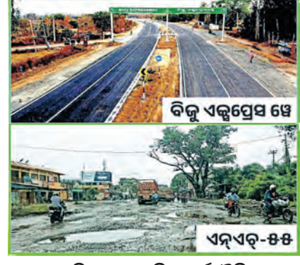
୮ କିଲୋର ସାମାଜିକ-ଅର୍ଥନୈତିକ ପରିବର୍ତ୍ତନର ମାଧ୍ୟମ ବିଜୁ ଏକ୍ସପ୍ରେସ୍-୬୬ ୨୦୨୬ ପୁଣି ବୁଝୁଥିବେ କୋରାପୁଟ ହିତାୟ ବିଜୁ ଏକ୍ସପ୍ରେସ୍-୬୬