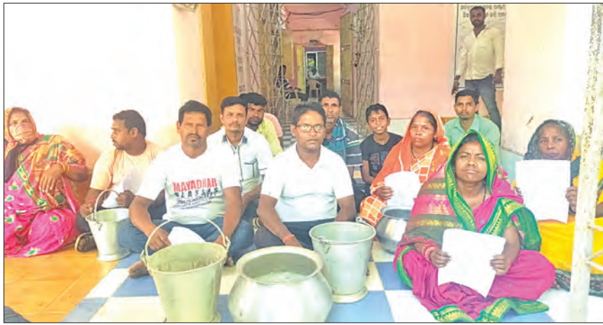
ଧାରଣା ଦେବା ସହ ବିଭିନ୍ନ ବିରୋଧରେ ସଙ୍ଗୀନ ଅଭିଯୋଗ ଆଣିଥିଲେ। ଟାଙ୍ଗା ସାହି ଗୋଟିଏ ପାହାଡ଼ିଆ ଅଞ୍ଚଳରେ ଅବସ୍ଥିତ ଥିବାରୁ ଏବଂ ଏହାର ଲୋକସଂଖ୍ୟା