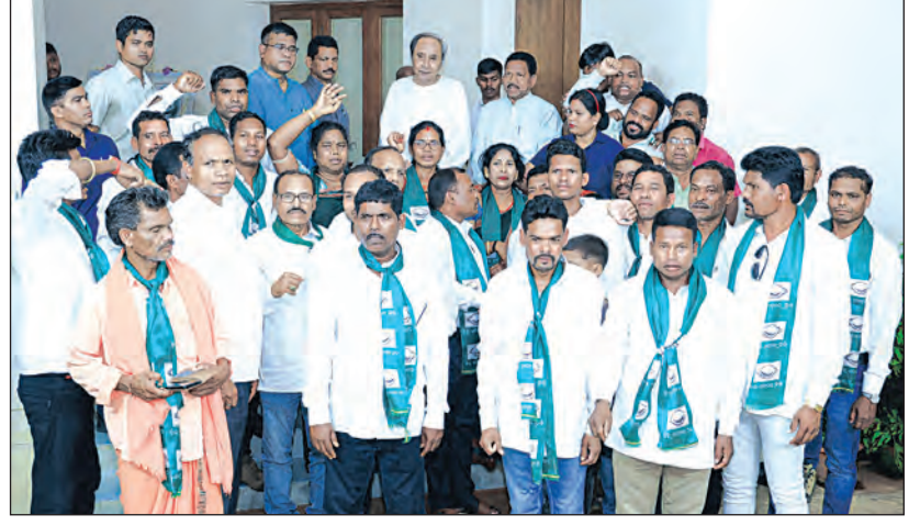
ବିଜେଡିରେ ଯୋଗ ଦେବା ପରେ ଗୁରୁବାର ନବୀନ ନିବାସରେ ମୁଖ୍ୟମନ୍ତ୍ରୀ ନବୀନ ପଟ୍ଟନାୟକଙ୍କୁ ଭେଟି କୃତଜ୍ଞତା ଜଣାଇଛନ୍ତି ଦଳୀୟ ନେତା ଓ କର୍ମୀ