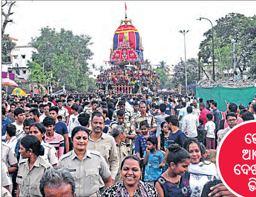
ଭେଟ ଆଳତି ଦେଖିବାକୁ ଭିଡ଼

ଭୁବନେଶ୍ୱର ପ୍ରତୀକ୍ଷାରେ ଅନ୍ତ ଘଟିଛି। ଗୁରୁବାର ସନ୍ଧ୍ୟାରେ ପ୍ରଭୁ ଲିଙ୍ଗରାଜଙ୍କ ରୁକୁଣା ରଥ ମାଉସୀ ମା' ଚିଆରା ମେଣ୍ଟର ମନ୍ଦିରରେ ପହଞ୍ଚିଛି।