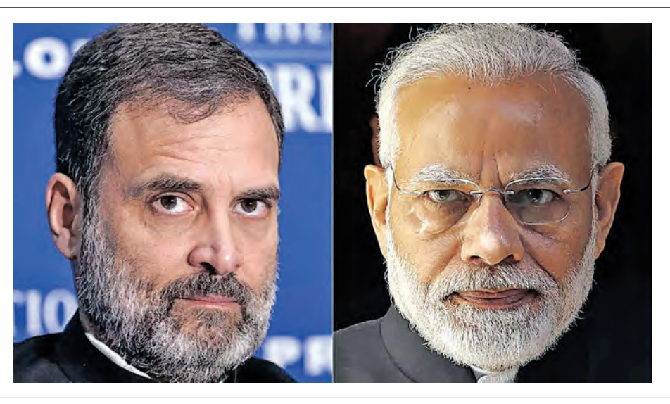
ରାଜନୈତିକ ମହଲ ଚଳଚଞ୍ଚଳ

ବହୁ ପ୍ରତୀକ୍ଷିତ ୨୦୨୪ ଲୋକସଭା ନିର୍ବାଚନ ପାଇଁ ଆସନ୍ତାକାଲି ଠାରୁ ମତଦାନ ଆରମ୍ଭ ହେବାକୁ ଯାଇଛି । ପ୍ରଥମ ପର୍ଯ୍ୟାୟରେ ୨୯ଟି ରାଜ୍ୟ ଏବଂ କେନ୍ଦ୍ରଶାସିତ ଅଞ୍ଚଳର ମୋଟ ୧୦୨ଟି ଆସନ ପାଇଁ ମତଦାନ ହେବ ।