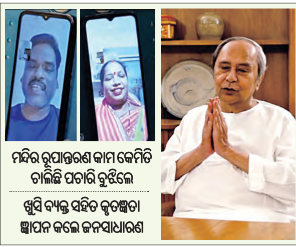
ମନ୍ଦିର ରୂପାନ୍ତରଣ କାମ କେମିତି ଚାଲିଛି ପଚାରି କୁଟିଲେ ଖୁସି ବ୍ୟକ୍ତ ସହିତ କୃତଜ୍ଞତା ଜ୍ଞାପନ କଲେ ଜନସାଧାରଣ

■ ଭୁବନେଶ୍ୱର, ୧୬/୪ (ସମିସ): ସମଗ୍ର ଦେଶ ନିର୍ବାଚନରେ ବ୍ୟସ୍ତ ଥିବା ବେଳେ ରାଜନେତାମାନଙ୍କୁ ଭୋଟ୍ ରାଜନୀତିରୁ ଦୂରସ୍ଥ କରିବା ନିର୍ବାଚନ ପ୍ରଚାରରେ ଦକ୍ଷ କାର୍ଯ୍ୟକ୍ରମରେ ବିଭିନ୍ନ ଜାତୀୟ ଓ ଆଞ୍ଚଳିକ ଦଳର ନେତାମାନେ ବ୍ୟସ୍ତ। ମାତ୍ର ସବୁ ରାଜନୈତିକ ବ୍ୟସ୍ତତା, ଦଳୀୟ କାର୍ଯ୍ୟକ୍ରମ, ପ୍ରାର୍ଥୀ ମନୋନୟନ କାର୍ଯ୍ୟ ସହଜୁ କରାଯେବା ଓ ସାଧାରଣ ଲୋକଙ୍କ ସ୍ୱରାଜ୍ୟକୁ ଗୁଣ୍ଠିବାରୁ ବିରତ ହୋଇ ନାହାନ୍ତି ମୁଖ୍ୟମନ୍ତ୍ରୀ ନବୀନ ପଟ୍ଟନାୟକ। ଜନସେବା ହିଁ ରାଜନୀତିର ମୂଳମନ୍ତ୍ର ବୋଲି ସର୍ବଦା କହୁଥିବା ମୁଖ୍ୟମନ୍ତ୍ରୀ ପୁଣିଥରେ ଏହାକୁ ପ୍ରମାଣିତ କରି ନୂଆ ଉଦାହରଣ ସୃଷ୍ଟି କରିଛନ୍ତି। ଆଜି ସକାଳୁ ରାଜ୍ୟର ବିଭିନ୍ନ ଜିଲ୍ଲାରେ ଜନସାଧାରଣଙ୍କୁ ଯୋଗ ଓ ଭିଡିଓ କଲ କରି ମୁଖ୍ୟମନ୍ତ୍ରୀ ସେମାନଙ୍କ ଅଞ୍ଚଳରେ ଚାଲିଥିବା '୫-ଟି' ରୂପାନ୍ତରଣ କାର୍ଯ୍ୟ ସମ୍ପର୍କରେ ପଚାରି କୁଟିଛନ୍ତି। 'ମୋ ସରକାର' ବ୍ୟବସ୍ଥା ସମଗ୍ର ଦେଶରେ ଏକ ଅଭିନବ ପରମ୍ପରା ସୃଷ୍ଟି କରିଥିବା ବେଳେ ଲୋକଙ୍କ ସହିତ ସିଧାସଳଖ କଥା ହୋଇ ସେମାନଙ୍କ ଭଲ ମନ୍ଦ କୁହୁଥିବା ମୁଖ୍ୟମନ୍ତ୍ରୀ ରାଜନୀତିର ପରିଭାଷାକୁ ବଦଳାଇ ଦେଇଛନ୍ତି। ନିଜ କାର୍ଯ୍ୟ