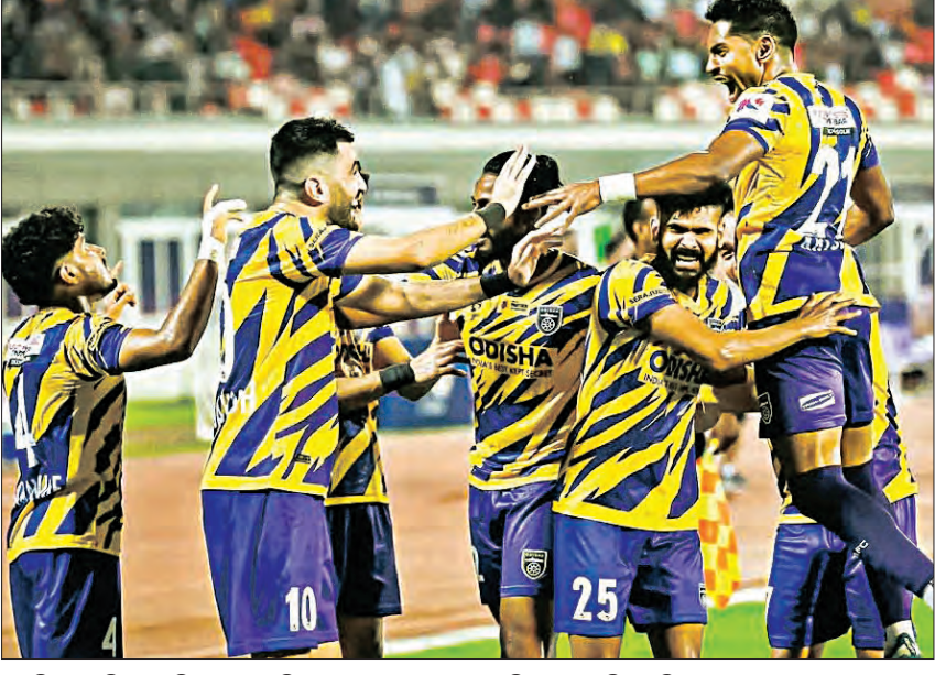
ଖେଳିବ। କଳିଙ୍ଗ ଷ୍ଟାଡିୟମରେ ଏହି ହାଇଲୋଲଡେଜ ମ୍ୟାଚ୍ ଖେଳାଯିବ। ସର୍ବିତ ଲୋକେବଳ ପ୍ରଶିକ୍ଷଣପ୍ରାପ୍ତ ଓଡ଼ିଶା ଏପ୍ସି ଚଳିତ ଆଇଏସ୍ଏଲରେ ପ୍ରଭାବା ପ୍ରଦର୍ଶନ କରି ୨୨ ମ୍ୟାଚ୍ ଖେଳି ୧୧ ବିଜୟ, ୫

ଇଣ୍ଡିଆନ୍ ସୁପର ଲିଗ୍ (ଆଇଏସ୍ଏଲ) ପୂର୍ବରୁ ପ୍ରତିଯୋଗିତାର ଚଳିତ ୧୦ମ ସଂସ୍କରଣର ଲିଗ୍ ଯଯାୟୀ ଶେଷ ହୋଇଛି। ଅଂଶଗ୍ରହଣକାରୀ ସମସ୍ତ ୧୨ ଗୋଟି ଦଳ ୨୨ଟି ଲେଖାଏଁ ମ୍ୟାଚ୍ ଖେଳିସାରିବା ପରେ ମୋହନ ବାଗାନ ସର୍ବାଧିକ ୪୮ ପଏଣ୍ଟ ସହ ଶାର୍ଦ୍ଧ ସ୍ଥାନ ହାସଲ କରିଛି ଓ ଲିଗ୍ ସିଲ୍ଡ ବିଜେତା ହୋଇଛି। ପ୍ରଥମ ଦୁଇ ସ୍ଥାନରେ ରହିଥିବା ମୋହନ ବାଗାନ ଓ ମୁମ୍ବାଇ ସିଟି ସିଧାସଳଖ ସେମିଫାଇନାଲ ଖେଳିବାକୁ ଯୋଗ୍ୟତା ଅର୍ଜନ କରିଛନ୍ତି। ସେହିପରି ସେମିଫାଇନାଲର ଅନ୍ୟ ଦୁଇଟି ସ୍ଥାନ ପାଇଁ ଫ୍ଲୋ-ଅପ୍ ମ୍ୟାଚ୍ ଖେଳାଯିବ। ଏହିପ୍ରକାର ଲିଗ୍ ଯଯାୟୀରେ ମୋହନ ୬୫ ସ୍ଥାନ ମଧ୍ୟରେ ରହିଥିବା ୪ ଗୋଟି ଦଳ ମଧ୍ୟରେ ଫ୍ଲୋ-ଅପ୍ ଖେଳାଯିବ। ଏଥିରେ ଯେଉଁ ଦୁଇ ଦଳ ବିଜୟ ହାସଲ କରିବେ ସେମାନେ ସେମିଫାଇନାଲ ଯୋଗ୍ୟତା ଅର୍ଜନ କରିବେ। ଏହିପ୍ରକାର ଲିଗ୍ ଯଯାୟୀରେ ଲିଗ୍ ଯଯାୟୀ ଭାବେ ଦଳ ଓଡ଼ିଶା ଏପ୍ସି ଫ୍ଲୋ-ଅପ୍ରେ କାହା ବିପକ୍ଷରେ ଖେଳିବ ତାହା ସ୍ପଷ୍ଟ ହୋଇଛି। ଏପ୍ରିଲ ୧୯ରେ ପୂର୍ବଦିନେତା କେରଳା ବ୍ଲାଷ୍ଟର୍ସ ବିପକ୍ଷରେ ଓଡ଼ିଶା ଏପ୍ସି ଏହି ଦଳ ଆଗରୁ ମ୍ୟାଚ୍