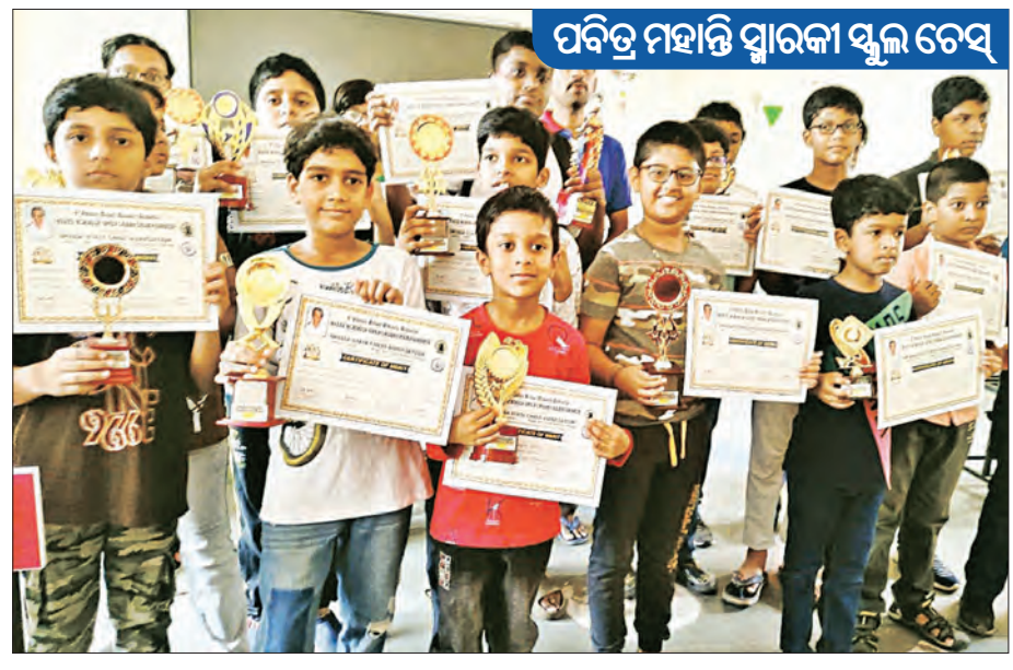
ପବିତ୍ର ମହାନ୍ତି ସ୍ମାରକୀ ସ୍କୁଲ ତେସ୍

ନୂଆଦିଲ୍ଲୀ, ୧୫ ୧୪ (ଏକେଡ଼ି): ଅଷ୍ଟ୍ରେଲିଆର ଦୁଇ ଖ୍ୟାତନାମା ଖେଳାଳି ଷ୍ଟିଭେନ ସ୍ମିଥ ଓ ଡ୍ରାଭିଡ୍ ହେଡ୍ ଚଳିତବର୍ଷ ଆମେରିକା ମେଜର ଲିଗ୍ ଟି-୨୦ କ୍ରିକେଟ୍ ଖେଳିବେ। ଉଭୟ ଖେଳାଳି ଆଷ୍ଟ୍ରେଲିଆ ପ୍ରତିଯୋଗିତାରେ ପ୍ରତିନିଧିତ୍ୱ କରିବେ। ଗତ ଏକବର୍ଷ ହେଲା ସ୍ମିଥ ଆଷ୍ଟ୍ରେଲିଆ ପ୍ରତିଯୋଗିତାରେ ଆସିବାପରେ ଭାବେ ଦାୟିତ୍ୱରେ ରହିଛନ୍ତି। କୁଲାଇ ୪ରୁ ଚଳିତବର୍ଷର ମେଜର ଲିଗ୍ ଆରମ୍ଭ ହେବ। ଖେଳାଳିଙ୍କୁ ଓ ଆମେରିକାରେ ହେବାକୁ ଥିବା ଟି-୨୦ ବିଶ୍ୱକପ୍ ପରେ ହେଉ ଏହି ଦୁର୍ଦ୍ଦିନୀୟ ଖେଳିବାକୁ ନିଷ୍ପତ୍ତି ନେଇଛନ୍ତି। ଏହି ସମୟରେ ଅଷ୍ଟ୍ରେଲିଆର କୌଣସି ଅନ୍ତର୍ଜାତୀୟ କାର୍ଯ୍ୟକ୍ରମ ନାହିଁ। ଏହି ସମୟରେ ବିଶ୍ୱାସ ନେବା ପରିବର୍ତ୍ତେ ମେଜର ଲିଗ୍ ଖେଳିବାକୁ ସ୍ଥିର କରିଛନ୍ତି। ଏବେ ହେଉ ସନ୍ତୋଷକର୍ତ୍ତା ହାଉସ୍/ବାବାଦ୍ ଲାଗି ଆଇପିଏଲ୍ ଖେଳୁଛନ୍ତି। ସେ ମଧ୍ୟ କକରଦସ୍ ପର୍ଯ୍ୟନ୍ତ ରହି ସୋମବାର ବେଙ୍ଗାଲୁରୁ ବିପକ୍ଷରେ ଶତକାନ୍ଦ ପାଇ ଖେଳିଛନ୍ତି। ଚଳିତବର୍ଷ ଆଷ୍ଟ୍ରେଲିଆ ପ୍ରତିଯୋଗିତା ପ୍ରଶିକ୍ଷକ ଭାବେ ରିକି ପଣ୍ଟିଂ ଯୋଗଦେବା ପରେ କିଛି ଭଲ ଖେଳାଳି ଏହି ଲିଗ୍ରେ ସାମିଲ ହୋଇଛନ୍ତି। ଆଷ୍ଟ୍ରେଲିଆ ପ୍ରତିଯୋଗିତାରେ ସ୍ମିଥ ଓ ହେଡ୍ ଖେଳିବା ସ୍ପଷ୍ଟ ହୋଇଛି। ଦଳ ବିଦେଶୀ ଖେଳାଳିଭାବେ ଦକ୍ଷିଣ ଆଫ୍ରିକାର ମାର୍କୋ କ୍ରାନସେନ୍ ଓ ଖେଳାଳିଙ୍କୁ ଆକର୍ଷଣ ହୋଇଥିବା ରଖିଛନ୍ତି। ସେହିପରି ରାଜିନ ରବାନ୍ଧ୍ରଙ୍କ ମଧ୍ୟ ଦଳରେ ସାମିଲ କରିଛନ୍ତି। ତାଙ୍କର ପ୍ରତିଯୋଗିତା ପାଇଛି। ମେଜର ଲିଗ୍ରେ ଦ୍ୱିତୀୟ ସଂସ୍କରଣରେ ଅଷ୍ଟ୍ରେଲିଆର ଆଦାମ କାମ୍ପା, ସ୍ପେନ୍ସର ଜନସନ ଓ ଟିମ୍ ଡେଭିଡ୍ ବିଭିନ୍ନ ଦଳ ପକ୍ଷରୁ ଖେଳିବାକୁ ରୁଚ୍ଛିବନ୍ଧ ହୋଇଛନ୍ତି।