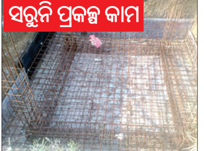
ସରୁନି ପ୍ରକଳ୍ପ କାମ

ହୋଇଯାଇଛି। ଗ୍ରାମବାସୀଙ୍କୁ ଭୋଗ କିମ୍ବା ପାଟଣାଗଡ଼ ବ୍ଲକ ଭରତବନ୍ଦ୍ୟାଳ ପଞ୍ଚାୟତ ତୃଣାସର ଗ୍ରାମରେ ପାନୀୟଜଳ ସଂକଟ ଦେଖାଦେଇଛି। ଏହି ଗ୍ରାମରେ ପାନୀୟଜଳ ସମସ୍ୟା ଦୂର କରିବା ପାଇଁ ରାଜ୍ୟ ସରକାର ଗ୍ରାମ୍ୟ ଜଳ ଯୋଗାଣ ବିଭାଗ ବଲାଙ୍ଗିର ଦ୍ଵାରା ୫୮ ଲକ୍ଷ ୭୪ ହଜାର ବ୍ୟୟରେ ବସୁଧା ଯୋଜନାରେ ଗ୍ରାମର ସମସ୍ତ ପରିବାରକୁ ଜଳ ଯୋଗାଣ ପାଇଁ ଜଳଯୋଗାଣ ପ୍ରକଳ୍ପ ମଞ୍ଜୁର କରିଛନ୍ତି।