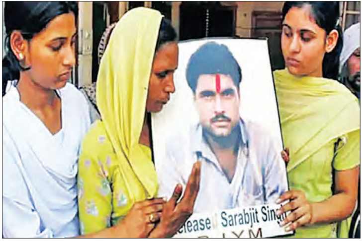
ଇସଲାମାବାଦ, ୧୪୪୪ (ଏକେଡ଼ି)