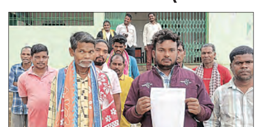
ଆନାର ଦ୍ୱାରରେ ହେଲେ ଗ୍ରାମବାସୀ

ଲାଞ୍ଜିଗଡ଼, ୧୪୪(ସମ୍ପିପ): କଳାହାଣ୍ଡି ଜିଲ୍ଲା ଆଦିବାସୀ ଅଧ୍ୟୁଷିତ ଲାଞ୍ଜିଗଡ଼ ବ୍ଲକ ଭୂମିଗତ ପଞ୍ଚାୟତସ୍ତର ସରକାରୀ ଉଚ୍ଚ ପ୍ରାଥମିକ ବିଦ୍ୟାଳୟରେ ପ୍ରଧାନଶିକ୍ଷକ ମଧ୍ୟାହ୍ନ ଭୋଜନ ଚାଉଳକୁ ବାରମ୍ବାର ହେଉଥିବାରୁ କରୁଥିବା ନେଇ ଗ୍ରାମବାସୀ ଆନାର ଦ୍ୱାରରେ ହୋଇଛନ୍ତି। ଚାଉଳ ହେଉଥିବାରୁ ନେଇ ପଚାରିବାରୁ ଶିକ୍ଷକ ଜଣଙ୍କ ସତ୍ୟାପନକର ଉତ୍ତର ଦେଇ ନ ଥିବା ଯୋଗୁଁ ସେ ଚାଉଳ ବିକ୍ରି କରୁଛନ୍ତି ବୋଲି ସେମାନେ ଅଭିଯୋଗ ଆଣିଥିଲେ। ସୂଚନାଅନୁଯାୟୀ, ପୂର୍ବରୁ ପ୍ରଧାନଶିକ୍ଷକ ୧୦୧୨୩ ଚାଉଳ ଘରକୁ ନେଇଥିବା ବେଳେ ପୁଣି ପରବର୍ତ୍ତୀ ସମୟରେ ସ୍କୁଲରୁ ୮ ବସ୍ତା ଚାଉଳ ନେଇଥିଲେ ବୋଲି ସ୍କୁଲ ପରିଚାଳନା କମିଟି ଅଭିଯୋଗ ଆଣିଥିଲେ। ଏହାକୁ ନେଇ କିଛି ଦିନ ତଳେ ତଦନ୍ତ କରିବାକୁ ଯାଇ କିଛି ମୁଠିମତ ଦେଖି ହେଉଥିବାରୁ ଘଟଣାକୁ ଚାପି ଦେବା ଉଦ୍ୟମ କରିଥିଲେ। ଏନେଇ ଗତ ୧୧ ତାରିଖରେ ନର୍ଲା ଆନାର ଦ୍ୱାରରେ ହୋଇଛନ୍ତି ଅଭିବାଦକ ଓ ଗ୍ରାମବାସୀ। ସେମାନଙ୍କ ଅଭିଯୋଗ ଆଧାରରେ ନର୍ଲା ପୁଲିସ ପକ୍ଷରୁ ଏକ ମାମଲା ରୁଜୁ କରି ତଦନ୍ତ କରୁଥିବା ପୁଲିସ ପକ୍ଷରୁ ସୂଚନା ମିଳିଛି। ସେପଟେ ପାଟିକାମାନେ ମଧ୍ୟ ସ୍କୁଲରେ ରୋଷେଇ କରୁଥିବା ସମୟରେ ଉଚ୍ଚ ପ୍ରଧାନଶିକ୍ଷକ ସେମାନଙ୍କ