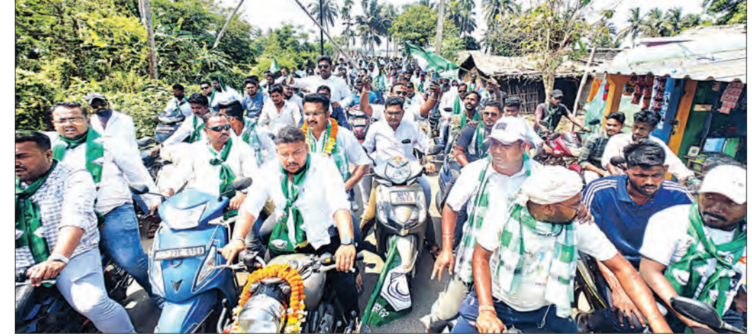
ମାଳତୀପାଟଣାରେ ଦେଇ ପୁରୀ ସଦର ବ୍ଲକର ବିଭିନ୍ନ ପଞ୍ଚାୟତ ସ୍ତରୀ ଭୋଟ ଭିକ୍ଷା କରିଥିଲେ। ମୁଖ୍ୟମନ୍ତ୍ରୀ ନବାନ ପଟ୍ଟନାୟକଙ୍କ ବିକାଶ ଓ ସମସ୍ତ ଜନକଲ୍ୟାଣକାରୀ ଯୋଜନାକୁ ତୁରନ୍ତ ପ୍ରସ୍ତୁତ କରିବା ପାଇଁ ପ୍ରାର୍ଥନା କରାଯାଇଛି।

ନିର୍ବାଚନ ଯେତେ ପାଖେଇ ଆସୁଛି ପ୍ରାର୍ଥୀମାନେ ସେତିକି ତୀବ୍ର ହେଉଛନ୍ତି। କମ୍ ସମୟ ମଧ୍ୟରେ ଯେପରି ଅଧିକ ଭୋଟରଙ୍କ ପାଖରେ ପହଞ୍ଚିବେ ତାହାକୁ ଗୁରୁତ୍ୱ ଦେଉଛନ୍ତି ପ୍ରମୁଖ ଦଳର ପ୍ରାର୍ଥୀ। ଏହି କ୍ରମରେ ପୁରୀ ସଦର ପରେ ଶନିବାରଠାରୁ ପୁରୀ ସଦର ଅଞ୍ଚଳରେ ପ୍ରଚାରକ୍ଷେତ୍ର ସମ୍ପର୍କରେ କରାଯାଇଛି।