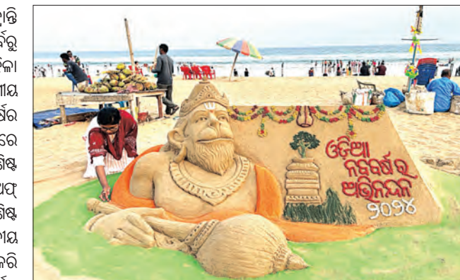
ଓଡ଼ିଆ ଜନଜୀବନ ସମ୍ପର୍କରେ ଅବଗତ ହେଉଛନ୍ତି। ତନ୍ତ୍ରଭାଗା ବେଳାଭୂମିରୁ ପର୍ଯ୍ୟଟକଙ୍କୁ ଆକର୍ଷିତ କରିବାରେ ସରିତାଳ ବାଲୁକା କଳା ସହାୟକଦ୍ୱିଧ ହୋଇଛି।

ପୁରୀ, ୧୩/୪(ସମିପ): ମହାବିଷୁବ ସଂକ୍ରାନ୍ତି ତଥା ମହାବାର ଜୟନ୍ତୀର ଅବ୍ୟବହିତ ପୂର୍ବରୁ ଶନିବାର ପୁରୀ ବେଳାଭୂମିରେ କୋଣାର୍କ ମହିଳା ବାଲୁକାକଳା ସଭା ଗୋଲ୍ଡାୟର ଆକର୍ଷଣୀୟ ବାଲୁକା କଳା ପ୍ରସ୍ତୁତ କରି ଓଡ଼ିଆ ନବବର୍ଷର ଶୁଭେଚ୍ଛା ଜଣାଇଛନ୍ତି।