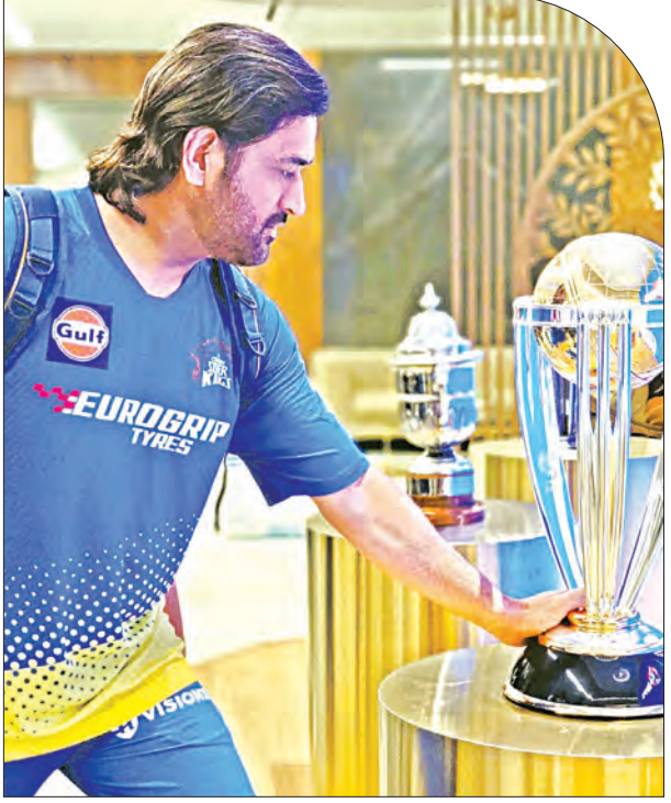
ମୁମ୍ବାଇ, ୧୩/୪ (ଏକେଡ଼ି)

ଭାରତୀୟ କ୍ରିକେଟ୍ ଦଳର ସବୁଠାରୁ ସପନକଥା ଅଧିନାୟକ ମହେନ୍ଦ୍ର ସି ଧୋନିଙ୍କୁ ଶନିବାର ବିଶ୍ୱକପ୍ ଟ୍ରଫି ସହ ଏକ ଭାବପ୍ରବଣ ମୁହୂର୍ତ୍ତରେ ଦେଖିବାକୁ ମିଳିଥିଲା । ଆଇପିଏଲ୍ ମ୍ୟାଚ୍ ଖେଳିବା ଲାଗି ମୁମ୍ବାଇ ଗସ୍ତରେ ଥିବାବେଳେ ଧୋନି ଶନିବାର ସ୍ଥାନୀୟ ବିସିସିଆର ମୁଖ୍ୟାଳୟକୁ ଯାଇଥିଲେ । ଯେଉଁଠାରେ ସେ ୨୦୧୧ ବିଶ୍ୱକପ୍ ଟ୍ରଫିକୁ ଧରିଥିବାର ଦେଖିବାକୁ ମିଳିଥିଲା । ଭାରତୀୟ କ୍ରିକେଟ୍ରେ ସର୍ବୋଚ୍ଚ ସଫା ବିସିସିଆର ଏହାର ସାମାଜିକ ଗଣମାଧ୍ୟମ ଏକ୍ସ୍ରେ ଧୋନି ବିଶ୍ୱକପ୍ ଟ୍ରଫିକୁ ଧରିଥିବାର ଦେଖିବାକୁ ମିଳିଥିଲା । ଭାରତୀୟ କ୍ରିକେଟ୍ରେ କେତୋଟି ପଟୋ ସେଭାର କରିଥିଲା । ଯେଉଁଥିରେ 'ମେଡ୍ ଫର୍ ଇଡ୍ ଅବର୍' ବୋଲି କ୍ୟାପସନ