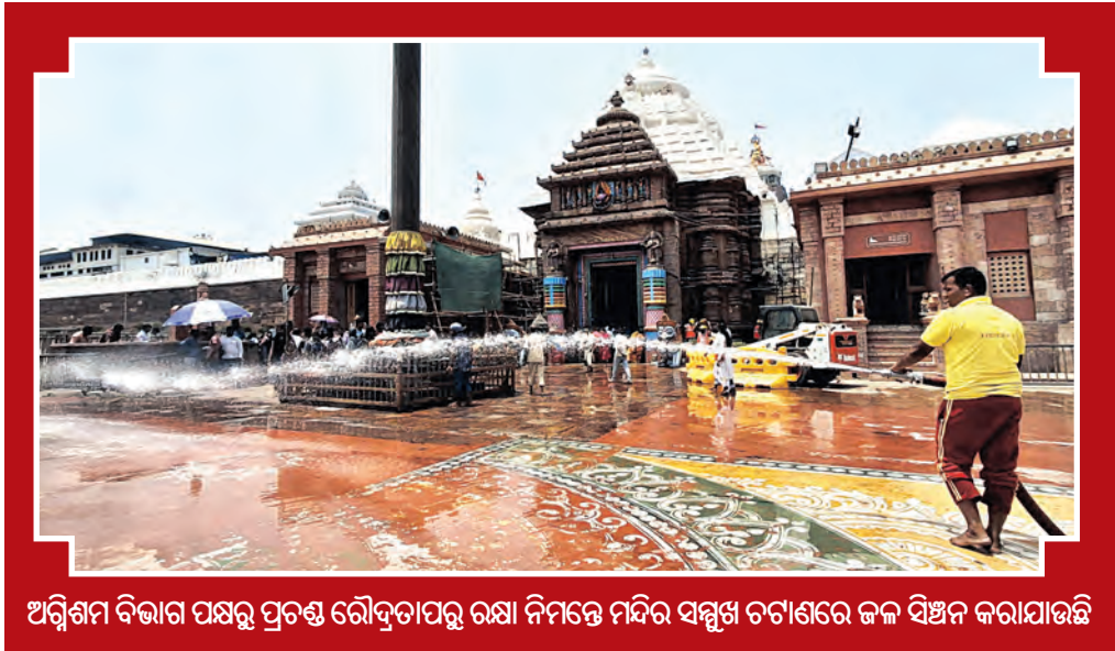
ଅଗ୍ନିଶମ ବିଭାଗ ପକ୍ଷରୁ ପ୍ରତ୍ୟେକ ରୌଦ୍ରପତ୍ରରୁ ରକ୍ଷା ନିମନ୍ତେ ମନ୍ଦିର ସମ୍ମୁଖ ଚଟାଣରେ ଜଳ ସିଞ୍ଚନ କରାଯାଇଛି

ରହଣି ନିମନ୍ତେ ଏହାକୁ ଆଶ୍ରୟ ଲାଭେ ବ୍ୟବହାର କରାଯାଇଥିଲା। ରଥଯାତ୍ରା ସମୟରେ ଏଠାରେ ଯାତ୍ରୀଙ୍କ ରହଣି ନିମନ୍ତେ ଆନୁଷ୍ଠାନିକ ବ୍ୟବସ୍ଥା କରାଯାଏ। ହେଲେ ରଥଯାତ୍ରା ସମୟରେ ପରେ ପୁଣି ପୂର୍ବବଦଳ ପ୍ରତିଷ୍ଠା ଏହି କମ୍ପ୍ଳେକ୍ସ ପାଟକ ମୁକୁଳ ଯୋଗୁ କମ୍ପ୍ଳେକ୍ସ ପରିସରରେ ଗାଈଗୋରୁ ପଶି ଖତା ପରିଶ୍ରା କରୁଛନ୍ତି।