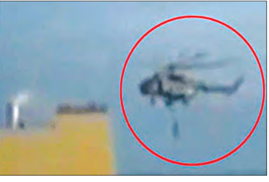
ତେହରାନ, ୧୩୪ (ଏକେଡି)

ଇସ୍ରାଏଲ ବିରୋଧରେ ଇରାନ ଯୁଦ୍ଧ ହୁକ୍କାର ଦେଇଥିବା ବେଳେ ଶନିବାର ଏକ ଘଟଣା ଉଭୟ ରାଷ୍ଟ୍ରଙ୍କ ମଧ୍ୟରେ ଆହୁରି ଉତ୍ତେଜନା ବଢ଼ାଇଛି। ଇରାନ ଉପକୂଳରେ ହର୍ମୁଜ୍ ପ୍ରଣାଳୀ ଦେଇ ହୁବାଇର ଭାରତ ଅଭିମୁଖେ ଆସୁଥିବା ଏକ ପଣ୍ୟବାହୀ ଜାହାଜକୁ ଇରାନର ରିଭୋଲ୍ୟୁସନରୀ ଗାର୍ଡ଼ କବଳା କରିନେବା ପରେ ସ୍ଥିତି ଆହୁରି ଜଟିଳ ହୋଇଛି। ମିଳିଥିବା ଖବର ଅନୁସାରେ ମିଳିତ ଆରବ ଆମିରାତ୍ସ୍ ପ୍ରଜେଭାସ ବନ୍ଦର ନିକଟରୁ ଇରାନ ସେନା ଏହି ଜାହାଜକୁ ନିଜ କବଳାକୁ ନେଇଛି। ଇରାନ ରିଭୋଲ୍ୟୁସନରୀ ଗାର୍ଡ଼ କମାଣ୍ଡୋମାନଙ୍କୁ ହେଲିକପ୍ଟରରେ ଆସି ଏହି ଜାହାଜ ଉପରେ ଓହ୍ଲାଇବା ସହ କାହାଜ କର୍ମଚାରୀମାନଙ୍କୁ ନିଜ କବଳାକୁ ନେଇଥିବା ବିଭିଡ଼ ବିଭିନ୍ନ ଗଣମାଧ୍ୟମରେ ଦେଖିବାକୁ ମିଳିଛି।