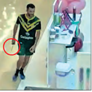
ମହିଳା ପୁଲିସ୍ ଅଧିକାରୀଙ୍କ ଗୁଳିରେ ଆତତାୟୀ ନିହତ ମୃତକଙ୍କ ପ୍ରତି ପ୍ରଧାନମନ୍ତ୍ରୀ ଆଲବାନିଜ୍ଙ୍କ ସମବେଦନା

ସେ ଜଣଙ୍କ ପରେ ଜଣଙ୍କୁ ଆକ୍ରମଣ କରିଚାଲିଥିଲା। ଏହି ମଲ୍ରେ ସୁରକ୍ଷା ଦାୟିତ୍ୱରେ ରହିଥିବା ଜଣେ ମହିଳା ପୁଲିସ୍ ଅଧିକାରୀ ଆତତାୟୀଙ୍କୁ ଅଟକାଇବାକୁ ଉଦ୍ୟମ କରିଥିଲା ବେଳେ ତାଙ୍କ ଉପରେ ମଧ୍ୟ ଆକ୍ରମଣ କରିବାକୁ ଆତତାୟୀ ଜଣଙ୍କ ପଛାରି ନଥିଲା। ତେବେ ଅତି ନିକଟରୁ ମହିଳା ଅଧିକାରୀ ଜଣଙ୍କ ଆତତାୟୀଙ୍କୁ ଗୁଳି କରିବାରୁ ସେଠାରେ ହିଁ ସେ ଚଳିପଡ଼ିଥିଲା ବୋଲି