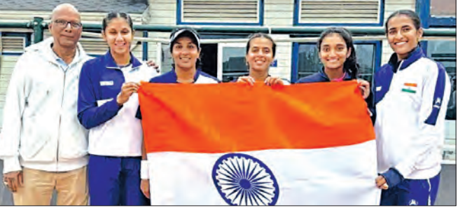
ପ୍ରତିଯୋଗିତାର ପ୍ରଥମ ମ୍ୟାଚ ମହିଳା ଏକଦଳରେ ଖେଳାଯାଇଥିଲା। ଏଥିରେ ଭାରତର ଉତ୍ତରୀୟ ଟିମ୍ ୨-୧ ସିଧାସଳଖ ସେଟ୍ରେ ପ୍ରତିପକ୍ଷ କୋରିଆର ସୋୟୁନ ପାକିସ୍ତାନ ପରାସ୍ତ କରିଥିଲା। ବିଶ୍ୱ ମାନ୍ୟତାର ୩୬୯ତମ ସ୍ଥାନରେ ଥିବା ଚତୁର୍ଥାଙ୍କୁ ଏହି ମ୍ୟାଚ ଜିତିବାକୁ ଏକ ଘଣ୍ଟା ୫ ମିନିଟ୍ ଲାଗିଥିଲା। ଏହାପରେ ବିତାଣ ଏକ ମ୍ୟାଚ ଖେଳାଯାଇଥିଲା। ଏଥିରେ କିନ୍ତୁ ଭାରତର ଅଧିକାଂଶ ରାଜନୀ ୨-୬,

୩-୬ ସେଟ୍ରେ ସୁକ୍ଷିପ୍ତ କାଜାଖ୍ସ୍ତାନ ନିକଟରୁ ବିଜୟ ହାସଲ କରିଥିଲା। ପୂର୍ବରୁ ଗୁରୁବାର ଭାରତ ସମାନ ହାସଲ କରିଥିଲା। ପଳରେ ମୁକାବିଲା ୧-୧ ସମାପ୍ତ ହୋଇଥିଲା। ଭାରତ ଏଥିସହ ଫୁଲ୍-ଏଫରେ ୪ ମ୍ୟାଚ ଖେଳି ୩ ବିଜୟ ଓ ଖେଳାଯାଇଥିଲା। ଏହି ମ୍ୟାଚରେ ଭାରତର ଶୁକ୍ରବାର ଖେଳାଯାଇଥିବା ଫୁଲ୍-ଏଫ ଏକ ମ୍ୟାଚରେ ଭାରତୀୟ ମହିଳା ଟେନିସ ଦଳ ୨-୪ ସିଧାସଳଖ ସେଟ୍ରେ କୋରିଆ ଯୋଡ଼ି ତାବିନ କିପ୍ ଓ ପାକିସ୍ତାନ ହରାଇଥିଲେ। ଏଥିସହ ଭାରତ ୨-୧ରେ ବିଜୟ ଲାଭ କରିଥିଲା।